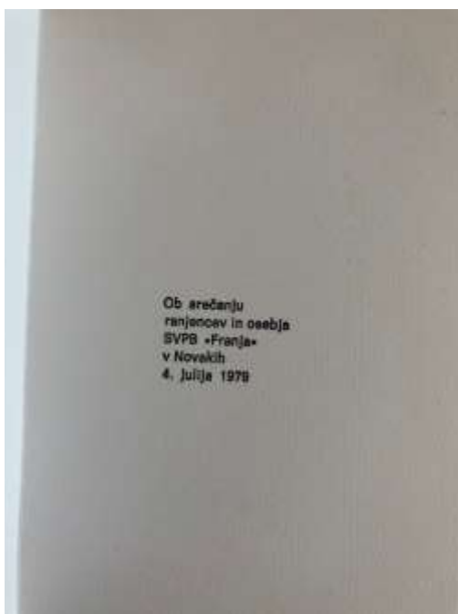
Slika 16: Vsebina vabila na povojno srečanje