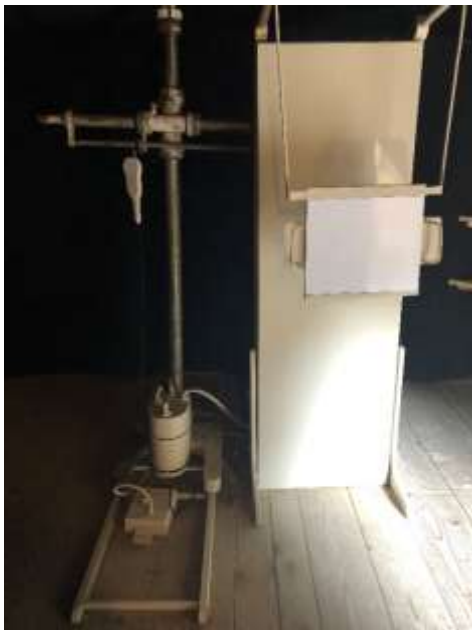
Slika 3: Konstrukcija prvotnega rentgena v baraki za rentgen