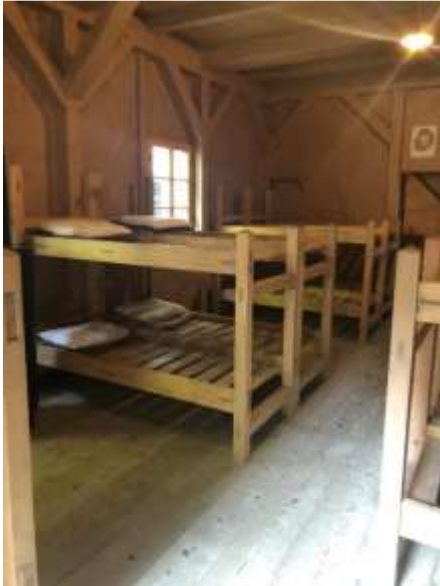
Slika 4: Baraka za ranjence

Veliko stvari in opreme, med drugim tudi les za gradnjo barak, so priskrbeli okoliški prebivalci, predvsem kmetje. Les za gradnjo prvih barak so obdelali kar na mestu same gradnje. Nekaj barak je bilo narejenih že v Cerknem in so jih nato v grapi samo sestavili. Ob koncu delovanja je bolnica imela 14 barak.