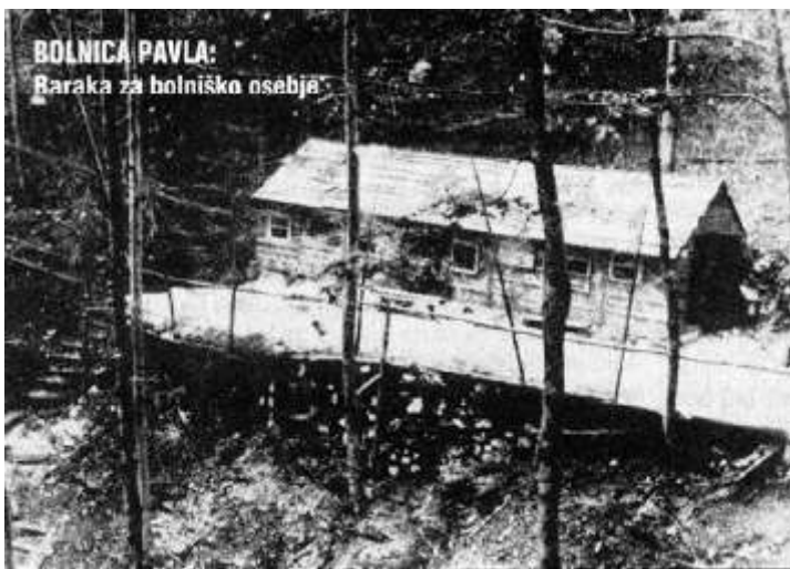
Slika 17: Partizanska bolnica Pavla