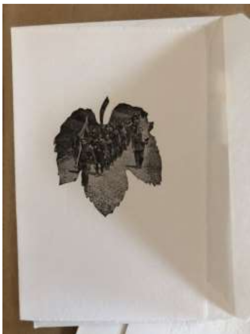
Slika 15: Vabilo na povojno srečanje ranjencev in osebja SVPB Franja