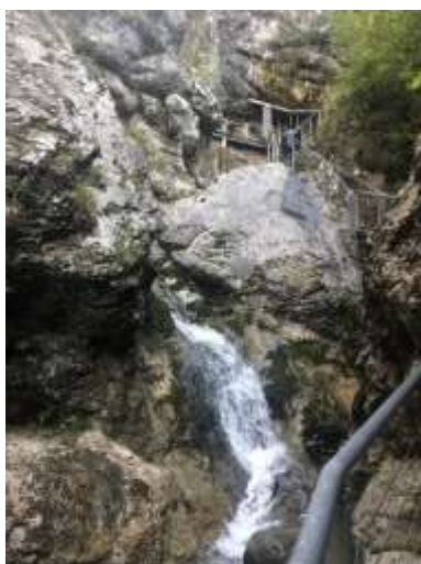
Slika 2: Pot do bolnice Franja

Njegova pripoved, zapisana ob poti do SVPB Franja, slikovito oriše pot, po kateri so morali hoditi in zraven še nositi ves material. Tudi sama sem ob ogledu bolnice opazila, da je pot še vedno zelo razgibana, čeprav je danes urejena. V takratnem času je bila pot neurejena, vojaki so si jo utirali sproti. Nošnjo materiala pa jim je oteževalo tudi vreme, saj so bolnico gradili novembra.