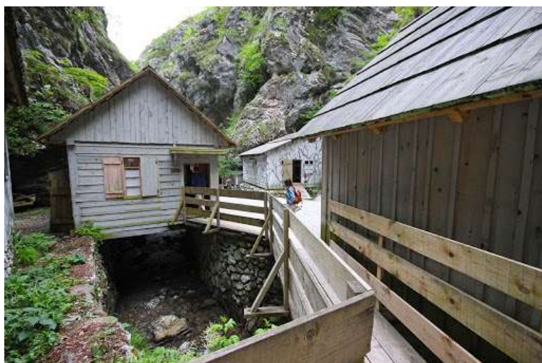
Slika 8: Partizanska bolnica Franja danes