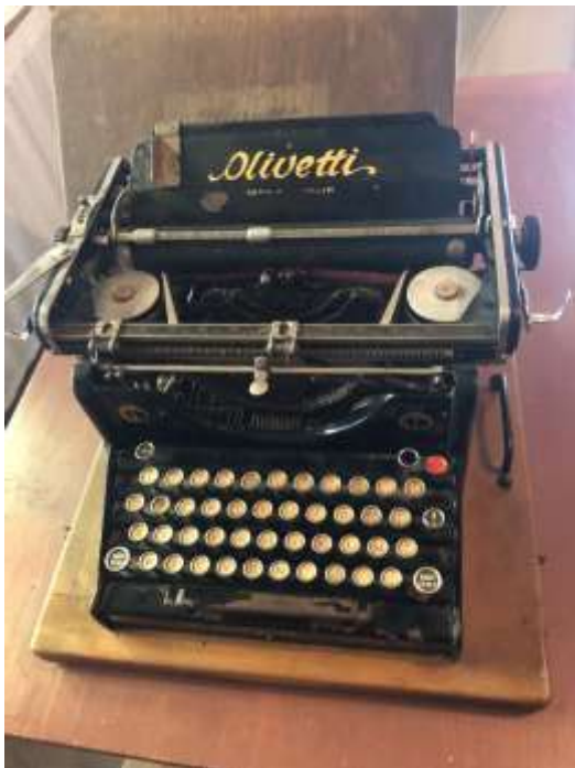
Slika 19: Pisalni stroj razstavljen v bolnici Franja