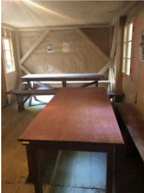
Slika 18: Prostor za zabavo