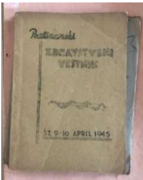
Slika 10: Bolnišnični list bolnice Franja