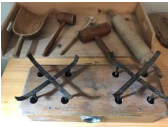
Slika 5: Pripomočki v takratni kuhinji SVPB Franja

Odlično je bila organizirana celo oskrba z zdravili in obvezami. Pri tem so morda imeli večjo vlogo domačini, saj so nakup zdravil v lekarnah nadzorovali okupatorji. Ljudi to ni ustavilo in so se znašli po svoje. Obveze so sešili iz starih rjuh, plenice ali platna. Vse skupaj so skrbno oprali in poslali v paketu. Prostor za zdravila in obveze je bil v predprostoru operacijske barake. Tu je bila tako imenovana lekarna in prostor za sterilizacijo. Leta 1944 je v bolnišnico (tako kot pri oskrbi s hrano) prišla tudi prva sanitetna pošiljka zaveznikov.