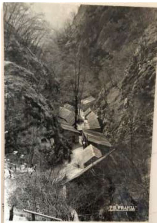
Slika 7: Partizanska bolnica Franja nekoč

Sedaj so vse barake obnovljene in SVPB Franja je ponovno na voljo za ogled. Je namreč dokaz človeške iznajdljivosti in solidarnosti do sočloveka. Prav zato ni pomembna le za Slovenijo, temveč za vso človeštvo.