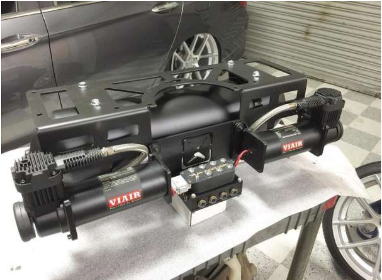
Slika 24: Batni kompresorji

Kompresorji so delovni stroji. Poznamo dve veliki skupini: prostorninske ali izrivne in turbinske ali pretočne kompresorje. Prostorninski kompresorji se delijo naprej na batne, ki so najpomembnejši, na rotacijske in na membranske kompresorje.