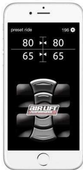
Slika 26: Prikaz aplikacije na telefonu