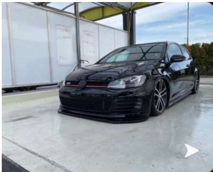
Slika 25: Končni izdelek

Ta komplet za upravljanje zračnega dviga ponuja vse, kar je potrebno za upravljanje zraka novega sistema zračnega vzmetenja.