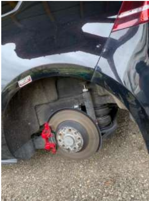
Slika 10: Prikaz zračne blazine

Pri sami vgradnji do sedaj ni bilo posebnih težav, saj so bila navodila jasna in podrobna. Za vsak vijak na avtomobilu je navedeno, kje ga je potrebno odviti, za lažjo predstavo pa so navodilom priložene tudi fotografije.