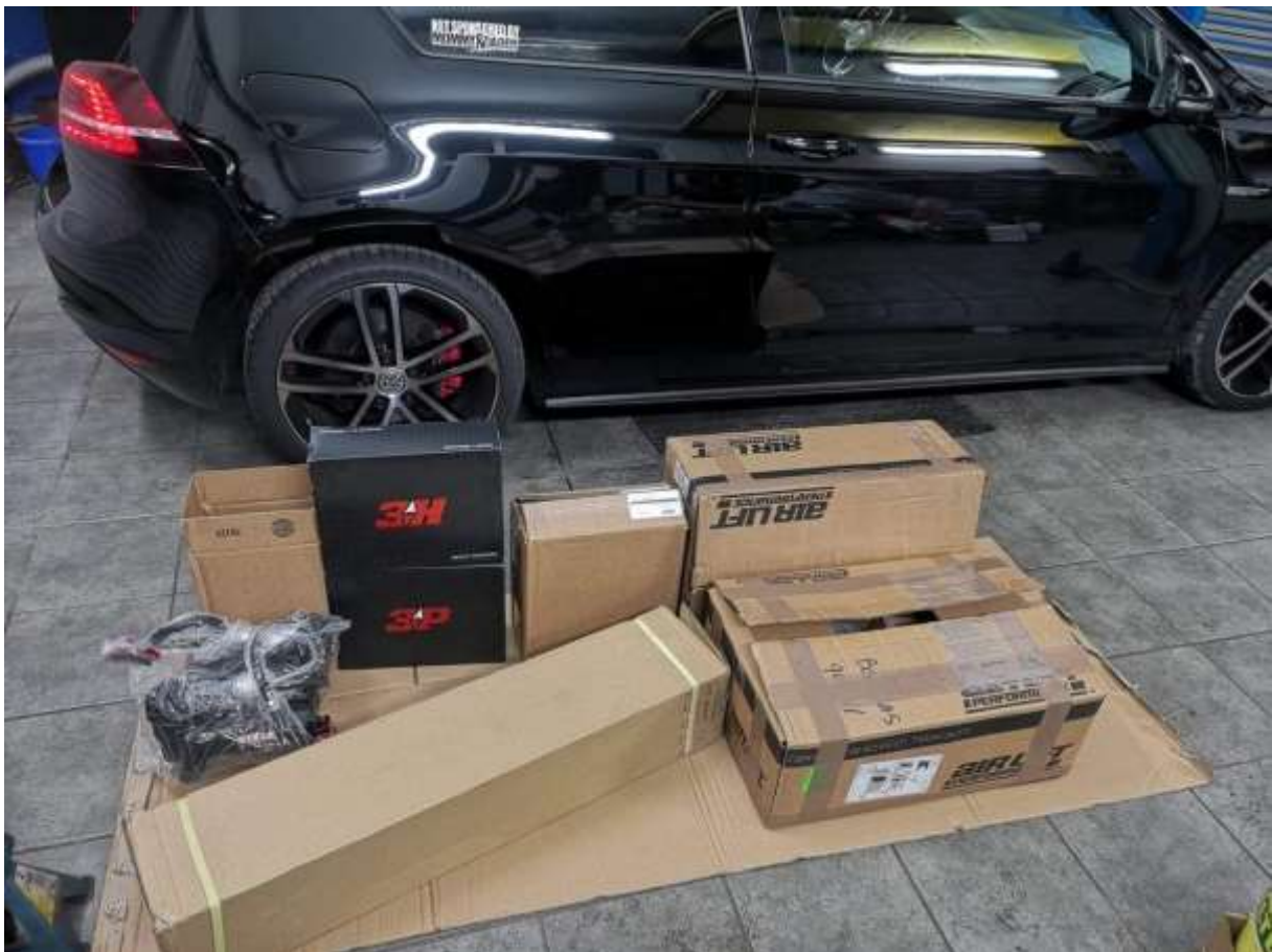
Slika 3: Air Lift sistem

Ko sem se odločil za nakup in vgradnjo sistema air lift, sem se povezal z Boštjanom Rožmanom iz Novega mesta, natančneje iz Brežic.