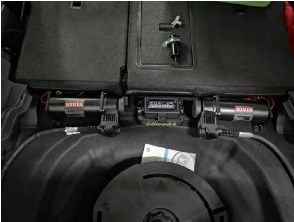
Slika 12: Prikaz menedžmenta