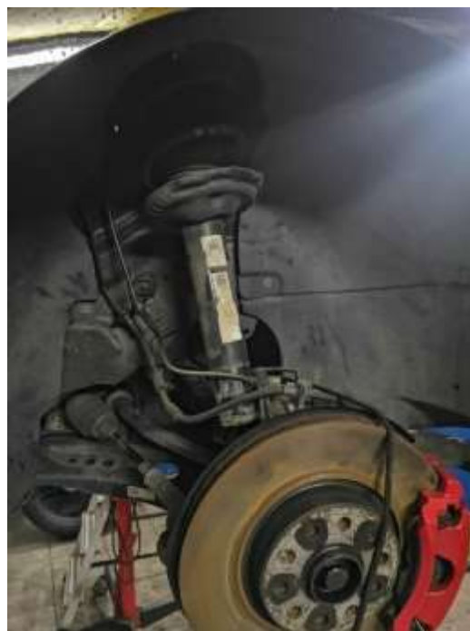
Slika 5: Prikaz starega amortizerje

V samem avtomobilu so se odstranili sprednji in zadnji sedeži, ter vse plastike na dnu avtomobila za olajšanje same vgradnje sistema.