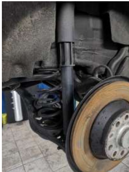
Slika 9: Prikaz vzmeti

V naslednjem koraku smo odstranili še zadnje amortizerje in vzmeti, ter vgradili nove blazine in nove amortizerje.