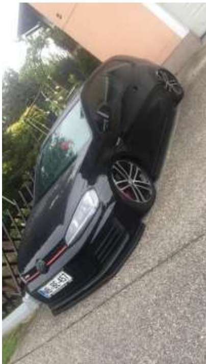
Slika 22: Končni izdelek

Ob končani optiki in vseh pregledih, se je avtomobil peljalo na Avto Krka v Mariboru. Tam se je vse poslikalo in vpisalo v sam homologacijski kartonček.