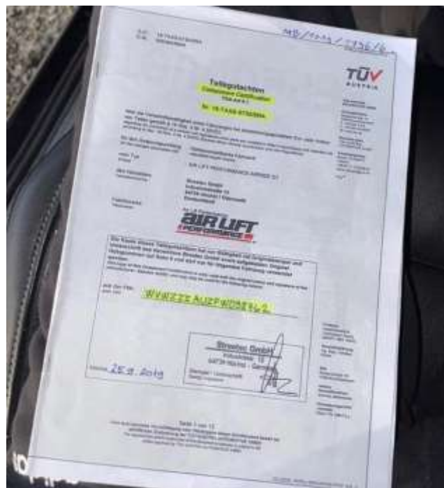
Slika 20: Homologacijski papirji

Ko je bil varnostni postopek zaključen, smo rezultat slikali zaradi nadaljnje homologacije. Prav tako se je napisalo potrdilo o vgradnji, ki je potrebno pri homologaciji.