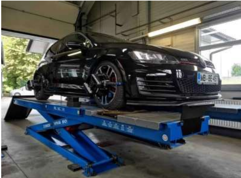
Slika 21: Optika