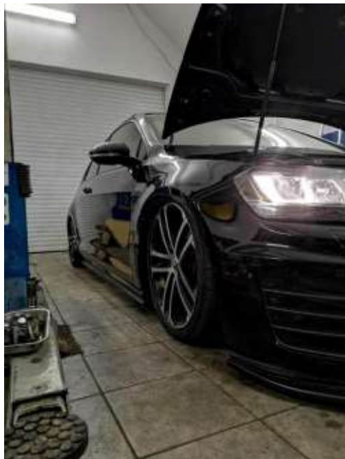
Slika 17: Končno stanje vgradnje

Po tem so sledili še sami pregledi montaže zaradi varnosti in samo testiranje tesnitve vseh blazin, ter priključitev blazin s cevmi do rezervoarja.