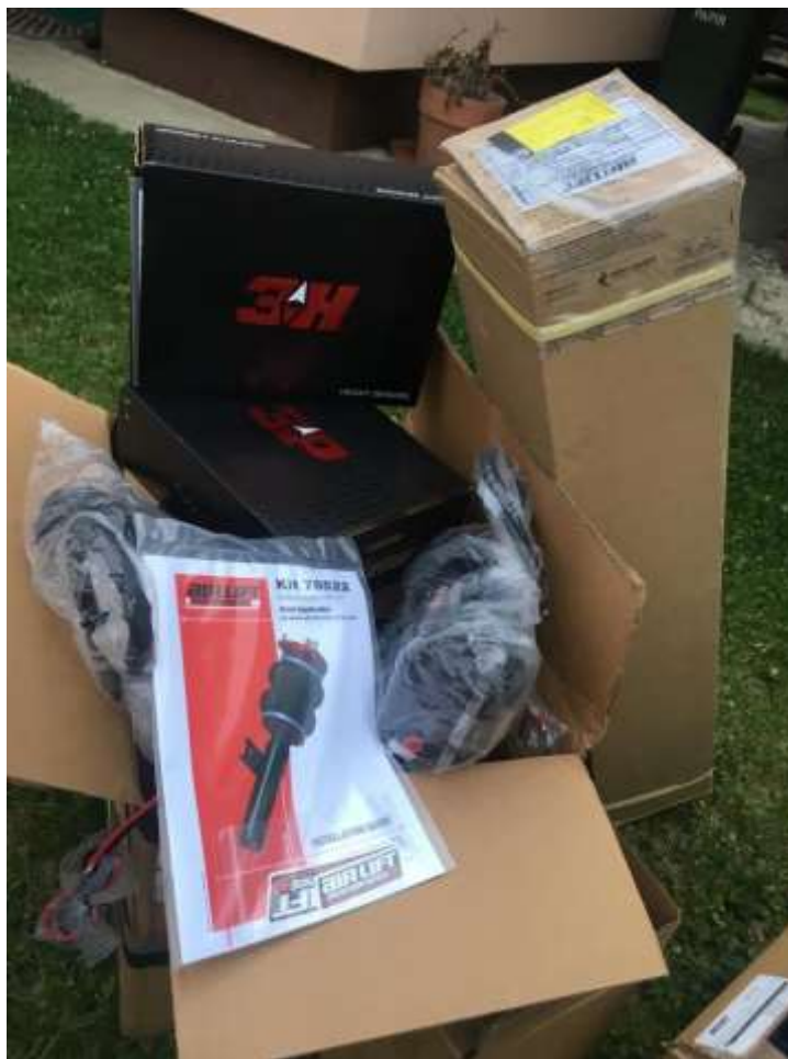
Slika 1: Material za vgradnjo sistema

V tej nalogi bom predstavil Air lift performance 3h, pri čemer gre za nastavljivo zračno vzmetenje. Za samo vgradnjo zračnega vzmetenja sem se odločil, ker zelo rad vizualno predelujem avte. Zaradi interesa za air lift, sem pridobil veliko novih informacij o samem zračnem vzmetenju 3h. S samim air lift sistemom, vgrajenim na avtomobil, pa sem nadpovprečno zadovoljen. V predstavitvi bom podrobneje opisal vgradnjo sistema ter sam sistem, ki je zgrajen iz dveh kompresorjev, rezervarja, senzorjev in štirih novih amortizerjev ter seveda štirih blazin.