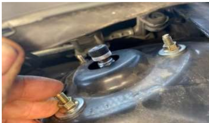
Slika 7: Vgradnja

Nastavil se je tudi naklon koles. Spredaj 1 stopinja in 50 minut, zadaj pa 2 stopinji in 50 minut.