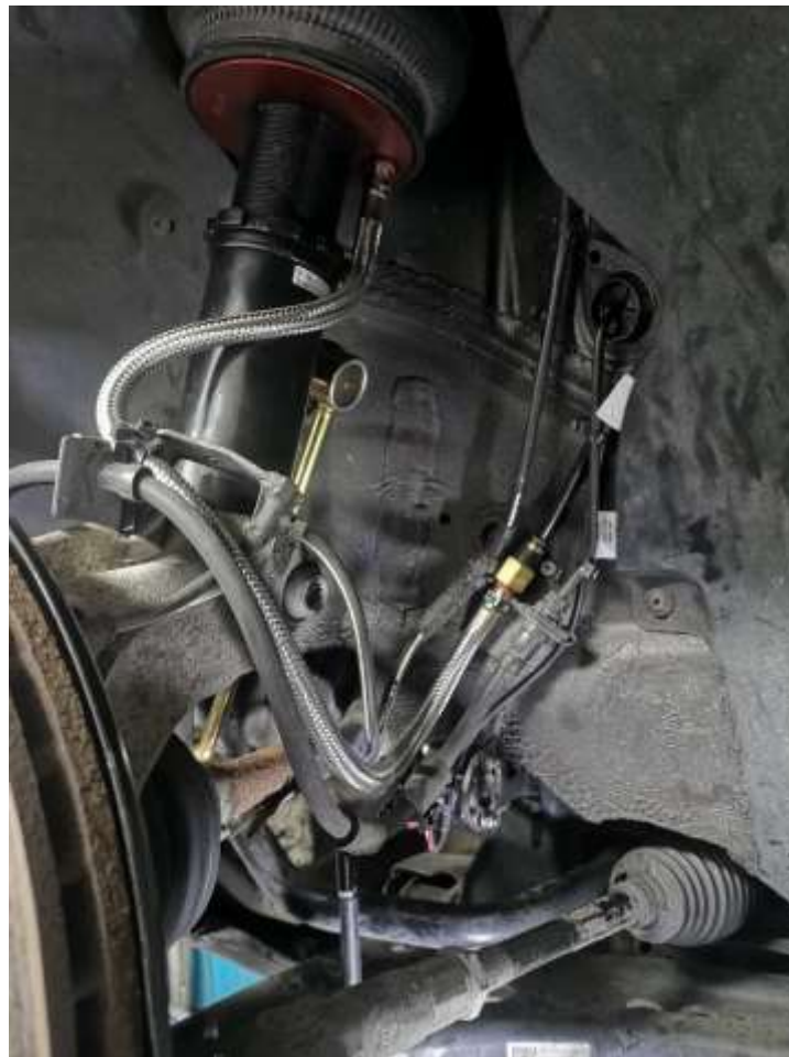
Slika 14: Priključki

Naslednja poteza je bila vgradnja poti cevi za nadaljnje priključevanje air lifta s krmilnim mehanizmom v prtljažnem prostoru. Nato so se priključile prednje blazine, cevi pa se je nameščalo spredaj v notranjost kabine, in nato razporedilo pod plastike v kabini. V naslednjem koraku je sledil enak postopek še za zadnje blazine. Ko smo imeli cevi vseh blazin v prtljažnem prostoru, smo v kabino potegnili kabel za display, ki nam prikazuje tlak (enota psi) za vsako posamično blazino. Omogoča nam tudi dviganje in spuščanje avtomobila izven vozne višine, ki se nastavi poljubno. Pri dviganju oziroma spuščanju z vozne višine, je največja dovoljena hitrost 50km/h.