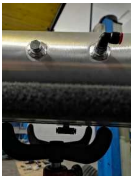
Slika 18: Rezervoar

Po tem so sledili še sami pregledi montaže zaradi varnosti in samo testiranje tesnitve vseh blazin, ter priključitev blazin s cevmi do rezervoarja.