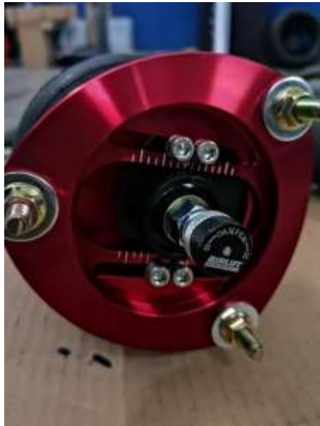
Slika 8: Nastavljanje trdote

V naslednjem koraku smo odstranili še zadnje amortizerje in vzmeti, ter vgradili nove blazine in nove amortizerje.