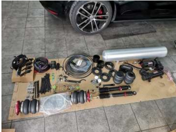
Slika 4: Odpiranje paketov in delov

Sistem sem naročil iz Nemčije, ko pa je paket prispel, sem takoj kontaktiral Boštjana za vgradnjo.