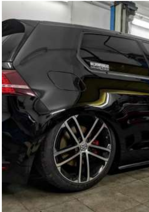
Slika 19: Končni rezultat 0.bar.

Ko je bil varnostni postopek zaključen, smo rezultat slikali zaradi nadaljnje homologacije. Prav tako se je napisalo potrdilo o vgradnji, ki je potrebno pri homologaciji.