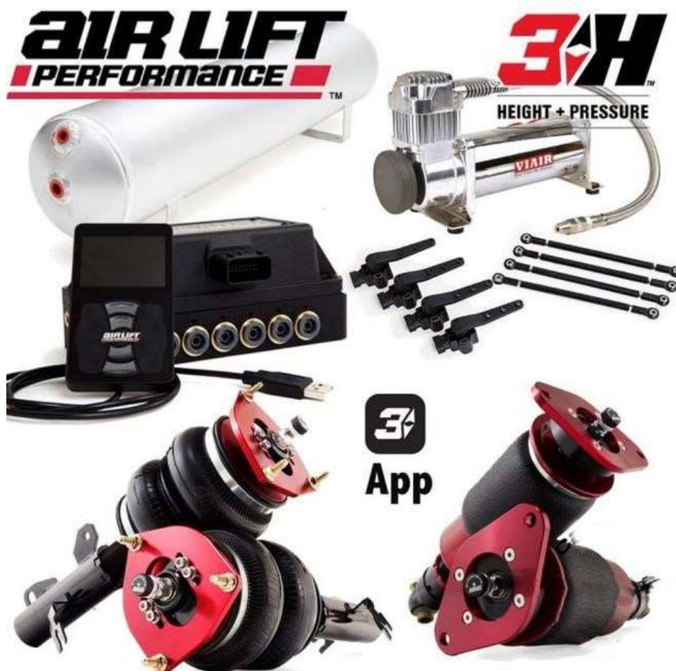
Slika 2: Prikaz delov