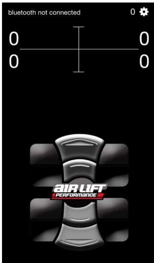
Slika 15: Air Lift daljinec

Sledila je vgradnja vseh tapet in sedežev nazaj v kabino avtomobila. Šele nato smo začeli s priklapljanjem samega krmilnega mehanizma z vsemi blazinami, ob končanem priklopu pa je sledila kalibracija sistema.