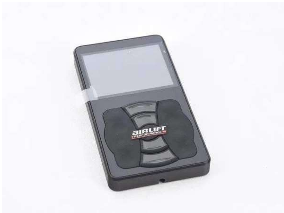
Slika 27: Prikaz daljinca Air Lift