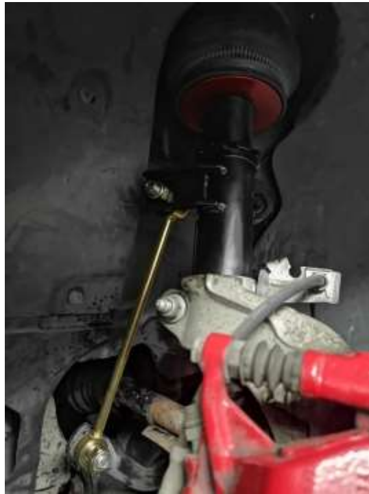
Slika 6: Novi amortizer in blazina

Na sprednjem delu se je vgradil nov amortizer z blazino, na samem amortizerju se je pa nastavila še trdota samega vzmetenja. (od 0 do 30)