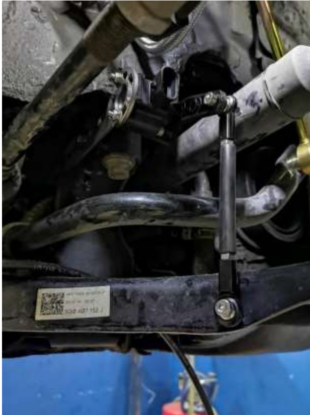
Slika 16: Prikaz senzorjev

V kolikor se v avtomobil naloži na primer 500 kilogramov, se blazine stisnejo skupaj približno 5psi, po nekaj sekundah pa se avto sam izravna na vozno višino na vsaki strani posebej. Prav tako blazine kontrolirajo nagib avtomobila v ovinkih. Senzorji so uporabni tudi takrat, ko se avto spusti do tal, saj zaznavajo teren in se ne izpraznijo popolnoma, kadar teren ni raven. To je koristno predvsem zato, da avto ne nasede.