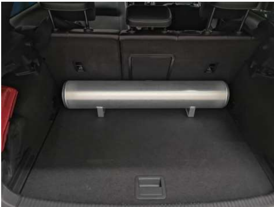
Slika 13: Rezervoar zraka

Sledilo je povezovanje kompresorjev s samim avtomobilskim akumulatorjem in vgrajevanje varovalk proti izpraznitvi akumulatorja.