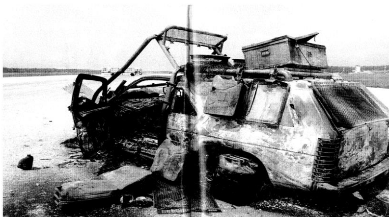
Slika 2: Avto avstrijskih novinarjev, Brnik, 28. VI. 1991 (Deset dni vojne za Slovenijo, 1991, str. 24)

Jaz: Kaj ste bili v času vojne, čin pa to?