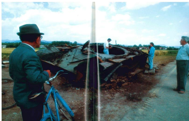
Slika 3: Tank JLA pri Trzinu, Trzin, 30. VI. 1991 (Deset dni vojne za Slovenijo, 1991, str. 55)