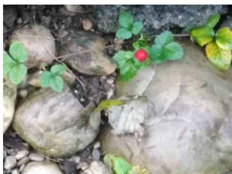
Slika 2: Jagode na šolskem vrtu

Ledeniki se topijo in s tem se dviga morska gladina. Z dviganjem morske gladine so potem v nevarnosti otoki in prebivalci otokov, saj lahko potonejo. Zakaj pa sploh pride do tega? Zaradi onesnaževanja zraka se segreva Zemljino podnebje. Zato je kriv ogljikov dioksid, ki se sprošča ob gorenju lesa in oglja. V 19. stoletju je zrastle temperatura za 0,5°C, kar je že za tisto stoletje zelo veliko. V letu 2100 pričakujejo, da se bo temperatura dvignila za 3°C, kar je grozno. Med zimo v zadnjih letih zelo redko zapade sneg, Zemljini letni časi so pomešani zaradi zviševanja temperature (najdemo jagode ali trobentice na vrtu ob začetku zime). Če ne bomo česa ukrenili, bo voda poplavela tudi večje in manjše države ( npr. to grozi otoški državi Tuvalu in morska gladina lahko poplavi tudi Nizozemsko). (Kralj Serša, M., Jeršin Tomassini , K., Nemeč, L., 2016)