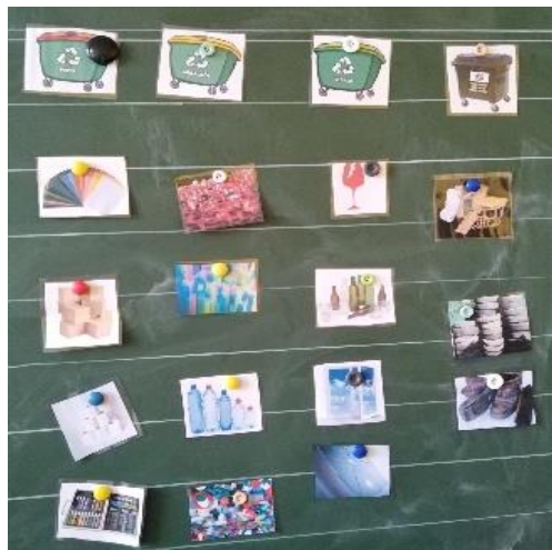
Slika 13: Razvrščanje odpadkov