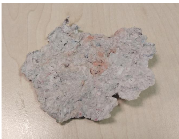
Slika 16: Novo nastali papir