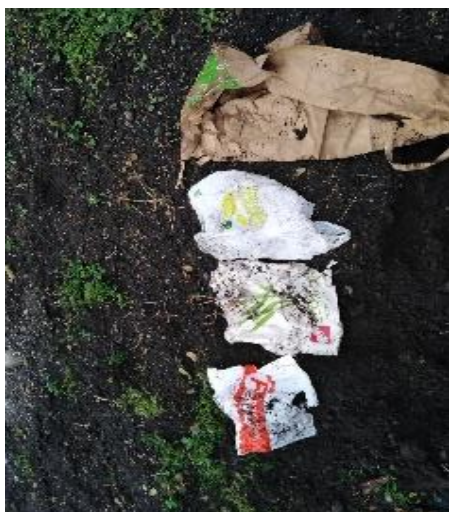
Slika 5: Vrečke