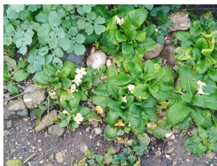
Slika 3: Trobentice na šolskem vrtu (Vir: avtorici, 2019)