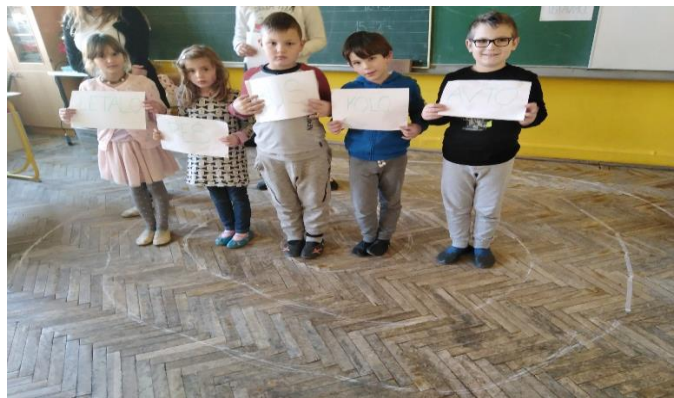
Slika 10: Zaključek igre