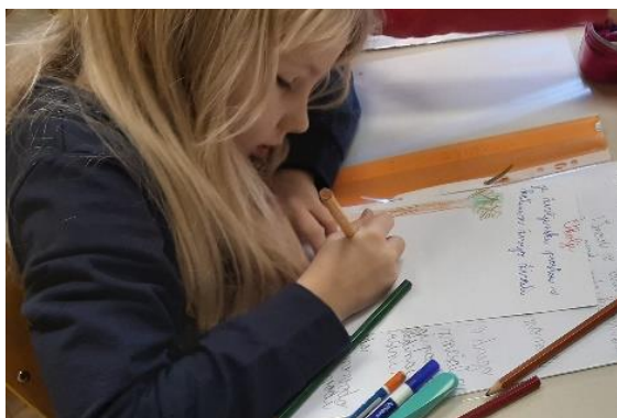
Slika 11: Možganska nevihta