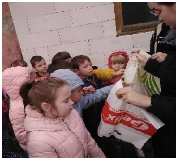
Slika 6: Tipanje vrečk različnega materiala