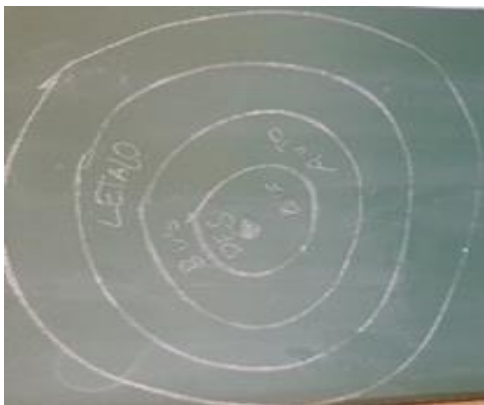
Slika 9: Igra