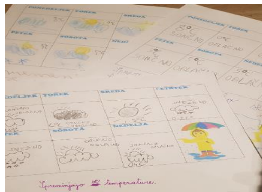
Slika 12: Izpolnjena tabela