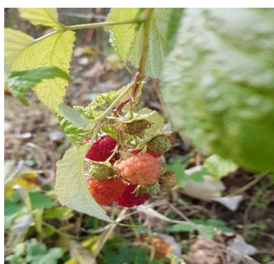
Slika 4: Maline na šolskem vrtu