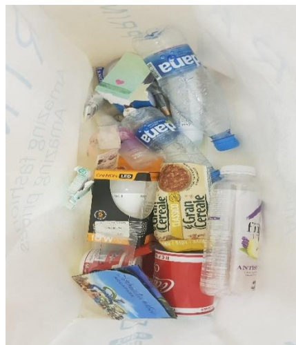
Slika 14: Odpadki