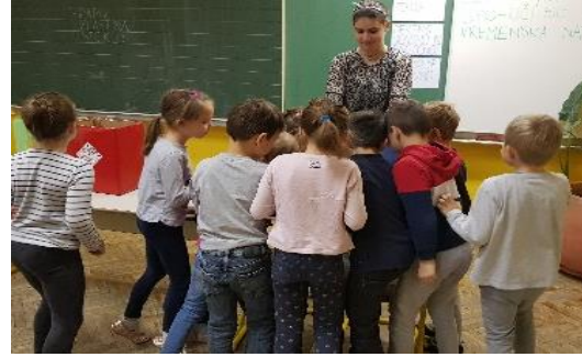
Slika 8: Razvrščanje odpadkov