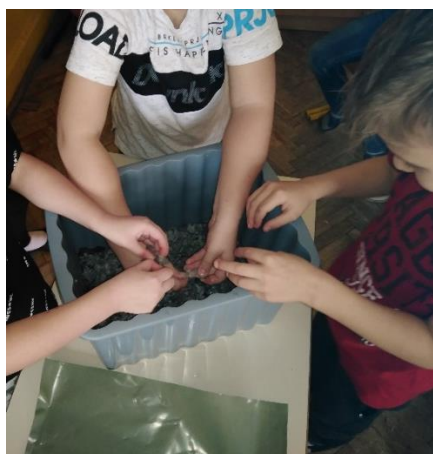
Slika 15: Priprava