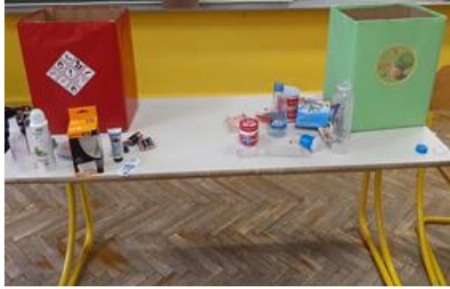
Slika 7: Odpadki