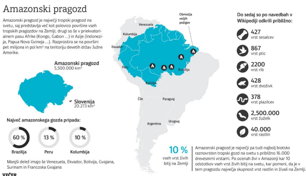
Slika 1: Amazonski pragozd

S spodnje slike je razvidna velikost Amazonskega gozda v primerjavi s Slovenijo. Prikazuje površine, kjer je gorel gozd.