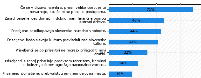
Graf 1: Predsodki med anketiranci (lasten vir)

Najpogostejši predsodek, s katerim se strinja 71% (99) vprašanih, je, da so večje količine priseljencev naenkrat nevarnejše kot postopno priseljevanje. Z vsemi ostalimi se strinja manj kot polovica vprašanih. Najmanj razširjen predsodek, s katerim se strinja le 19% (27) vprašanih, je, da priseljenci domačinom jemljejo delovna mesta.