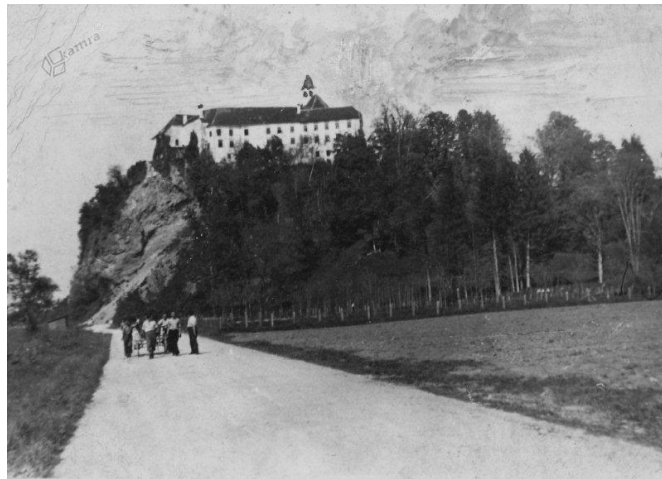
Slika 6: Vpreženi jetniki, ki v grad vozijo vodo v 300-litrskih sodih. 6

Prav tako je o taborišču na Borl pisal Tone Ferenc, in sicer da so Nemci l. 1941 grad Borl spremenili v zbirno in prehodno taborišče, iz katerega so pošiljali Slovence sprva v Srbijo, pozneje pa v razna koncentracijska taborišča v Avstriji in v Nemčiji. Ko so l. 1942 pripravljali zaporniki upor proti Nemcem na Borlu in se jim ta upor ni posrečil, so Nemci odpeljali zapornike v druge zapore in je ostal grad Borl prazen (Ferenc, 1998).