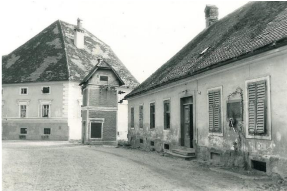
Slika 4: Nekdanji sodni zapori na Ptujju. 4

Najbolj so se ptujске ječe s političnimi zaporniki polnile po boju v Mostju. Mnoge med njimi so nato odpeljali na streljanje v Maribor in Celje, nekatere pa v nemška koncentracijska taborišča. V ptujskih sodnih zaporih je 18. avgusta 1942 umrl tudi član OF in borec Slovenskogoriške čete Jože Lacko. 3