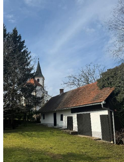
Slika 9: Rojstna hiša, v ozadju cerkev.

Že naslednji dan pa se ti Nemci preselijo v župnijski dom pri cerkvi.