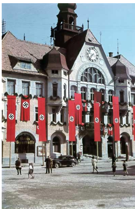
Slika 3: Mestna hiša na Ptuju v času nemške okupacije. 2