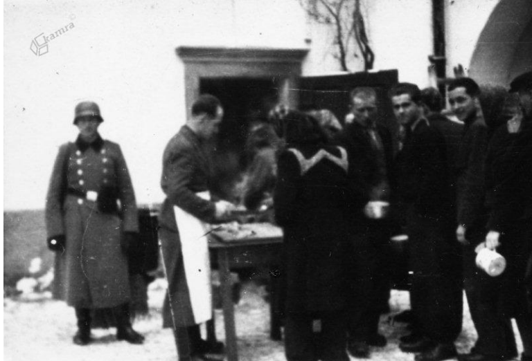
Slika 7: Zbirno taborišče za Slovence na Borlu med 1941 in 1943.

nemštva. Do novembra 1943 je bil nenaseljen, ko so v njem uredili stanovanja vojakov, ki so stražili most preko Drave, in delavcev, ki so kopali protitankovske jarke na meji s Hrvaško. V tem času so na gradu večkrat izvedli tečaje za voditelje nemške mladine. 7