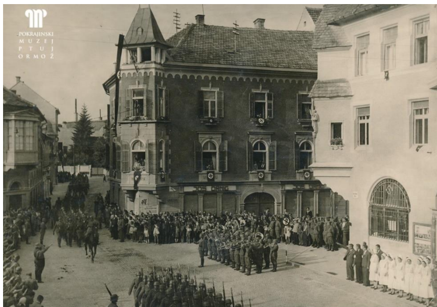
Slika 2: Prve enote nemške vojske na Ptuju 8. aprila 1941. 1