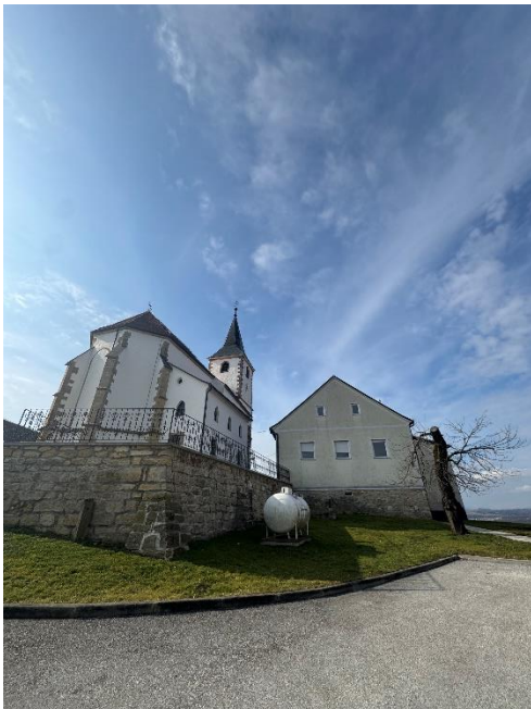
Slika 10: Cerkev sv. Andraža v Slovenskih goricah.

Že naslednji dan pa se ti Nemci preselijo v župnijski dom pri cerkvi.