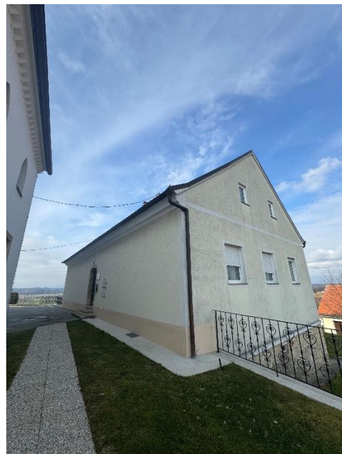
Slika 11: Župnijski dom ob cerkvi.