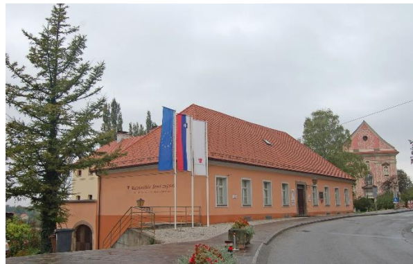
Slika 5: Stavba Stari zapori danes. 5