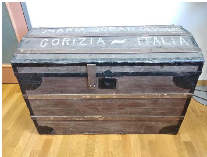
Slika 6: Skrinja aleksandrinke (Darinka Kozinc)