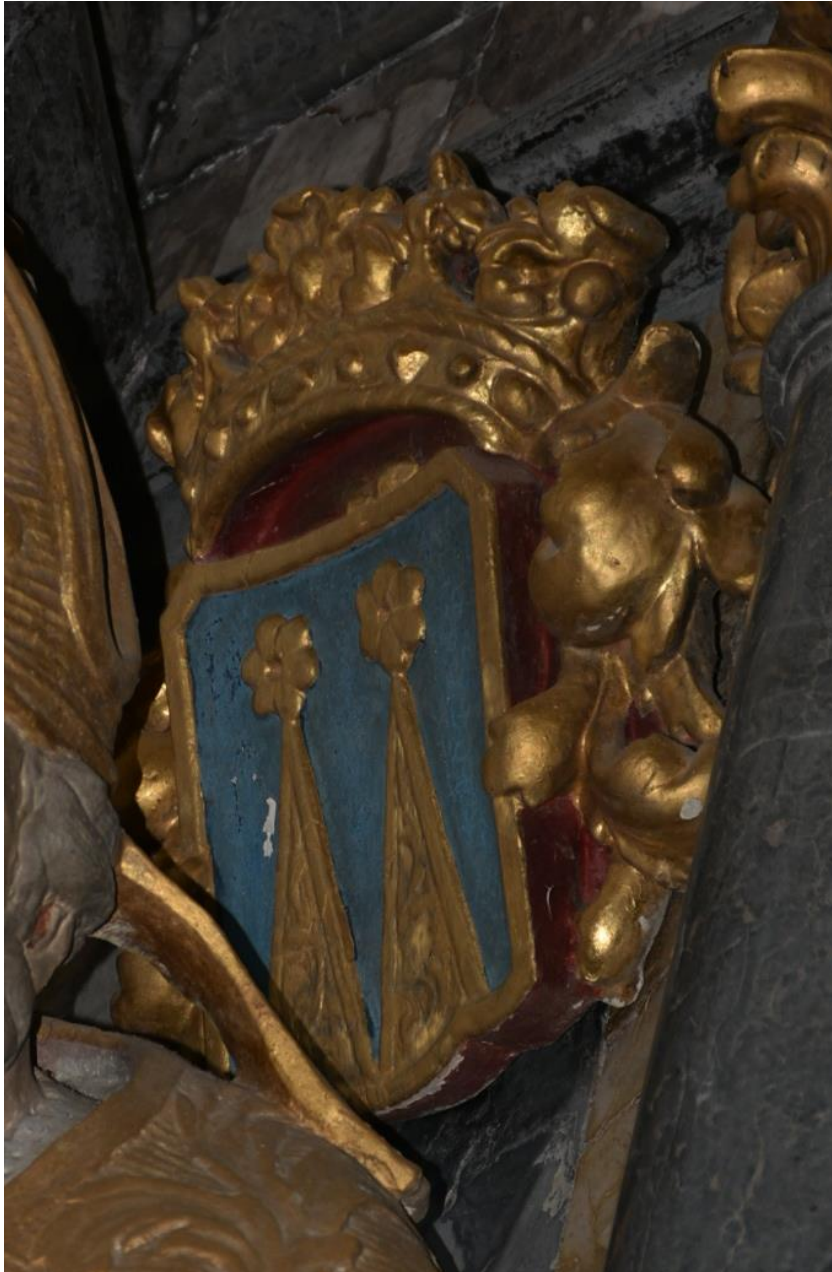
Slika 10: Grb plemiške družine Rehlingen

Predmet najine raziskave pa je grb nad sv. Martinom, ki do nedavnega še ni bil identificiran. Na podlagi modre barve sta dva trikotnika, v katerih se vijejo neenakomerne krivulje. Na vrhu vsakega trikotnika je cvet, nad grbom pa krona. Modra je le podlaga grba, vse ostale podrobnosti pa so zlate.