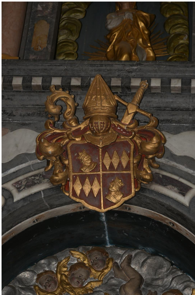
Slika 8: Grb Freisinških škofov na glavnem oltarju

Nad reliefom Poklona Svetih treh kraljev je grb Freisinških škofov, natančneje knezoškofa Janeza Frančiška, ki je deloval med letoma 1695 in 1727. Rdeče-zlat grb je z navpično in vodoravno črto razdeljen na štiri dele. Diagonalno sta upodobljena zamorca in trije rombi, nad grbom pa so škofovska palica, meč, mitra in viteška čelada.