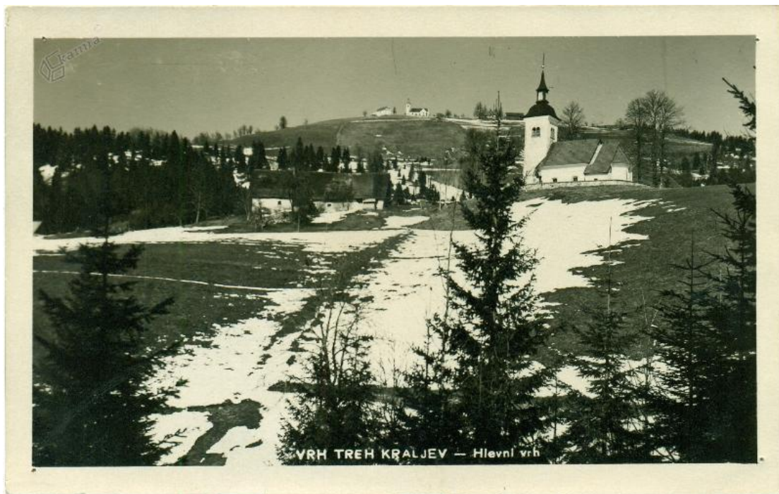
Slika 4: Razglednica s podobo cerkve svetega Nikolaja v Hlevnem Vrhu z Vrhom Svetih Treh Kraljev v ozadju, nastala v letih od 1930 do 1950

Poleg vrhovske cerkve Svetih treh kraljev sta na tem območju stali še dve cerkvi: v Hlevnem Vrhu cerkev svetega Nikolaja in na Hlevišah cerkev svete Katarine. Cerkev svetega Nikolaja je bila omenjena že leta 1529 in še vedno stoji. Ljudsko izročilo pravi, da je nekoč grič, na katerem stoji cerkev, obdajalo jezero. 5 Cerkev svete Katarine, ki je stala približno 800 metrov zahodno od cerkve svetega Nikolaja v Hlevnem Vrhu, ne stoji več, saj je menda pogorela med letoma 1786 in 1796. Potrebe po gradnji nove cerkve ni bilo, saj sta bili v neposredni bližini že zgoraj omenjeni cerkvi, možno pa je, da je na novo niso gradili tudi zaradi jožefinske reforme, ki se ni tako zavzemala za cerkev. Okoliški prebivalci še vedno hranijo predmete, ki so nekoč stali v cerkvi. 6