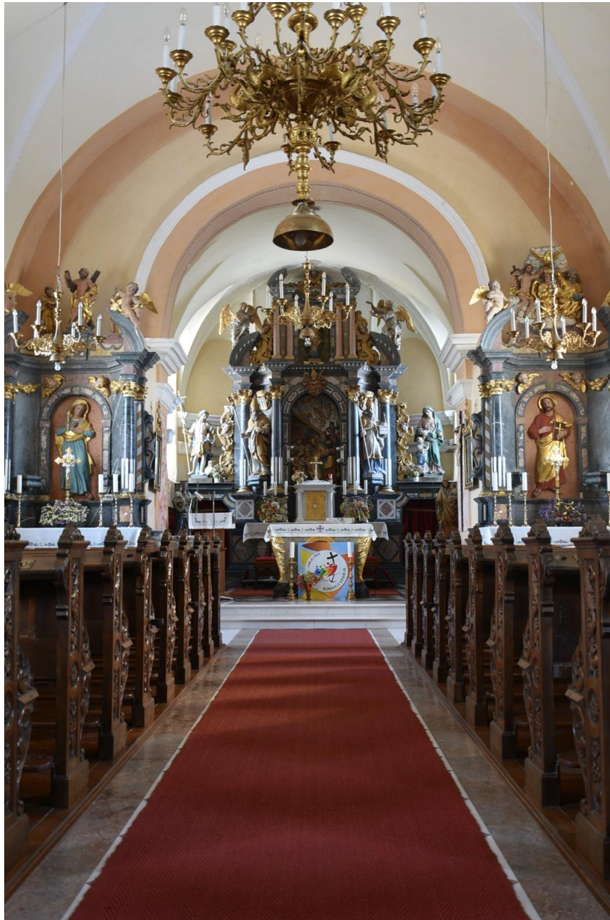
Slika 7: Notranja podoba cerkve

Glavni oltar je iz črnega apnenca, okrašen pa je s številnimi inkrustacijami 8 iz pisanih apnencev, konglomerata in breče. Nad tabernakljem iz belega apnenca je v oltar vdolan relief Svetih treh kraljev, nad katerimi je grb Freisinških škofov. Desno od reliefa na kamnitem podstavku stoji kip sv. Volbenka, ki v rokah drži škofovsko palico in cerkev s sekiro v strehi. Nad njim je grb rodbine Halden zu Neidberg, baronov Anthereidt. Desno od kipa sv. Volbenka stoji še kip male Marije in sv. Ane. Na levi strani reliefa Svetih treh kraljev na kamnitem podstavku stoji kip, ki bi lahko bil zaradi izrazite geste, s katero drži