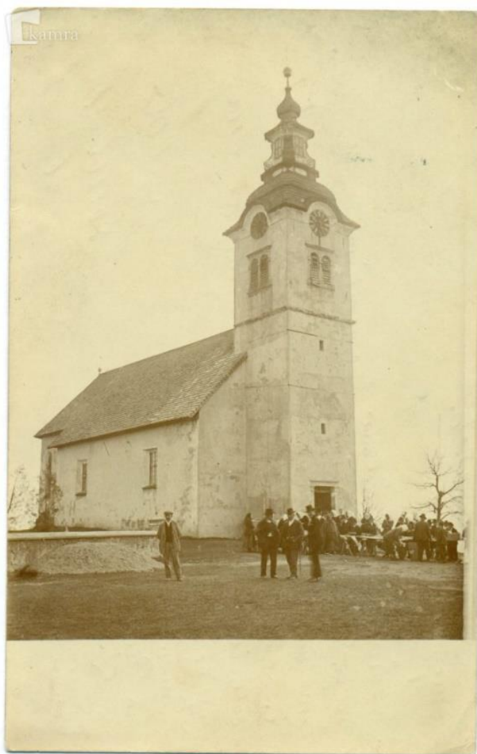
Slika 3: Razglednica, ki prikazuje semenj pred cerkvijo iz leta 1926