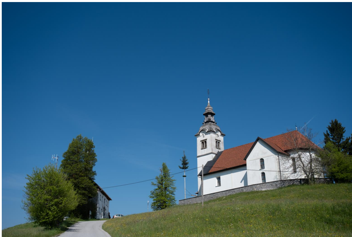
Slika 6: Današnja podoba

arhidiakon Janez Andrej pl. Flachenfeld pa v vizitacijskem poročilu iz leta 1704 navaja, da »je čisto na novo postavljena in še ne čisto dokončana.«