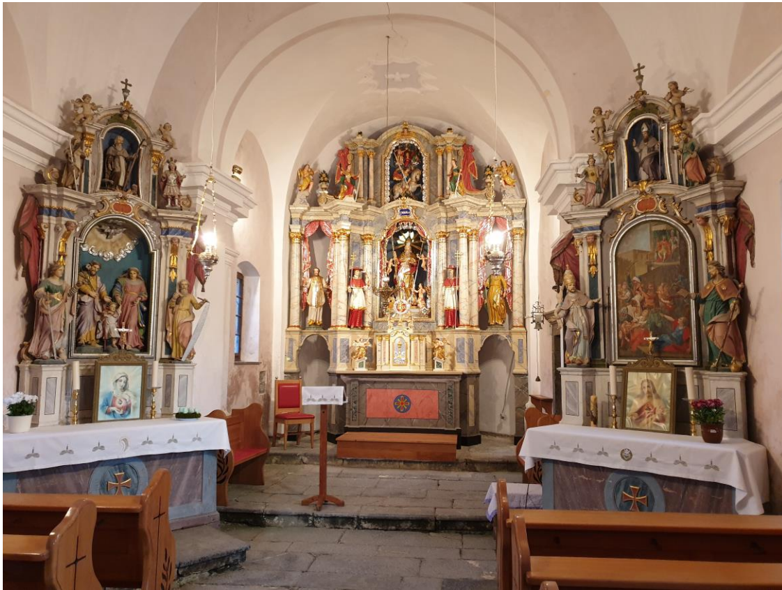
Slika 5: Notranja podoba cerkve svetega Nikolaja v Hlevnem Vrh

Kraj sta močno zaznamovali tudi obe svetovni vojni, predvsem druga. Po prvi svetovni vojni je po okoliških hribih potekala Rapalska meja, še vedno pa stojijo tudi utrdbe Rupnikove linije. Prav na Vrh Sv. Treh Kraljev bi morala stati največja jugoslovanska utrdba, a zaradi odlašanja gradnje in hitro bližajoče se druge svetovne vojne te niso nikoli zgradili po prvotnem načrtu. Leta 1941 so čez vrhovsko ozemlje zarisali mejo med Nemčijo in Italijo. Večji del območja je tako pripadal Italiji. Po letu 1942 se je večina prebivalstva uprla komunističnemu nasilju, zato pa so se po vojni, ko je komunistična partija prevzela oblast, izjemno surovo znesli nad prebivalci v okoliških krajih. 7