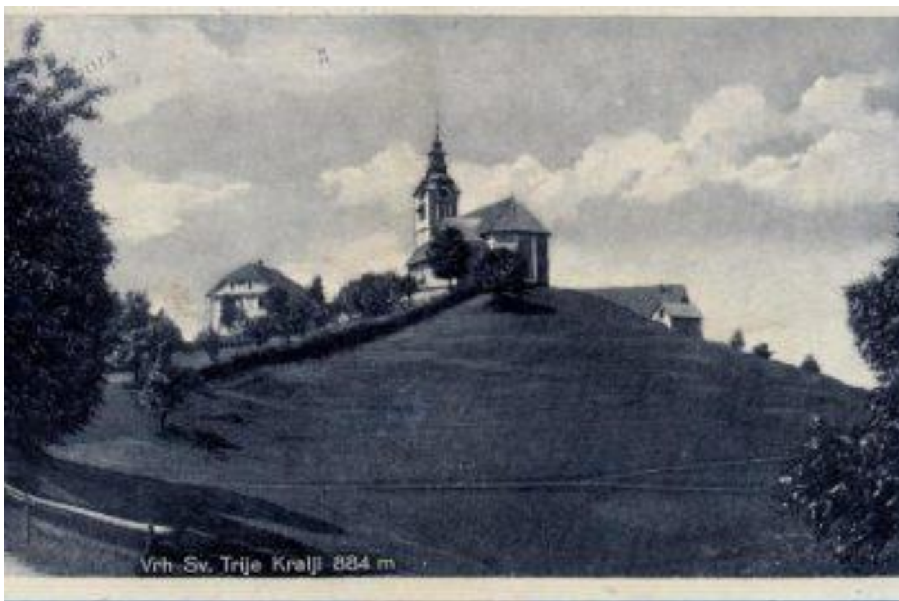
Slika 2: Pogled na cerkev na Vrhu Svetih Treh Kraljev iz leta 1920.

Cerkev Svetih treh kraljev je prvič omenjena v urbarju loškega gospostva iz leta 1529, ki je bil dodan urbarju iz leta 1501. Takrat je bila cerkev podružnica cerkve v Žireh, ki je bila ustanovljena istega leta. Nekoliko nižje od današnje cerkve hišno ime Stomazi (danes Stumarc) nakazuje na to, da je prej tam stala cerkev sv. Tomaža, ki naj bi bila zgrajena na ruševinah staroslovanskega poganskega templja. Sicer pa naj bi se Vrh prvotno imenoval Stanomerichrib po "prvem staroslovanskem naseljencu" z imenom Stanimir. Eden izmed poimenovanj Vrha Sv. Treh Kraljev je bil tudi Vrh nad Rovtami, ki se ga je uporabljalo med leti 1952 in 1992, ko so želele komunistične oblasti izbrisati vse, povezano s krščanstvom. 2