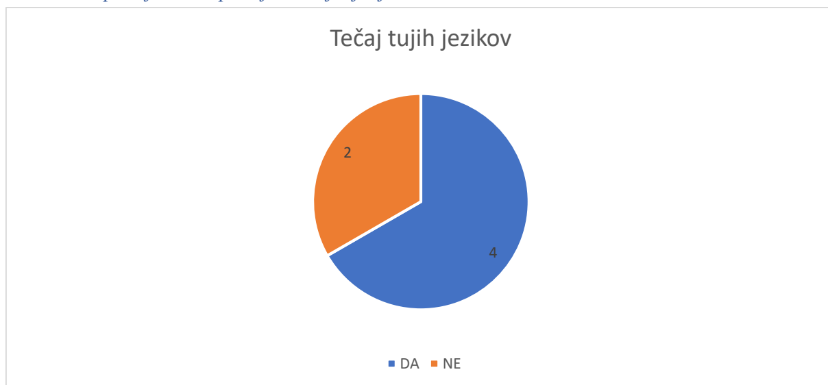
Slika 2 Ali opravljate/ste opravljali tečaj tujih jezikov?

Večina intervjuvancev (štirje od šestih) trdi, da opravljajo/so opravljali tečaje tujih jezikov. Večina jih je opravila/opravlja dodatni tečaj angleščine. Potreba po dodatnih tečajih je posledica trgovanja in gospodarskega sodelovanja s tujimi podjetji.