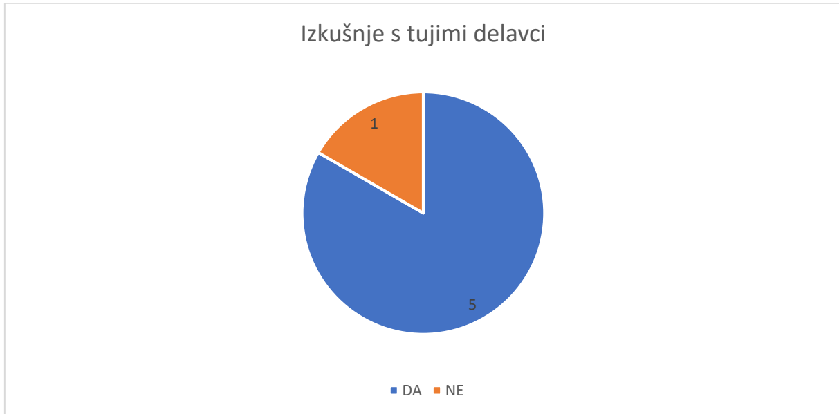
Slika 6 Ali imate izkušnje s tujimi delavci?