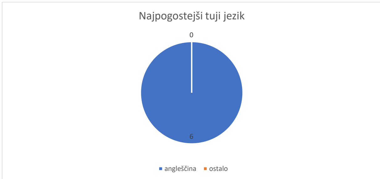
Slika 5 Kateri tuji jezik največkrat uporabljate v službi?

Vse osebe so odgovorile, da pri delu največkrat uporabljajo angleščino kot tuji jezik. Kot posledica globalizacije je srečevanje s tujimi jeziki postalo že vsakodnevno. Ker je angleščina mednarodni jezik, ki se največkrat uporablja za komuniciranje, so odgovori na to vprašanje pričakovani.