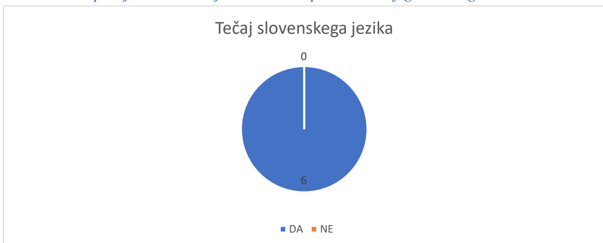
Slika 3 Ali ste opravljali kakšen tečaj slovenščine za pridobitev svojega delovnega mesta?

Vsi intervjuvanci trdijo, da niso nikoli opravljali dodatnega tečaja slovenščine za pridobitev svojega delovnega mesta.