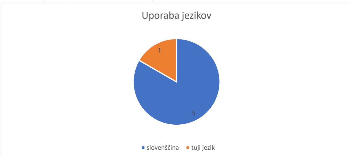
Slika 4 Ali uporabljate več slovenščine ali tujih jezikov?

Večina intervjuvancev (pet od šestih) trdi, da pri delu uporabljajo več slovenščine v primerjavi s tujimi jeziki. Le ena oseba je navedla, da uporablja več angleščine, saj je zaposlena v tujem podjetju. To se dogaja, saj posamezna tuja podjetja prihajajo v našo državo, ki zahtevajo poznavanje tujih jezikov, o čemer sva pisali pri globalizaciji v prvem delu naloge, kjer sva povzemali članek Globalizacija: Vpliv na zaposlovanje in EU . Iz ostalih odgovorov je razvidno, da slovenščina prevladuje kot glavni jezik v družbi, kar sva opredelili tudi v teoretičnem delu pri povzemanju članka Družbene zvrsti in besedilne vrste v slovenskem jeziku .