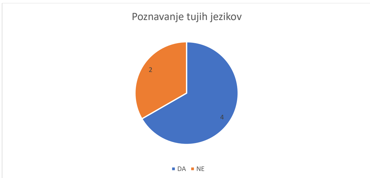
Slika 1 Ali je za vaš poklic potrebno poznavanje tujih jezikov?

Manjši del intervjuvancev (dva od šestih) trdita, da za njun poklic ni potrebno poznavanje tujih jezikov, je pa dobrodošlo, saj sta osebi zaposleni na slovenskih institucijah, kjer je v uporabi predvsem slovenščina.