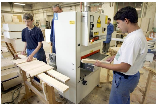
Slika 4: Delo v delavnicah