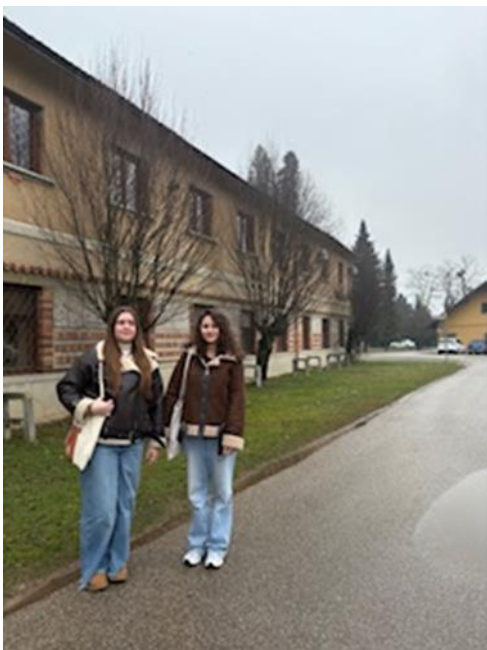
Slika 3: Obisk prevzgojnega doma