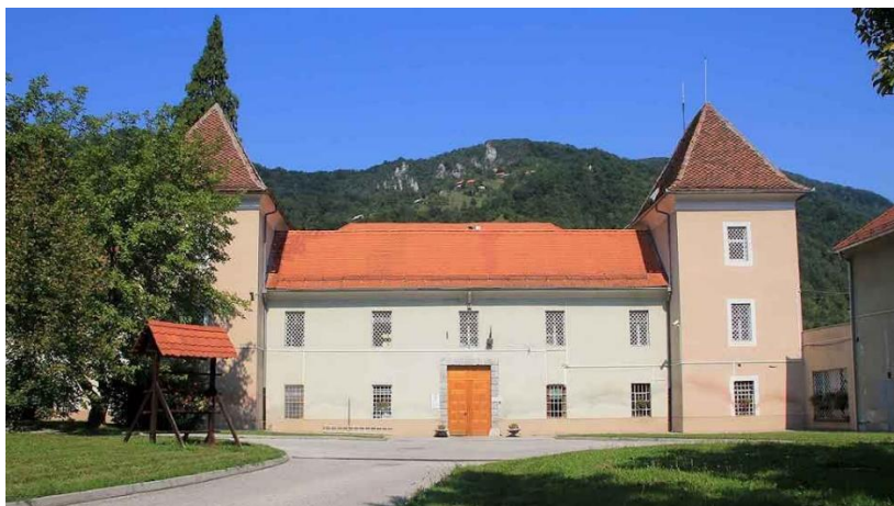
Slika 2: Bivše samostansko poslopje