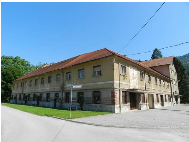
Slika 1: Zunanost Prevzgojnega doma Radeče

Hipoteza 5: Poinstitucionalna obravnava mladostnikov je v Sloveniji pomanjkljiva in jim ne nudi nadaljnjega strokovnega spremljanja.