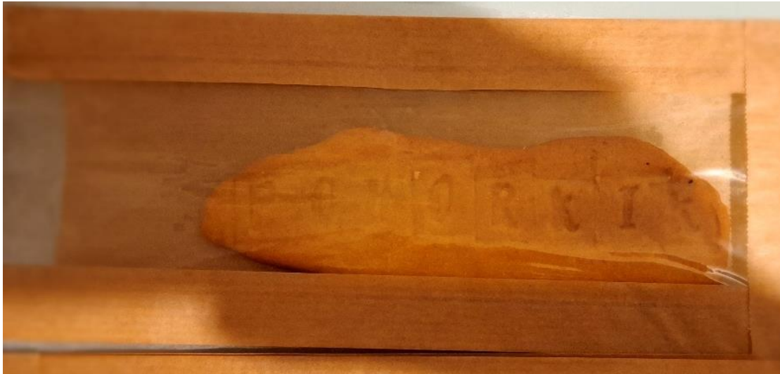
Slika 14: Pohorkik

Večjo količino keksov bi lahko hranili v večjih plastičnih posodah, nato pa bi jih prepakirali v manjšo embalažo.