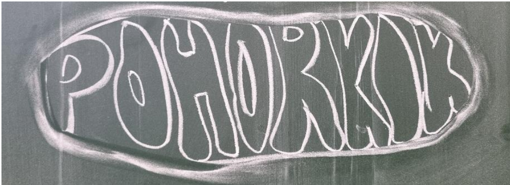
Slika 10: Ideja za logotip

Pri oblikovanju logotipa sem izhajal iz oblike keksa in vanjo vstavil ime Pohorkik. Ob valjanju testa in oblikovanju keksa z modelčkom smo nato z učenci odtisnili napis s črkami.