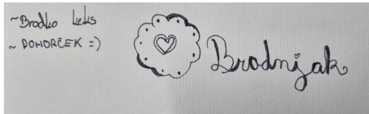
Slika 2: Ideja za obliko in ime

Na začetku smo z učenci veliko razpravljali o ideji in preučili različne možnosti. Med številnimi predlogi smo izbrali prav koncept "Pohorkik", ki nas je s svojo izvirnostjo najbolj prepričal. Ko smo imeli osnovno idejo za ime, smo začeli razmišljati o oblikah, ki bi lahko hkrati predstavljale Pohorje in bile uporabne za izdelavo piškotov. Na koncu smo oblikovali koncept, ki je bil hkrati praktičen in vizualno privlačen, saj v obliki združuje lokalno naravno dediščino in sodoben pristop k oblikovanju hrane.