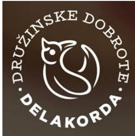
Slika 2: Logotip Keksarne Delakorda