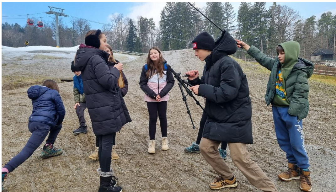
Slika 15: Snemanje video spota

Scenarij za video sem napisal sam. Video sem posnel in zmontiral z lastno opremo.