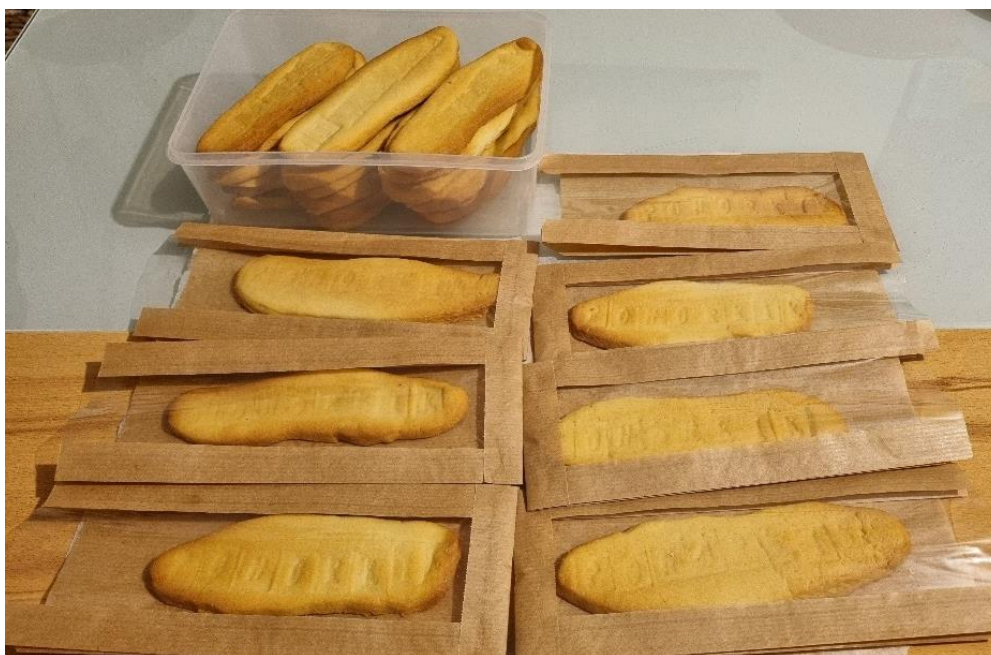
Slika 13: Pečeni Pohorkik in embalaža

Ugotovil sem, da bi moral s 3D printerjem še natisniti reliefni napis Pohorkik, ker bi ga tako hitreje odtisnili v vsak keks. Razmišljali smo tudi o hrambi keksov in embalaži.