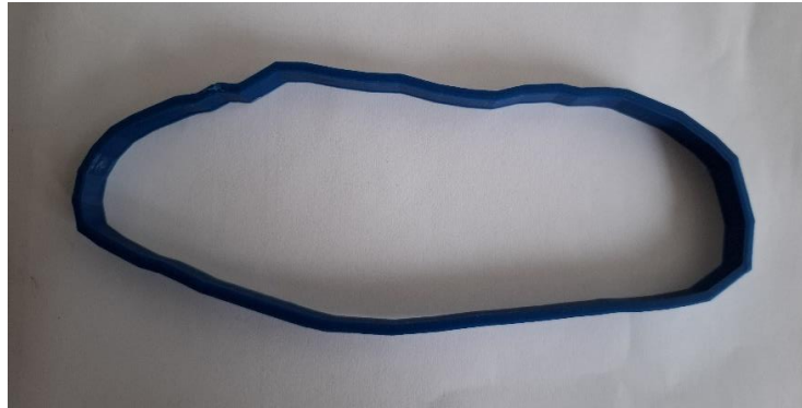
Slika 7: Modelček Pohorkik