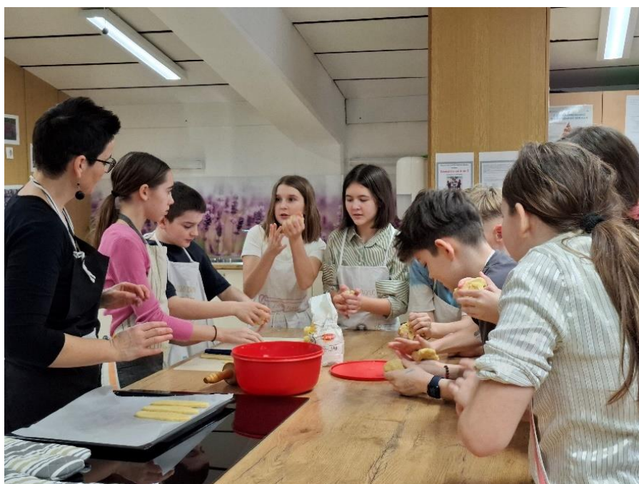
Slika 9: Peka keksov

Z učenci smo se lotili peke keksov Pohorkik. Pregnetli smo testo, ga razvaljali in odtisnili modelček. Morali smo biti pozorni na enakomerno razvaljano debelino testa.