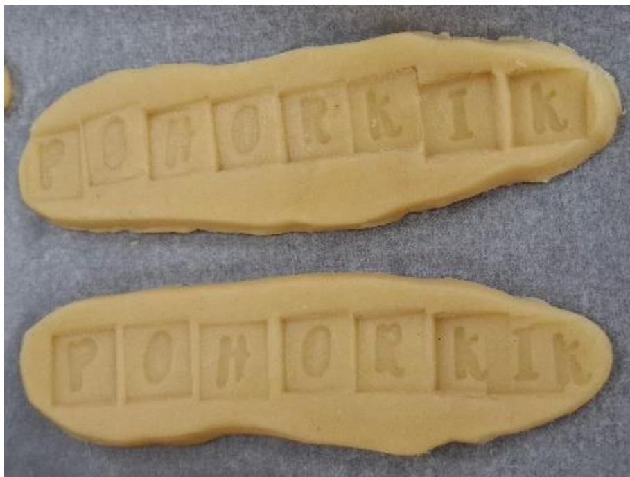
Slika 12: Odtis Pohorkik v testu keksa (lastni vir)

Preden je bil keks pečen se je napis dobro videl. Na pečenem keksu pa se je videl malo slabše.