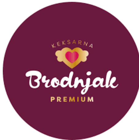
Slika 1: Logotip Keksarne Brodnjak (spletni vir)

ugled med prebivalci kraja in širše. V preteklih desetletjih je keksarna razvila svojo ponudbo in ohranila tradicijo, obenem pa prilagodila izdelke sodobnim okusom. Danes je Keksarna Brodnjak ena izmed najbolj prepoznavnih in priljubljenih slaščičarn v Mariboru, znana po svojih domačih keksih, tortah in drugih sladica. Priporoča jo tudi spletna stran Visit Maribor.