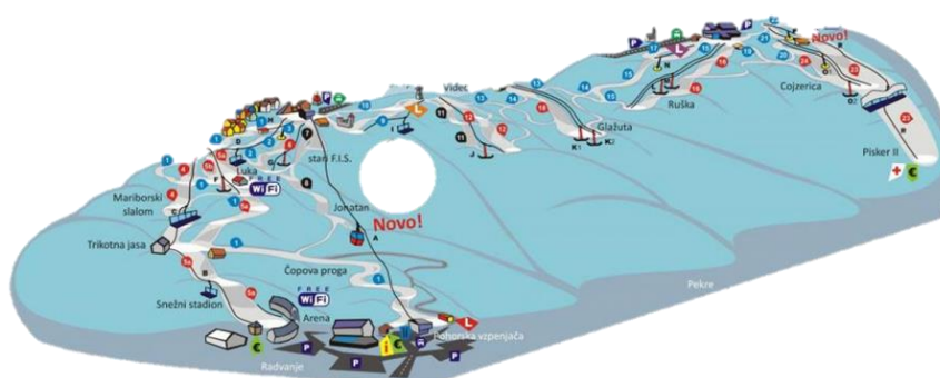
Slika 4: Pobočje Pohorja

Za izdelavo smo potrebovali obliko pobočja. Na fotografiji smo pri oblikovanju izbrali izrez ozadja, da smo imeli na fotografiji to, kar smo želeli. Dano obliko smo prevlekli s črnim alkoholnim flomastrom in dobili izrisano obliko.