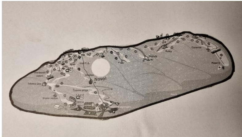
Slika 5: Pobočje Pohorja z izrisano obliko

Pobočje nas je spominjalo na čevalj, zato asociacija na Pohorkik.