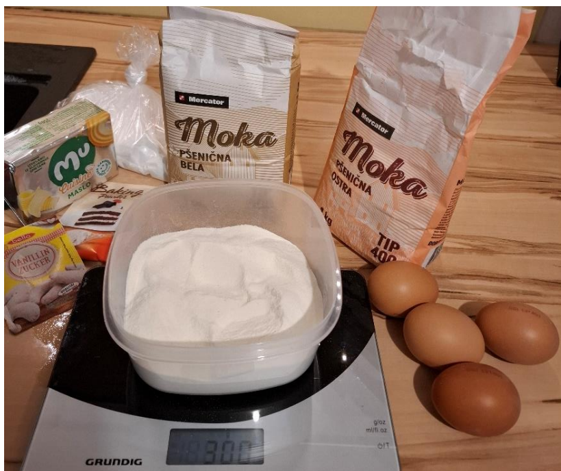
Slika 8: Sestavine za peko (lastni vir)

Z učenci smo se lotili peke keksov Pohorkik. Pregnetli smo testo, ga razvaljali in odtisnili modelček. Morali smo biti pozorni na enakomerno razvaljano debelino testa.