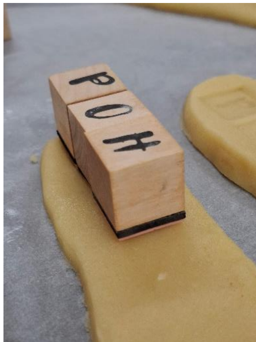
Slika 11: Odtiskovanje imena v maso za kekse (lastni vir)