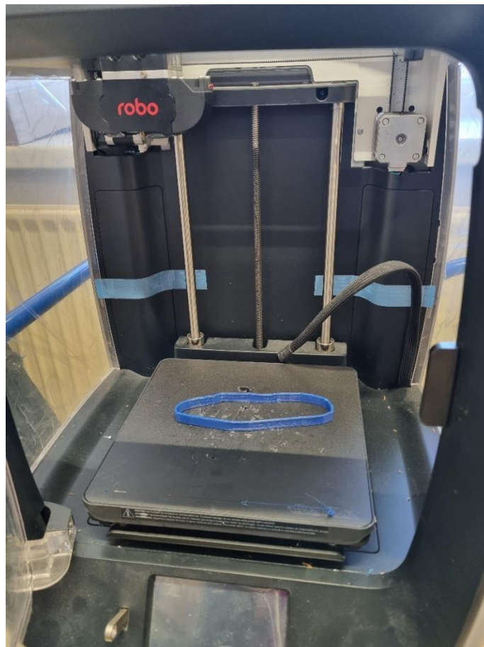
Slika 6: 3D tiskanje oblike modelčka

Obliko pobočja smo izrisali v računalniškem programu Sketch Up za 3D tiskalnik Robo R2 in ga natisnili iz plastične mase za 3D tiskalnik v programu Cura for Robo.