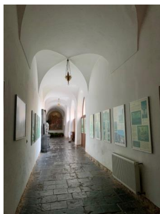
Slika 4: Frančiškanski samostan