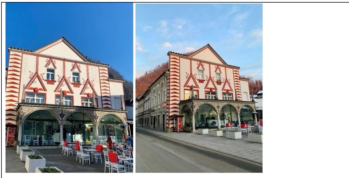
Slika 5: Glavni trg in stransko pročelje hiše na Maistrovi 2