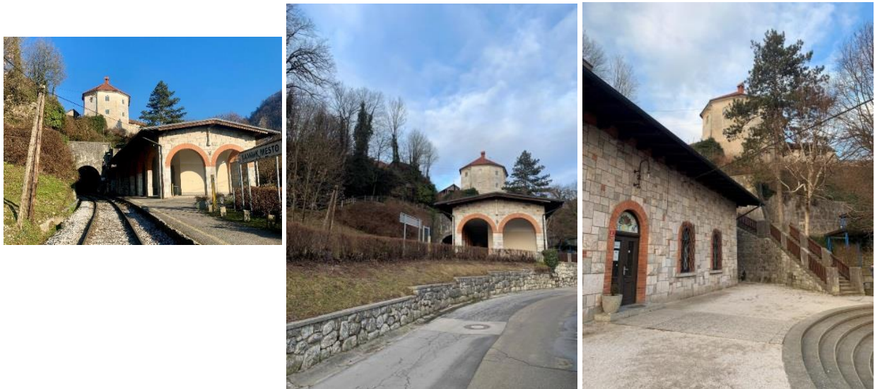
Slika 3: Železniška postaja Kamnik mesto