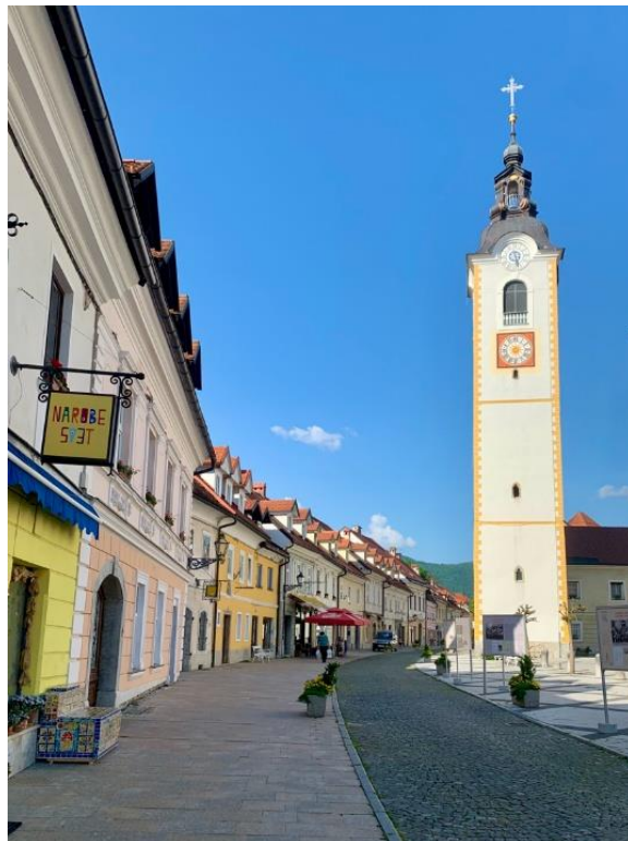
Slika 1: Kamnik, pogled na Šutno

Glede na najino opazovanje stavb v Kamniku, se nama zdijo Plečnikove stavbe dobro ohranjene. Most čez reko Nevljico pripada občini, v Frančiškanskem samostanu pa prebivajo nune. Tudi lega objektov, kjer stojijo je kar primerna saj so objekti na mestih, ki so vidna očem.