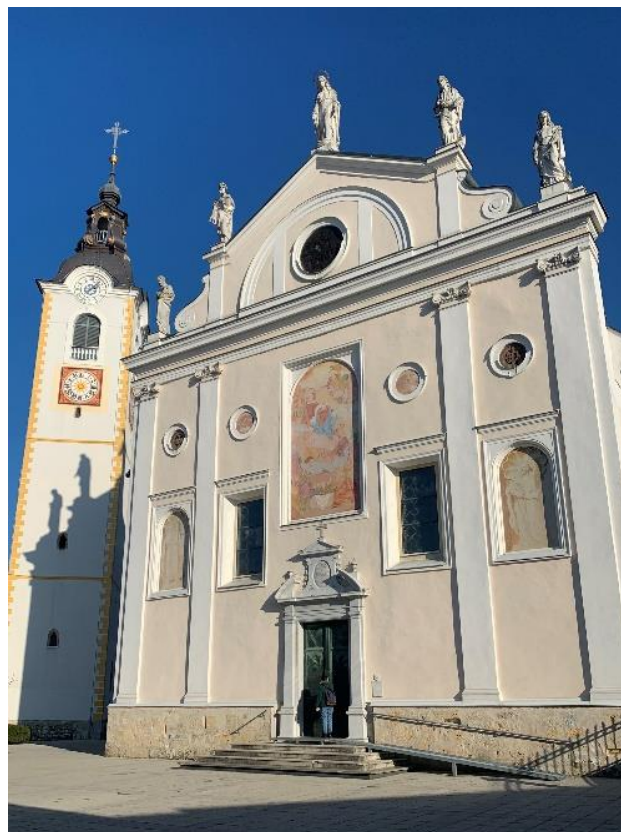
Slika 7: Cerkev Marijinega spočetja