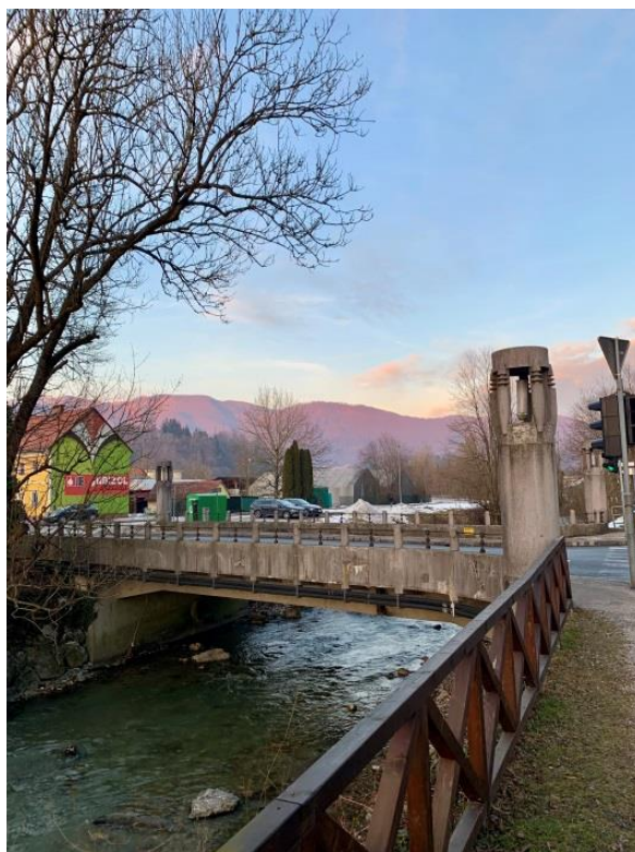
Slika 6: Most čez reko Nevljico