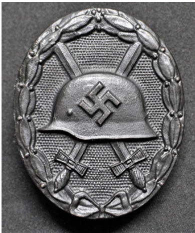
Slika 6: Značka Black Wound (dostopno na:

V letu 1914, se je Hitler avgusta prostovoljno prijavil v Bavarsko vojsko. Bavarske oblasti so 10 let kasneje izdale poročilo, v katerem je pisalo, da je bilo dovoljenje Hitlerju, da služi, skoraj zagotovo administrativna napaka, saj bi ga kot avstrijskega državljana morali vrniti v Avstrijo. Napotili so ga v bavarski rezervni pehotni polk 11 16, kjer je služil kot kurir in je na fronte prenašal sporočila poveljnikov. Prisoten je bil v prvi bitki pri Ypresu, bitki pri Arrasu in bitki pri Sommi, v kateri je bil tudi ranjen. Za hrabrost je bill leta 1914 odlikovan in prejel železni križec drugega razreda. Po naročilu poročnika Huga Gutmanna, Hitlerjeva judovskega nadrejenega, je 4. avgusta 1918 prejel še železni križec prvega razreda. 18. maja leta 1918 pa je prejel značko Black Wound 12, 13