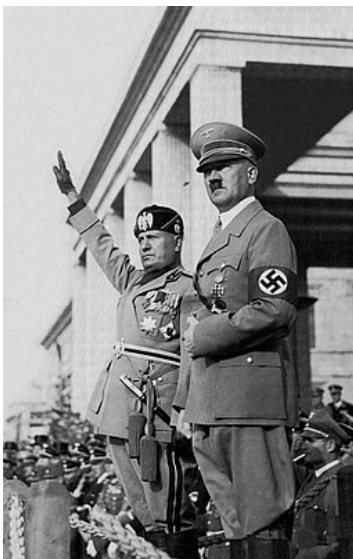
Slika 8: Benito Mussolini in Adolf Hitler (dostopno na:

Avgusta 1936 je Hitler kot odgovor na naraščajočo gospodarsko krizo, ki so jo povzročila njegova oborožitvena prizadevanja, Göringu ukazal izvedbo štiriletnega načrta za pripravo Nemčije na vojno v naslednjih štirih letih. 1. novembra je Mussolini razglasil "os" med Nemčijo in Italijo. Hitler je ukazal je, da se priprave na vojno na vzhodu začnejo že leta 1938 in najkasneje leta 1943. Od začetka leta 1938 dalje je Hitler izvajal zunanjo politiko, ki je bila končno usmerjena v vojno. 65