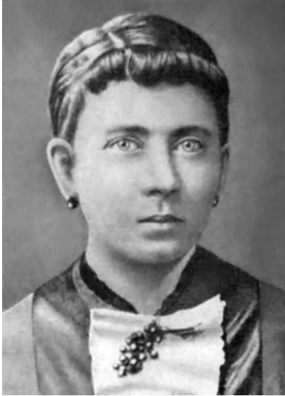
Slika 2: Hitlerjeva mati – Klara Hitler