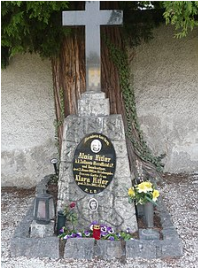
Slika 4: Grob Hitlerjevih staršev (dostopno na: https://en.wikipedia.org/wiki/Klara_Hitler , 23. 1. 2023)

bi ponovno poskusil narediti sprejemni izpit za vpis na Akademijo umetnosti. Njegova mati je umrla za rakom dojke pri 47-ih letih. 6