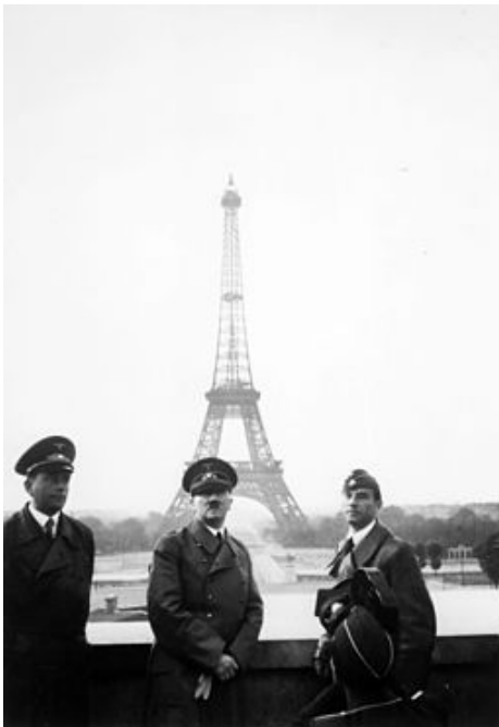
Slika 9: Hitler v Parizu (dostopno na:

9. aprila so nemške sile vdrle na Dansko in Norveško. Istega dne je Hitler razglasil rojstvo Velikega germanskega rajha, njegove vizije združenega imperija germanskih narodov v Evropi, v katerem so bili Nizozemci, Flamci in Skandinavci združeni v »rasno čisto« državo pod nemškim vodstvom. Maja 1940 je Nemčija napadla Francijo in osvojila Luksemburg, Nizozemsko in Belgijo. Te zmage so spodbudile Mussolinija, da je Italija 10. junija združila sile s Hitlerjem. Francija in Nemčija sta 22. junija podpisali premirje. 70