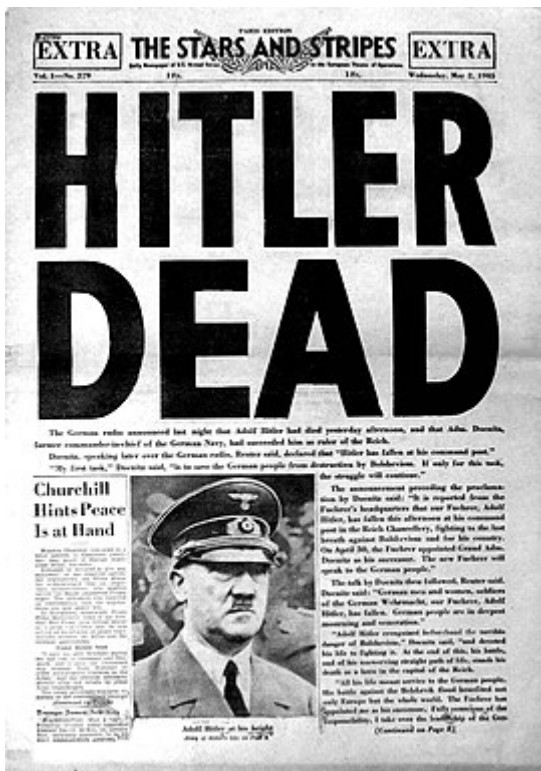
Slika 11: Prva stran časopisa oboroženih sil ZDA, ki naznanja Hitlerjevo smrt

Ni dokazov, da so Sovjeti našli dejanske ostanke Hitlerja ali Eve Braun, ki bi jih lahko identificirali kot njihove ostanke. Čeprav se je novica o Hitlerjevi smrti hitro razširila, je bil mrliški list izdan šele leta 1956, po dolgotrajni preiskavi zbiranja pričevanj 42 prič. 86