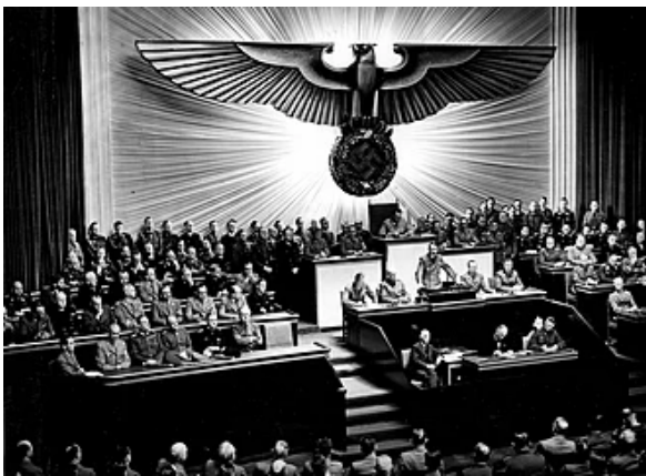
Slika 10: Napoved vojne ZDA (dostopno na:

7. decembra 1941 je Japonska napadla ameriško floto s sedežem v Pearl Harborju na Havajih. Štiri dni pozneje je Hitler napovedal vojno ZDA. 76