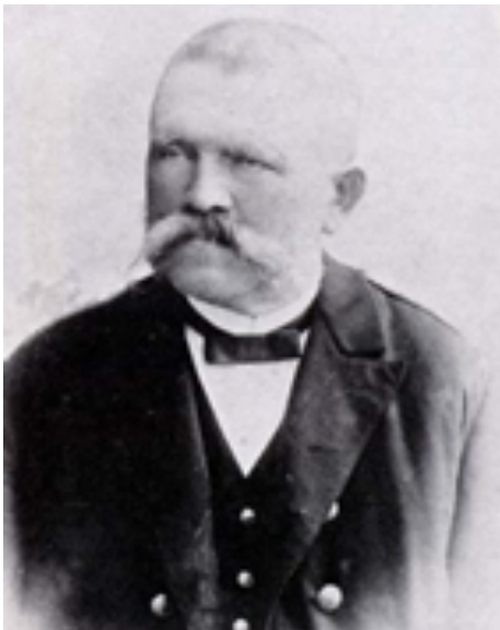
Slika 3: Hitlerjev oče – Alois Hitler