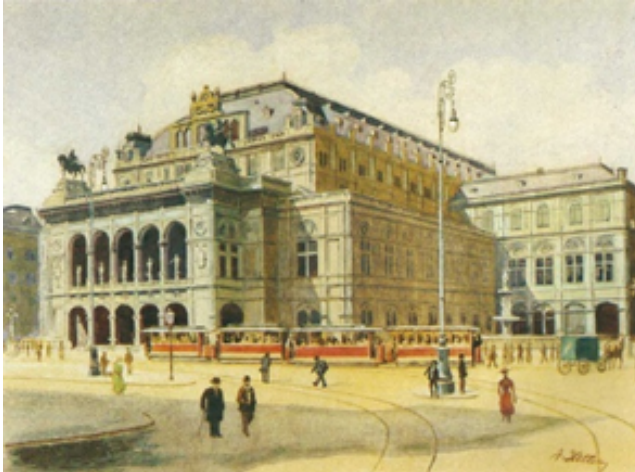
Slika 5: Dunajska državna operna hiša, 1912 – naslikal Hitler (dostopno na:

https://en.wikipedia.org/wiki/Paintings_by_Adolf_Hitler , 23. 1. 2023)