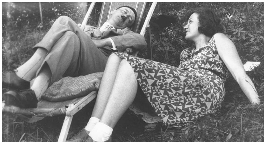
Slika 13: Geli Raubal in Adolf Hitler (dostopno na:

Prevod: »Ko se lomijo srca človeška in obupajo človeške duše, tedaj iz somraka preteklosti gledajo nanje veliki zmagovalci stiske in skrbi, sramote in bede, duhovnega suženjstva in fizične prisile in iztegujejo svoje večne roke malodušnim smrtnikom! Gorje ljudem, ki jih je sram prijeti!«