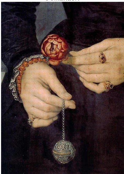
Slika 3: Pomander.

Fashion History Timeline. (2018, 23.8.). Pomander . Pridobljeno 6.4. 2023. Dostopno na: https://fashionhistory.fitnyc.edu/pomander/