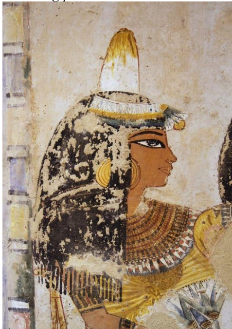
Slika 1: Egipčanski dišavni stožec.

Archaeology Newsroom. (2020, April 30). Ancient Egyptian unguent cones .