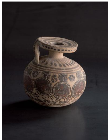
Slika 2: Korintski aribal.

Parfumeur, F. (2019, 15.11.). Divine scents in ancient Greece . Paris Perfume Museum. Pridobljeno 6.4. 2023. Dostopno na: https://musee-parfum-paris.fragonard.com/en/actualite/divine-scents-in-ancient-greece/