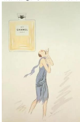
Slika 7: Prva reklama za Chanel no. 5 (1921).

Chanel. (n.d.). 1920s. CHANEL. Pridobljeno 6.4. 2023. Dostopno na: https://www.chanel.com/us/about-chanel/the-history/1920/