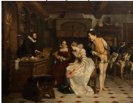
Slika 4: Rene le Florentin prodaja strup Jeanne d'Albret.

Jeanne III of Navarre Buying Poisoned Gloves from Catherine de Medici's Parfumeur, René. (n.d.). [ Jeanne III of Navarre Buying Poisoned Gloves from Catherine de Medici's Parfumeur, René by Pierre-Charles Comte. Sign. "P. C. COMTE 1858". A painting of this title by Comte was exhibited at the Salon of Paris in 1852 (#280)] Musee d'Orsay, Paris, France.