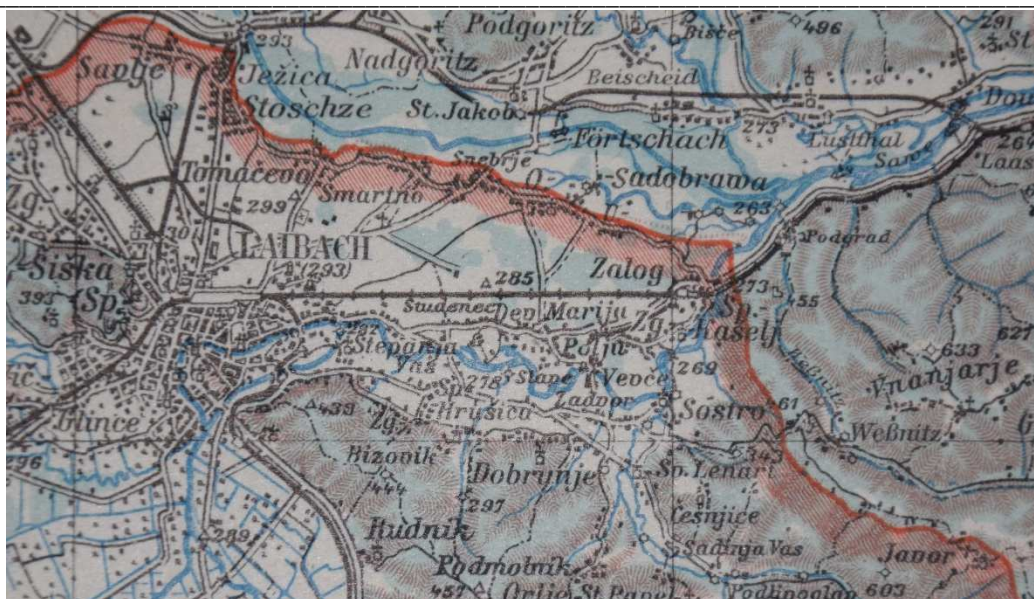
Slika 5: Nemški zemljevid iz leta 1944, ki prikazuje območje Sostrega.