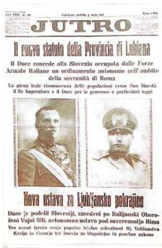
Slika 4: Naslovnica časnika Jutro ob priključitvi Ljubljanske pokrajine h Kraljevini Jugoslaviji 3. maja 1941 (Drnovšek M. et al., 1995).