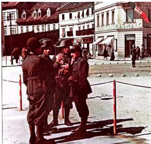
Slika 3: Ljubljana med italijansko zasedbo. Današnji Prešernov trg (Drnovšek M. et al., 1995).

kmalu pokazala za neuspešno, ker so podcenili vrednost slovenske kulture in zavesti. Polom je priznal tudi Mussolini, ki je poleti 1942 v Gorici dejal: »Vprašajmo se, če je bila naša politika modra. Lahko samo rečemo, da je bila naivna.« (Drnovšek M. et al., 1995, str. 15).