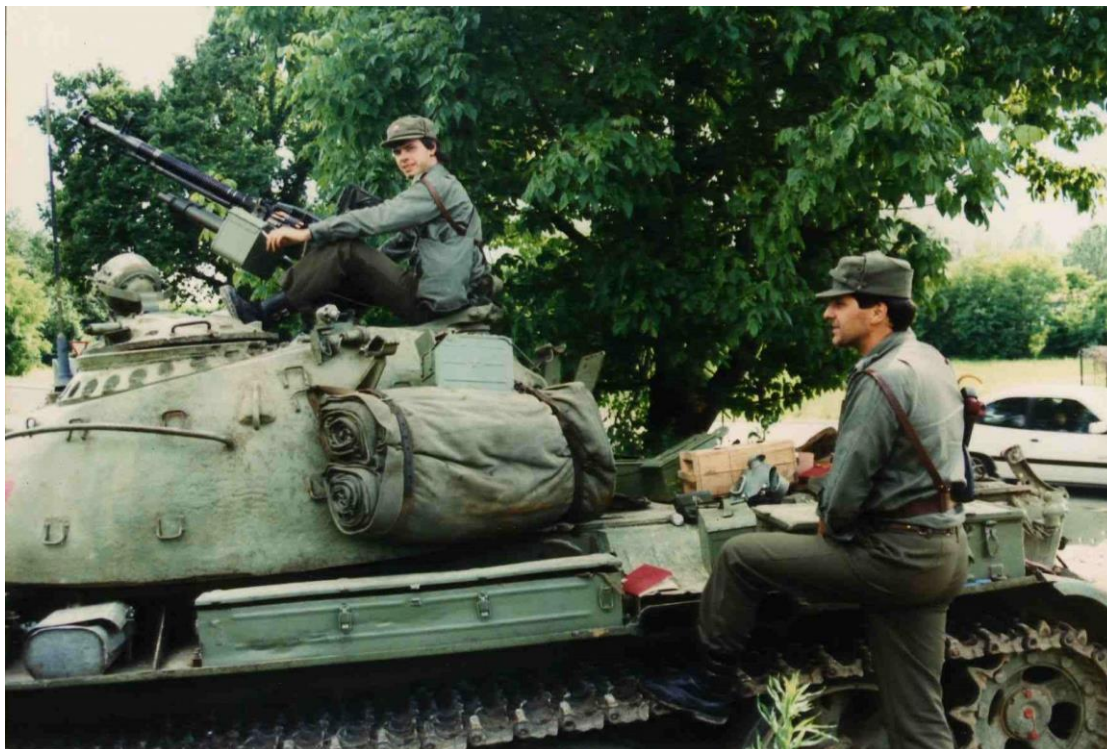
Slika 4: Tank JLA, ki so ga zasedli slovenski teritorialci.