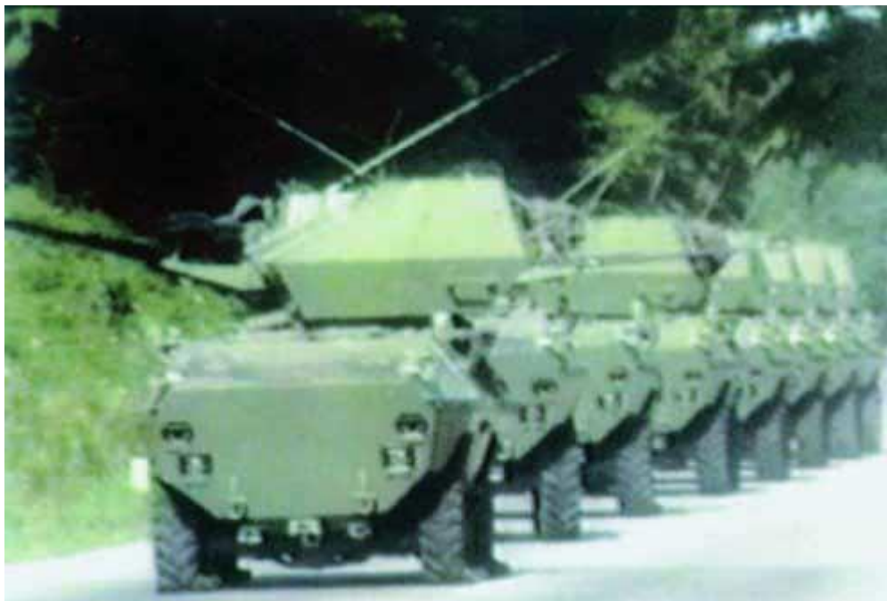
Slika 3: Oklepniki JLA.