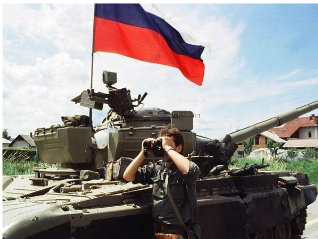
Slika 1: Slovenski teritorialci so v bojih zaplenili veliko tankov in jih vključili v svoje enote.