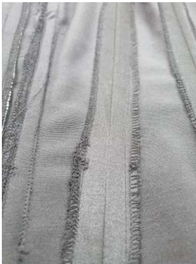
Slika 22: Kanali za kosti

Zadnji krojni del sem obrnil, da se je malo utrdil. Nanj sem na koncu s pomočjo orodja vstavil kovinske rinčice.