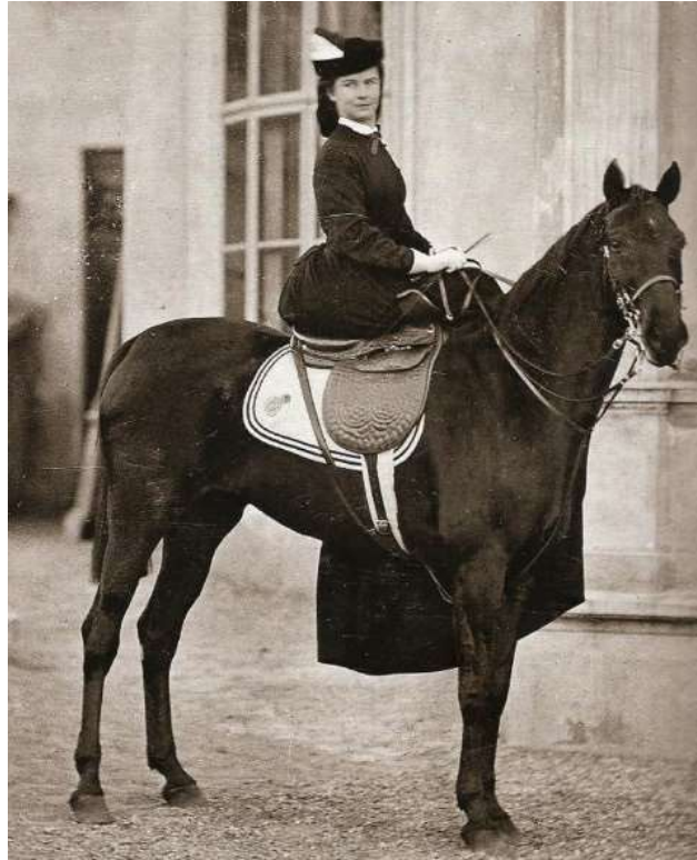
Slika 4: Elizabeta na konju.

Bila je tudi velika ljubiteljica živali. Že od nekdanj je bila drzna jahalka ter veljala za eno najboljših svojega časa. Najraje je imela velike pse, vendar je na fotografijah vidna tudi z manjšimi pasmami. Fotografij na katerih pozira z živalmi je skoraj več kot pa tistih z njeno družino.