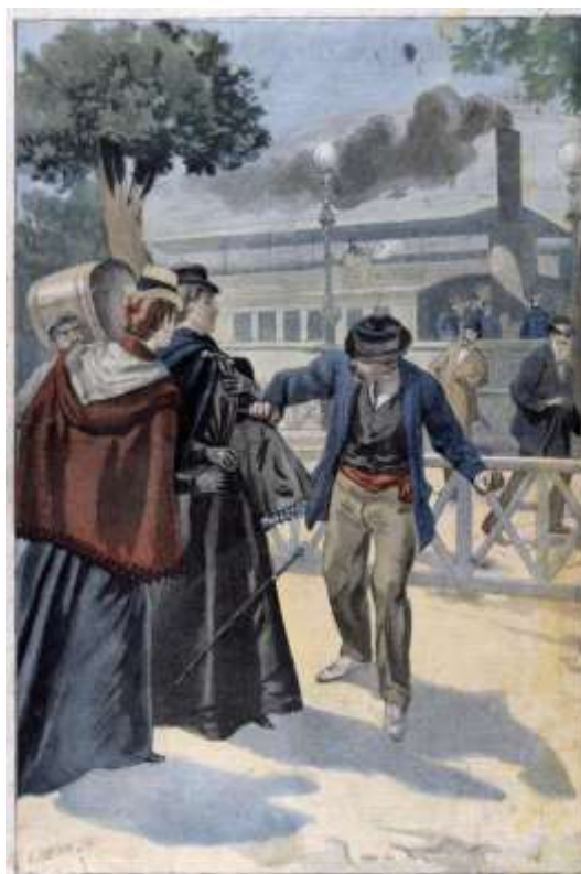
Slika 10: Atentat na cesarico Sissi.