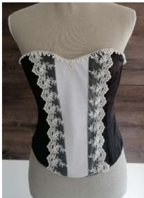
Slika 27: Končan stežnik od spredaj

Končan stežnik sem pomeril na lutki in končen izgled je izgledal tako: