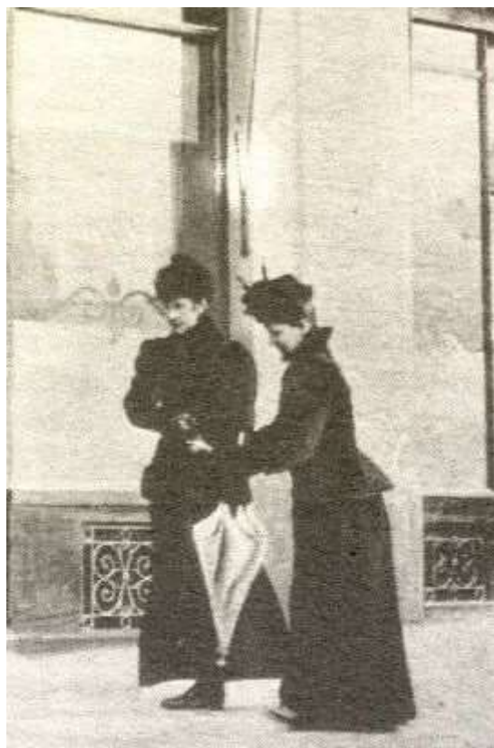
Slika 9: Zadnja fotografija cesarice, dan pred atentatom.