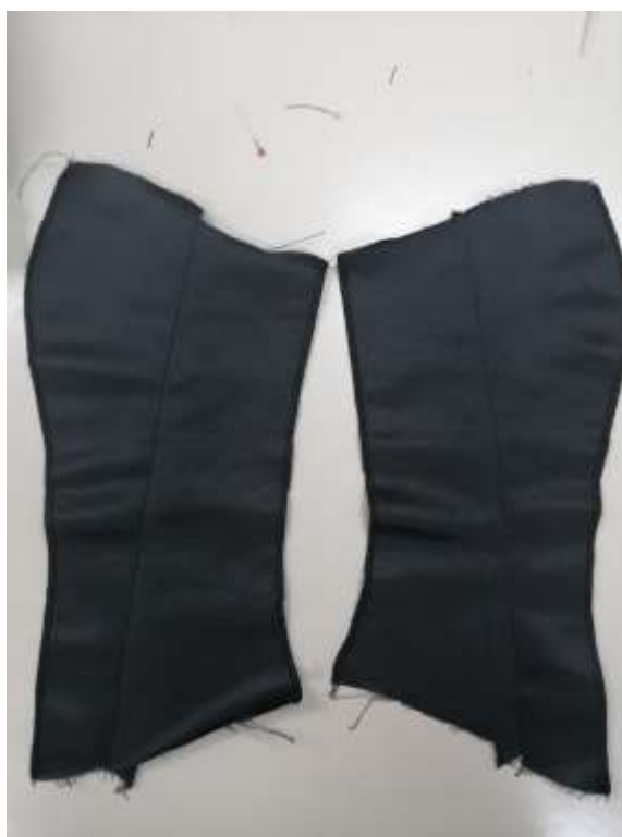
Slika 21: Zašita stranska dela