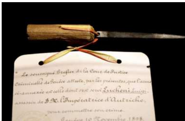
Slika 11: Pila, ki se je pred 123 leti zasadila v Sissijino srce.