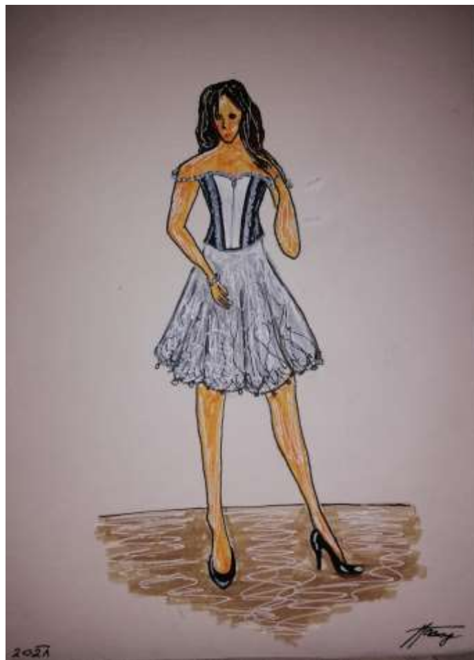
Slika 17: Skica izdelka.

Najprej sem si na format A4 narisal nekaj skic kakšni stezniki bi prišli v poštev za moj izdelek. Nato sem z mentorico izmed teh izbral eno najboljšo, kateri mi je služil kot izhodišče za izdelek.