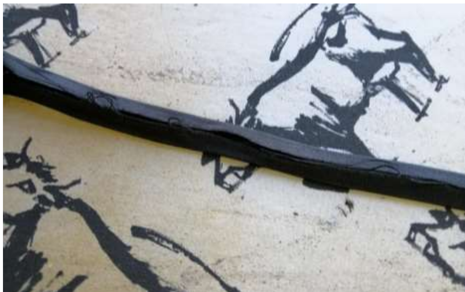
Slika 23: Zalikan trak