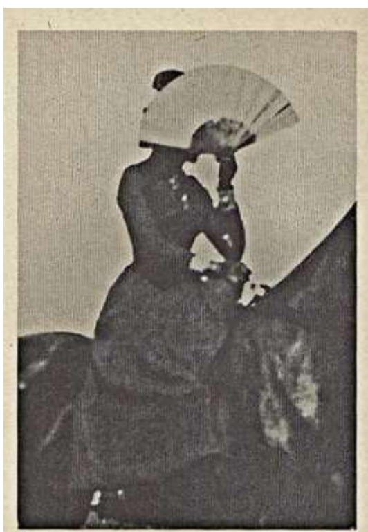
Slika 8: Prva »paparaci« fotografija ( Elizabeta skriva svoj obraz).