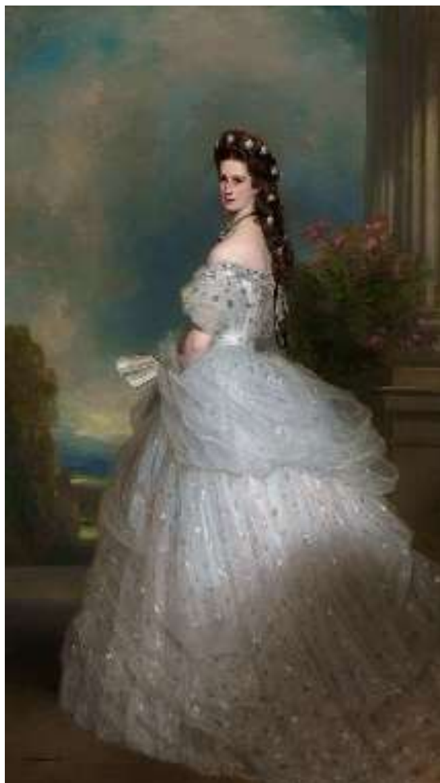
Slika 15: Portret Elizabete v plesni obleki z zvezdicami (ravno ta upodobitev cesarice je najbolj znana).