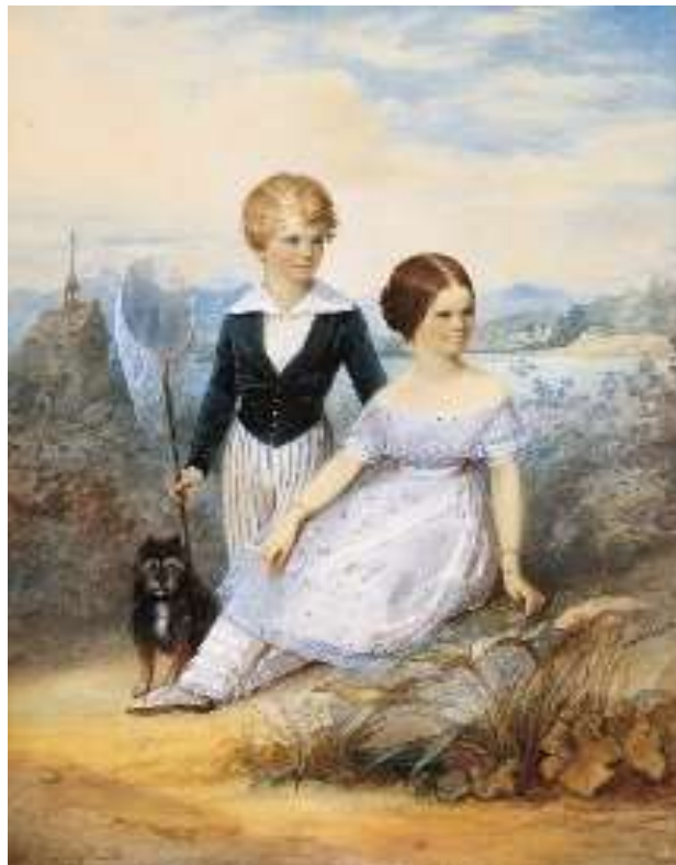
Slika 1: Mlada Elizabeta z bratom.

Sissi je bila zelo radoživa deklica. Varuške, kasneje tudi učitelji, so tekali stalno za njo in jo lovili. Ona pa se je s svojo otroško brezskrbnostjo skrivala v naravi, večkrat je tudi z očetom šla na lov ali pa se z njim učila jahanja. Ta Sissijina brezskrbnost pa je trajala še dolgo. V odrasčajoči dobi je začela gledati za mladeniči, zaljubljala se je in svoje občutke zapisovala v dnevnik v obliki poezij. Najprej so bile te poezije nekoliko otročje in večinoma ljubezenske, nato pa vedno bolj resne in žalostne. [1]