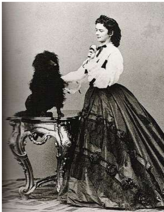
Slika 5: Sissi je svoje ljubljenske skrbno negovala.