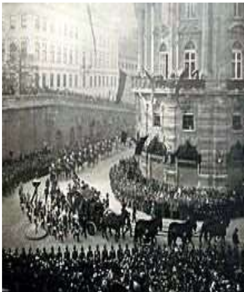
Slika 12: Pogreb cesarice Elizabete.