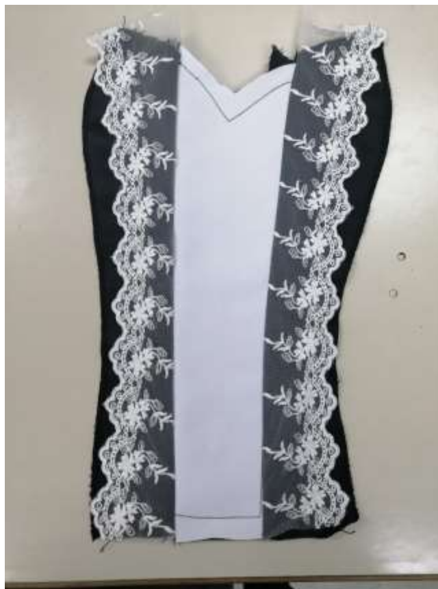
Slika 20: Zašit sprednji del steznika s čipko