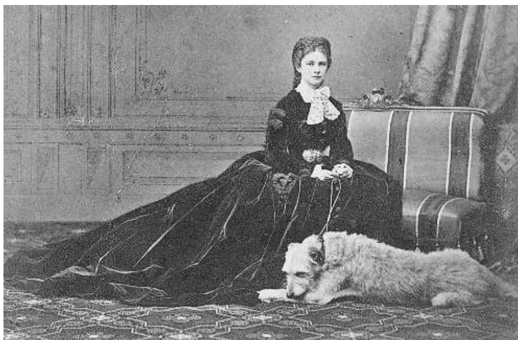
Slika 6: Cesarica pozira s pesom.