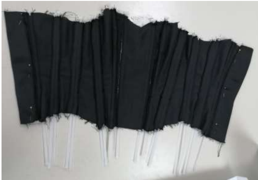
Slika 25: Vstavljene kosti v kanale

Trak sem zašil tudi na spodnji rob. Oba traka sem nato obrnil in ročno zašil s čemer sem zaprl kanale tudi s spodnje strani.