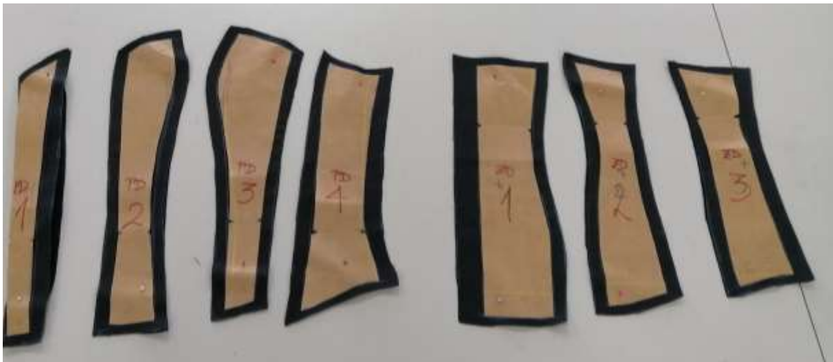
Slika 19: Izrezani krojni deli

Krojne dele sem nato opletel s strojem za opletanje.