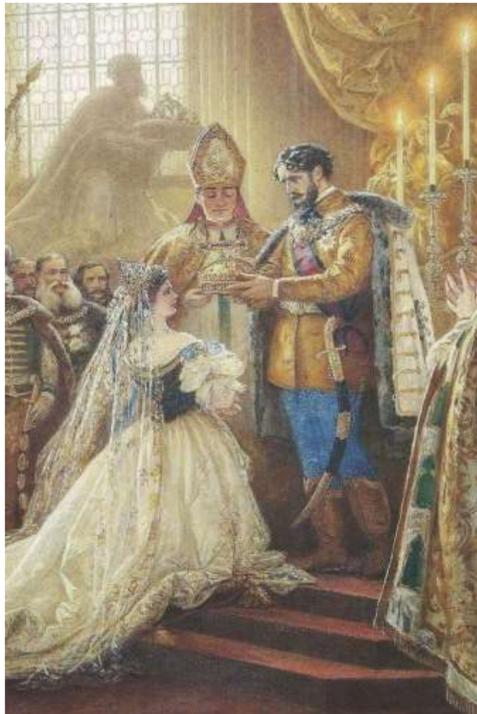
Slika 3: Kronanje.

8. junija 1867 sta bila Franc Jožef in Elizabeta v Budimpešti okronana za kralja in kraljico Madžarske. Avstrijska monarhija je tako postala dualistična Avstro-Ogrska.