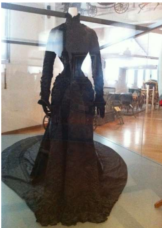
Slika 7: Sissijina obleka z izjemno ozkim pasom.