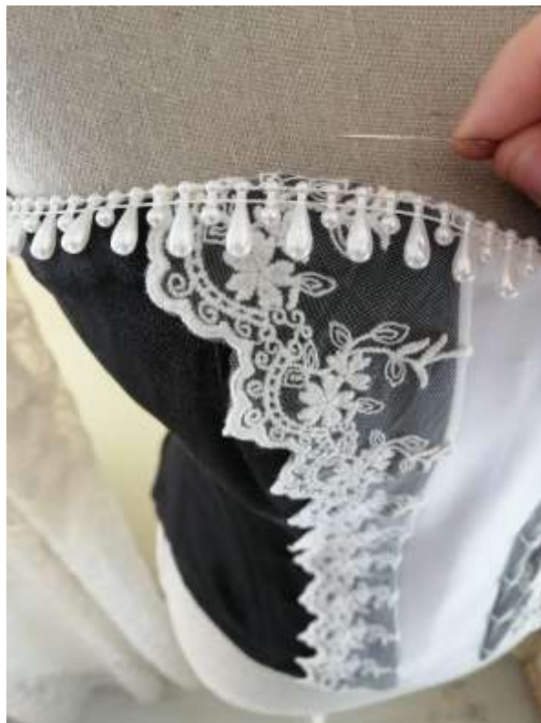
Slika 26: Šivanje nakita

Steznik sem okrasil tudi z umetnimi biseri na sprednjem delu.