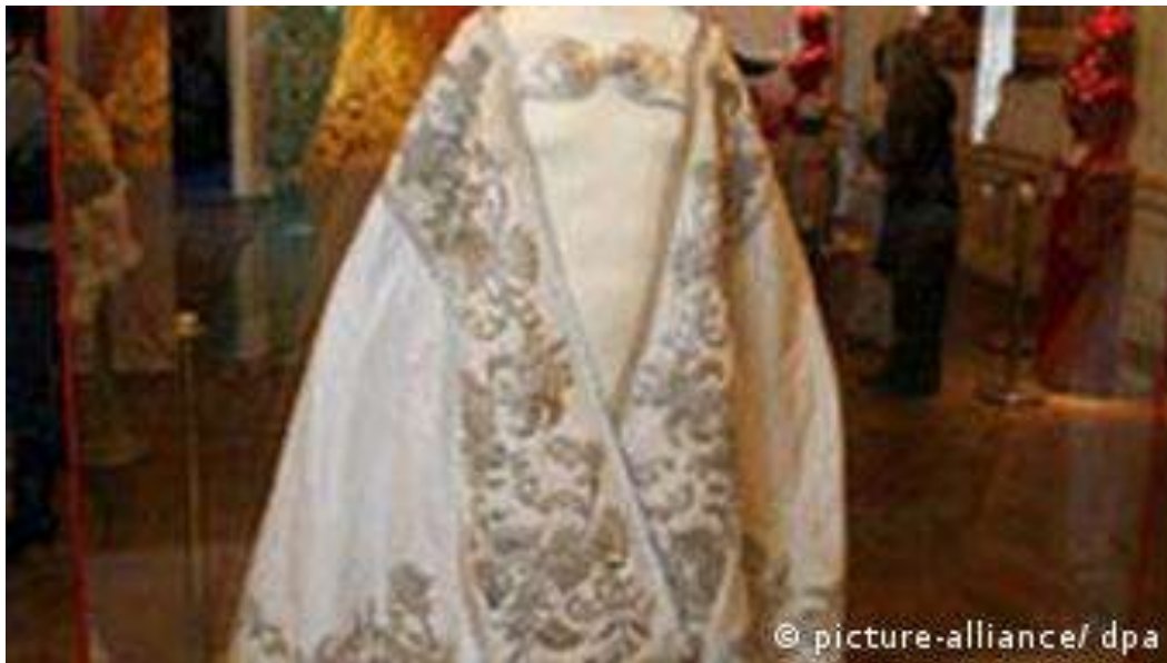
Slika 16: Mašni plašč na katerem je zašito vezenje iz poročne obleke.

Žal o tej obleki ne vemo veliko, saj se v večini ni ohranila. Najbolje je vidna na upodobitvi njene poroke iz Stadtchronik Wiens. Po običaju so jo darovali cerkvi, ta pa jo je predelala v mašni plašč. Poročno vlečko pa je Sissijina hčerka Maria Valeria shranila in se je po njeni zaslugi tudi ohranila. Našli so jo v zapuščini njenih potomcev in je sedaj na voljo za ogled v Dunajskem muzeju umetnostne zgodovine. [2]