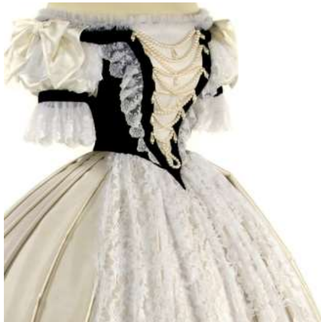
Slika 13: Zgornji del obleke.

Kar zadeva Madžare, je bilo kronanje Franca Jožefa in Elizabete za kralja in kraljico Madžarske, leta 1867 najpomembnejši dogodek do takrat. Veliko fotografij je posnel uradni fotograf Emil Rabending. Slaba novica pa je, da so fotografije črno-bele, zato se znanstveniki zdaj pripravajo o barvi životca. Obleko iz žameta in bele svile je oblikoval pariški modni oblikovalec Charles Frederick Worth, eden izmed Sissijnih najljubših oblikovalcev (in večine takratnih evropskih kraljevih družin). Oblikovanje je temeljilo na tradicionalni madžarski slavnostni obleki, ki so jo na madžarskem dvoru nosili že od petnajstega stoletja. Čeprav obstajajo fotografije te obleke, so ji takratni slikarji dodali svoj pridih. [2]