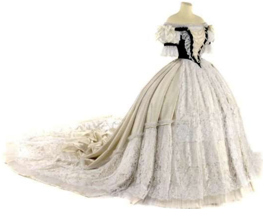
Slika 14: Replika obleke.