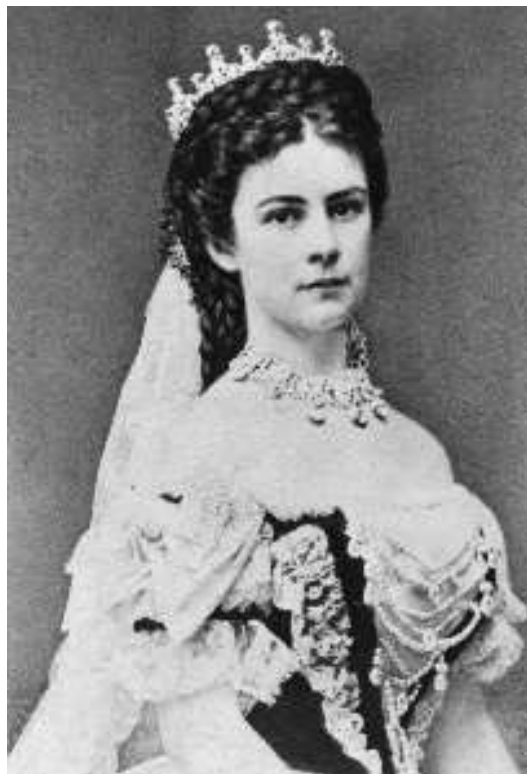
Slika 2: Elizabeta Bavarska.

Ko se je z mamo in starejšo sestro, princeso Heleno odpravila v Bad Ischl, kjer naj bi Helena spoznala svojega zaročenca, njenega bratranca, 23-letnega avstrijskega cesarja Franca Jožefa, se vse ni odvijalo po načrtih. Franc Jožef se namreč ni zanimal za Heleno, temveč bolj za Elizabeto, ki pa sprva ni bila po godu njegovi materi Zofiji. Od zaroke do poroke je trajalo osem mesecev in v tem času so Elizabeto pripravili na cesarske dolžnosti. V nekaj mesecih so jo naučili francoščine, velik poudarek je bil na zgodovini njene nove domovine, seznanili so jo z vedenjem, protokolom in navadami na dunajskem dvoru, vcepili so ji tudi nekaj higienskih načel. Poroka je bila določena za 24. april 1854. Elizabeta se je peljala po Donavi do Linza z ladjo, okrašeno s cvetjem. Dunajčane je takoj očarala s svojo nenavadno lepoto. Po poroki nikakor nista mogla biti sama, ker ju je čakalo kup uradnih zadev. Kmalu po poroki je bil Franc Jožef spet zasut z delom in ker sta bili tašča in snaha dosti sami skupaj, so se začeli prepiri. Elizabeta je raje kot bila samo doma hodila več ur okrog. Rada je imela sprehode, saj je bila podeželsko dekle in na nov način življenja jo je venomer spominjala tašča. [1]