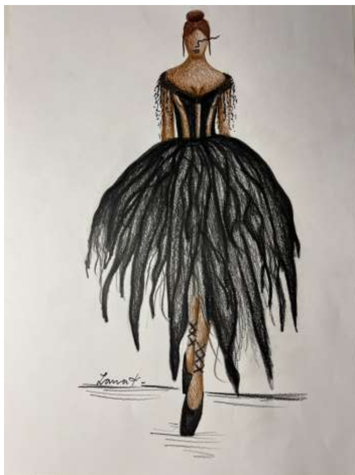
slika 12: skica črnega laboda

Prva skica ponazarja črnega laboda. Zamislili sva si veliko črno krilo, ki bi ob vrtenju plesalke izgledalo še bolj košato in bujno. Bilo bi narejeno iz tila in neenakomerno dolgo na različnih delih. Zgornji del je korzet, sestavljen iz izmenjujočih se delov črnega satena in prosojnega materiala. Čez ramena bi balerina imela trak, sestavljen iz kristalčkov v črni barvi, ki bi se na predelu roke razširili navzdol. Ta del bi bil narejen tako, da bi se balerina še vedno premikala, kot se mora.