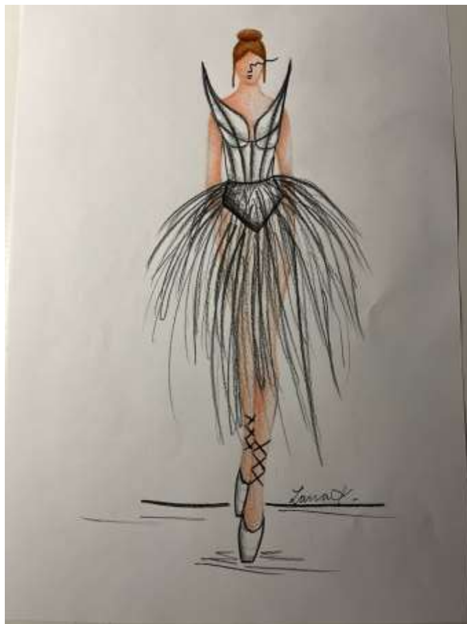
slika 13: skica belega laboda

črne paspule, saj je običajno, da plesalka v Labodjem jezeru odpleše vlogo črnega in belega laboda. Krilo bi bilo prav tako neenakomerno in zelo bujno, vendar prosojno.