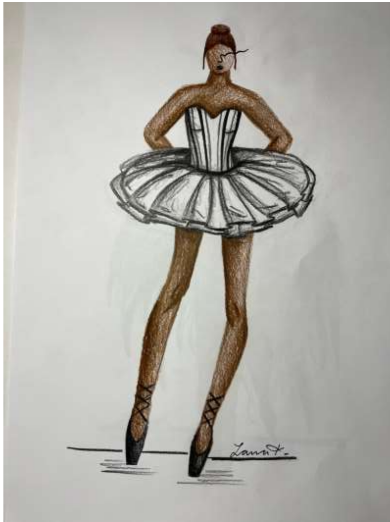
slika 14: končna skica