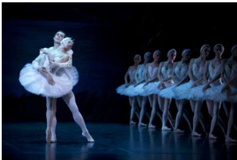
Slika 10: Labodje jezero

Balet je predelava starodavne legende o iskanju nedosegljive ljubezni, lepote in popolnosti, ki povzema ideal romantičnega baleta. Labodje jezero so prvič predvajali v Bolšoj teatru v Moskvi 4. marca 1877. V spremenjeni različici ob premieri v Sankt-Peterburgu zaradi slabe izvedbe balet ni doživel velikega uspeha.