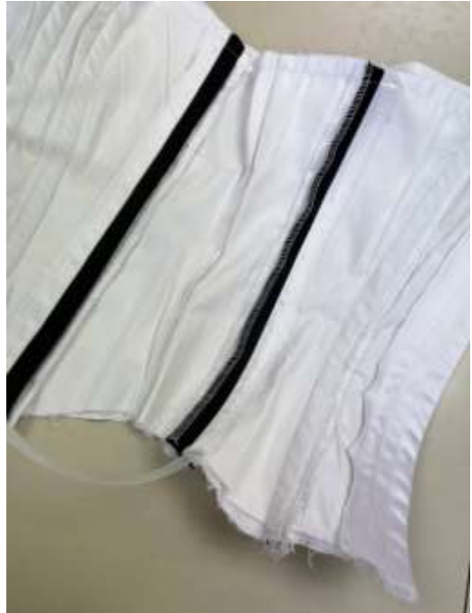
slika 35: šivanje obrobe slika 36: vstavljanje kosti

Po vstavljanju kosti je sledilo šivanje okrasne notranje obrobe na spodnji del korzeta. Obe notranji obrobi (zgornjo in spodnjo) sva natančno in previdno zalikali na notranjo stran in obrobi na notranji strani zaključili s skritim ročnim vbodom.