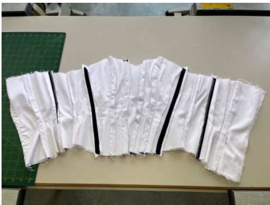
slika 33: hrbtna stran sestavljenega korzeta

Zalikane in razlikane šive na prednjem in zadnjem delu sva pošili na natančno 13 mm, in tako ustvarili kanale, skozi katere sva kasneje vstavili kosti.