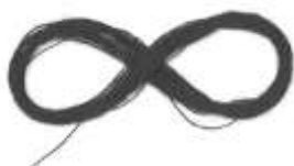
slika 19: črn sukanec