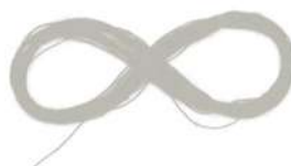
slika 20: bel sukanec