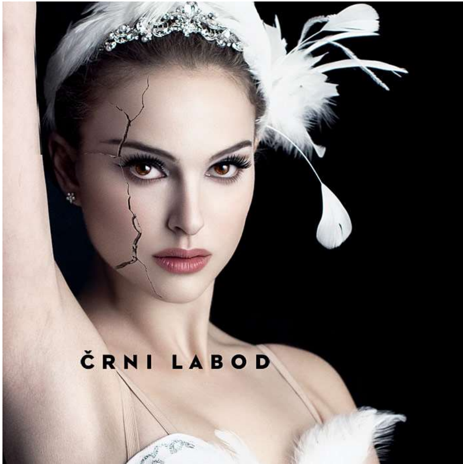
slika 11: črni labod