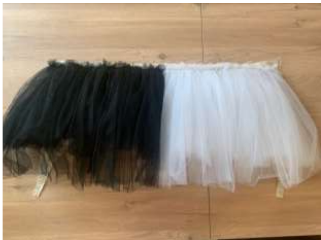
slika 39: tutu