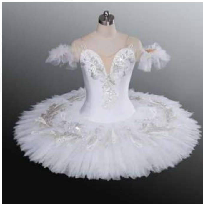
slika 6: baletni tutu

Baletna oprema, ki jo baletni plesalci nosijo na treningu, je dres, krilo, tutu, baletne nogavice, mehki baletni copati, baletne špice, gamaše za ogrevanje in začetek treninga, krilo pogosto nadomestijo kratke hlačke ali pajkice, v baletne špice pa si plesalke dajo ščitnike za prste. Moški nosijo pajkice.