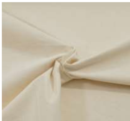
slika 17: platno