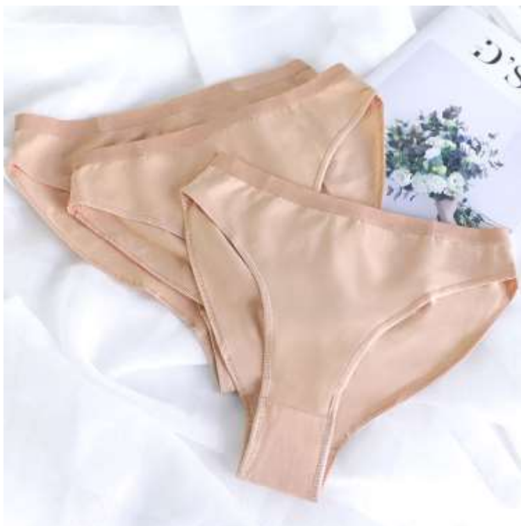
slika 8: baletne hlačke