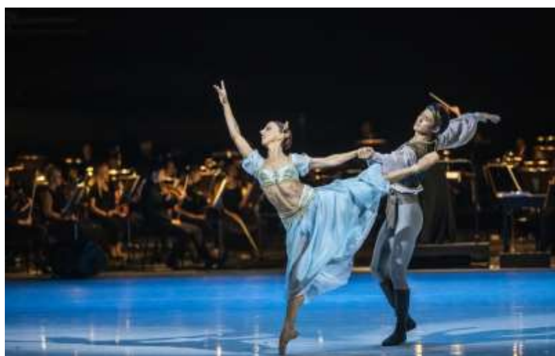
slika 5: prizor iz baleta