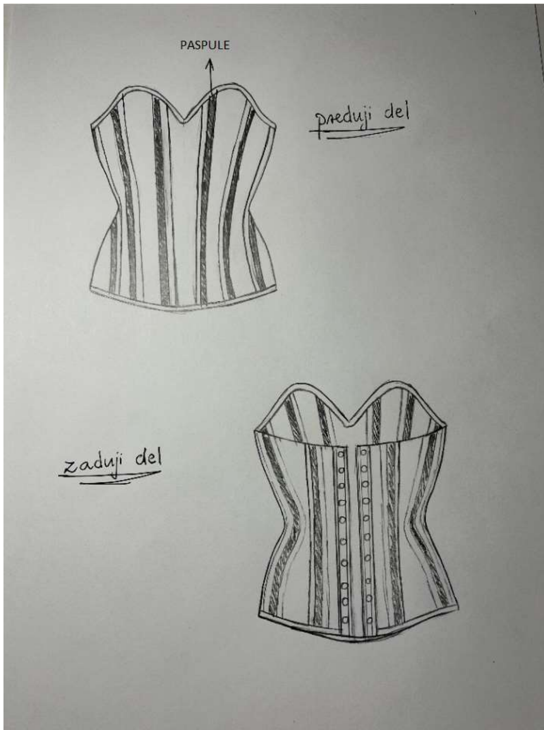
Slika 15: tehnična skica