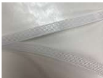
slika 21: kost