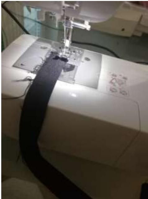
slika 26: šivanje trakov za paspule

Posamezne krojne dele iz satena sva prišile na krojne dele iz platna in vse dele opletli. Nato sva izkrojili 4 cm široke črne trakove za paspulne trakove.