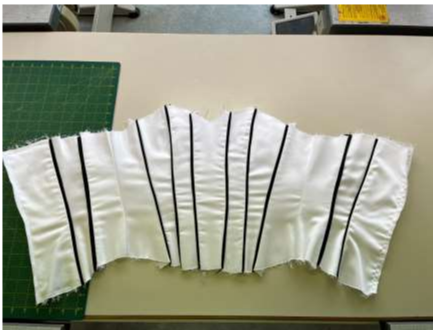
slika 32: sestavljen korzet