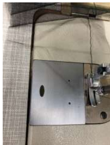
slika 40: šivanje tutuja