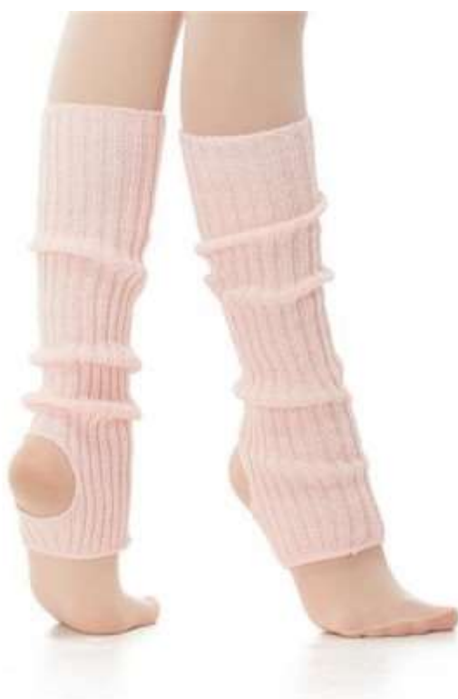
slika 9: gamaše