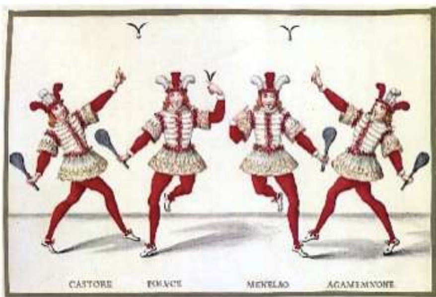
slika 2: začetki baleta

Prva baletka, ki je stopila na konice prstov, je bila Marie Taglioni in ker konica špice še ni bila utrjena tako kot danes, je njen oče razvil vaje za krepitev stopala.