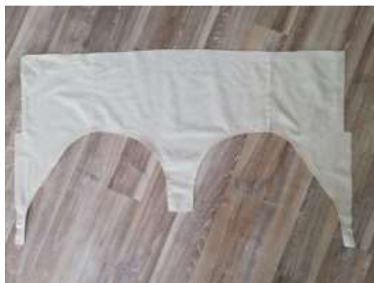
slika 38: šivanje hlačk

Spodnji del tutuja (hlačke) sva najprej sestavili na straneh. Sestavne šive sva opletli in pri nogavnicah zarobili 1 cm. Na tako pripravljenem spodnjem delu sva označili devet linij, na katere sva kasneje našili različno široke trakove tila.