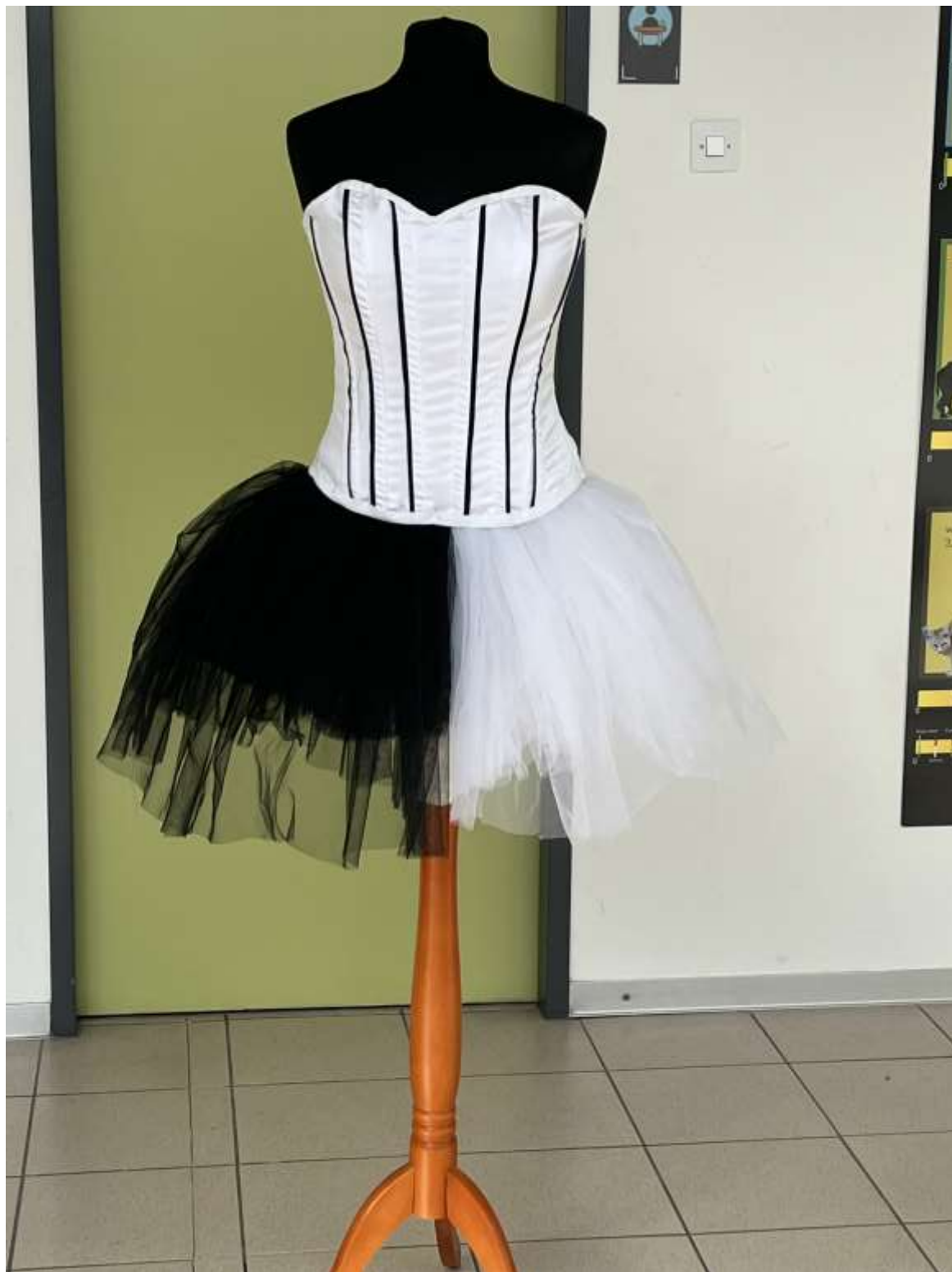
slika 41: končni izdelek