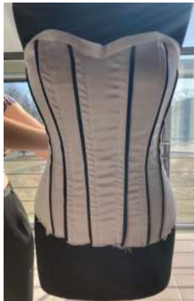
slika 37: korzet

Po vstavljanju kosti je sledilo šivanje okrasne notranje obrobe na spodnji del korzeta. Obe notranji obrobi (zgornjo in spodnjo) sva natančno in previdno zalikali na notranjo stran in obrobi na notranji strani zaključili s skritim ročnim vbodom.