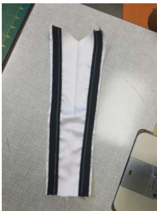
slika 30: šivanje paspul na sprednjem delu

Sestavne šive sva razlikali oz. zalikali. Enake postopke šivanja sva ponovili na sprednjem delu korzeta.