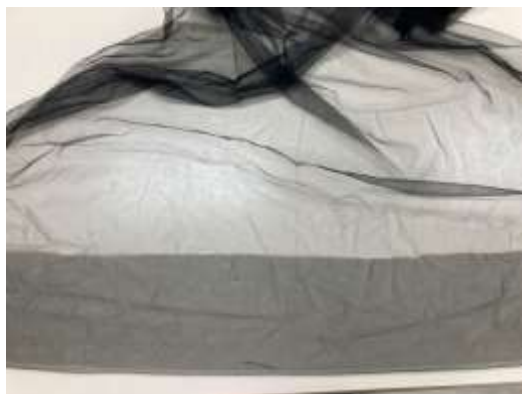
slika 24: til

Gornji del krila (tutuja) je sestavljen iz več plasti tila. Til sva krojili na trakove različnih širin. Za vsako barvno polovico (črno in belo) sva narezali 9 različno širokih trakov.