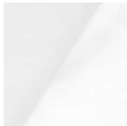
slika 18: bel til