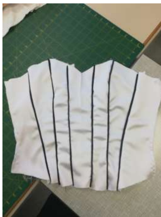
slika 31: sestavljen sprednji del

Prednji del in zadnja dela sva sestavili še na stranskih sestavah, šive razlikali in tako dobili korzet.