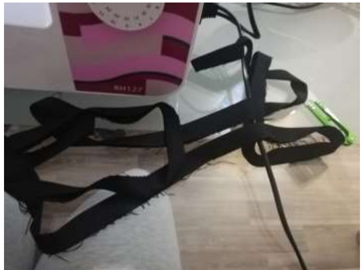
slika 27: črni paspulni trakovi

Paspulne trakove sva nato našili na posamezne zadnje krojne dele natančno po šivu paspulne širine. Tako pripravljene posamezne zadnje dele sva sestavili v celotna levi in desni zadnji del.