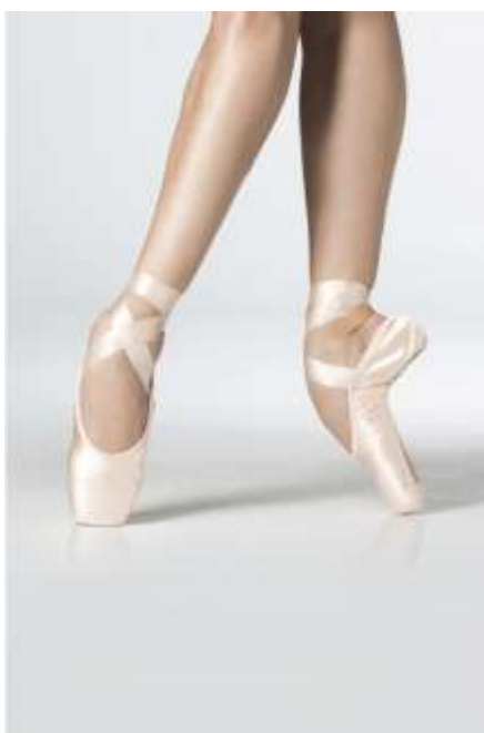
slika 7: baletni copati