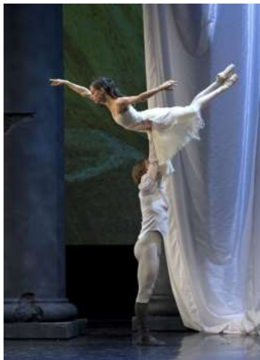
slika 4: Romeo in Julija