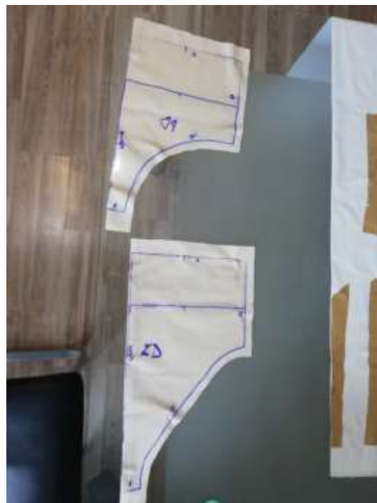
slika 23: izrezan kroj hlačk

Gornji del krila (tutuja) je sestavljen iz več plasti tila. Til sva krojili na trakove različnih širin. Za vsako barvno polovico (črno in belo) sva narezali 9 različno širokih trakov.