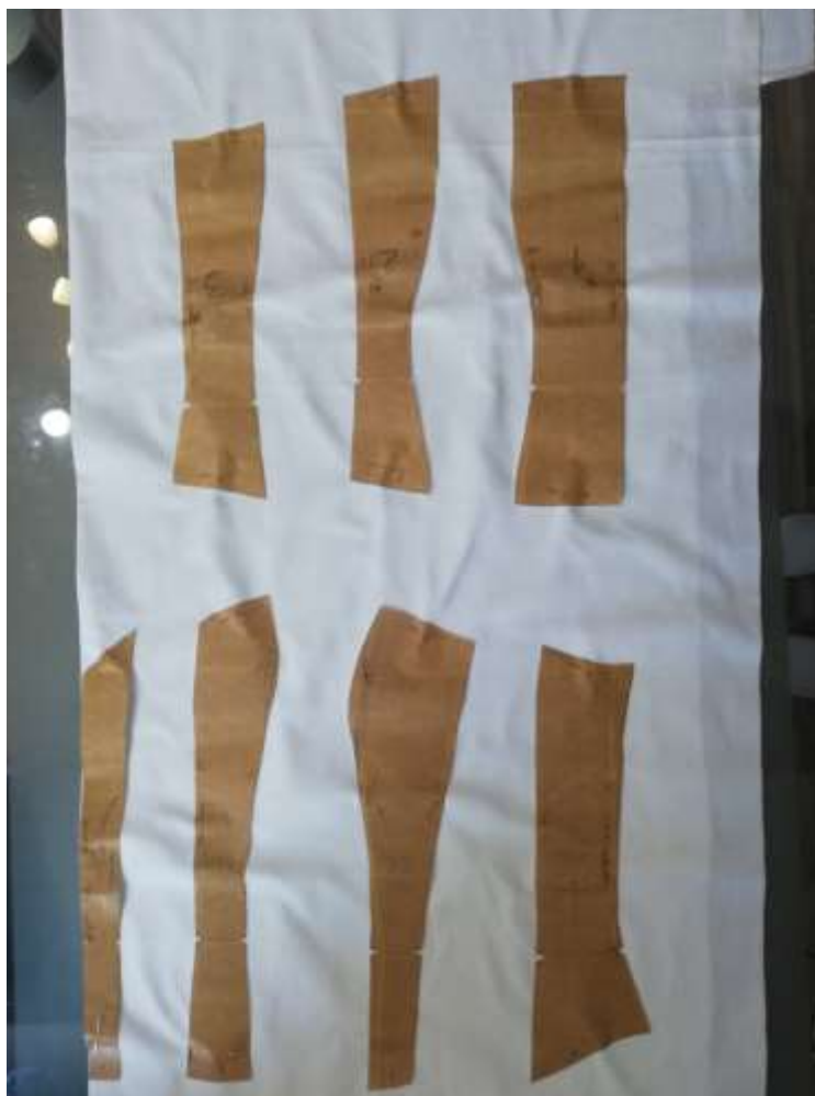
slika 25: krojni deli korzeta

Kroj za korzet je sestavljen iz štirih prednjih in treh zadnjih delov. Posamezne krojne dele sva krojili iz satena in platna, ki daje korzetu večjo stabilnost in togost.