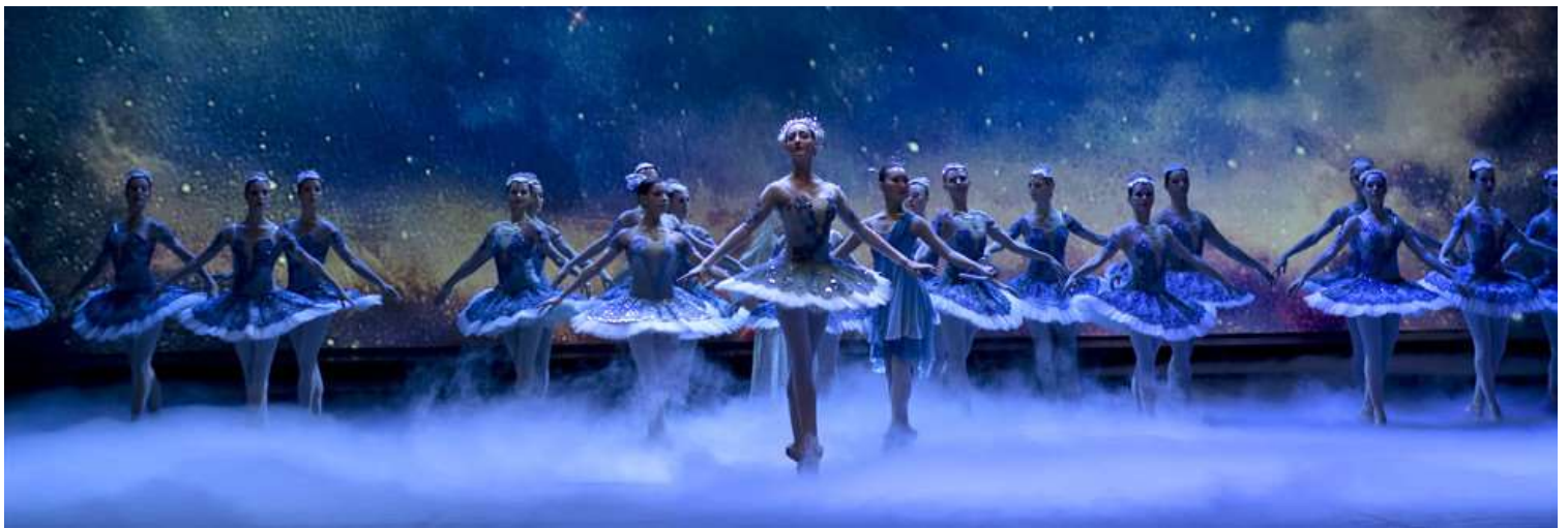
slika 1: balet

Balet najhitreje prepoznamo po baletnih krilcih, ki stojijo navzven – tutujih.