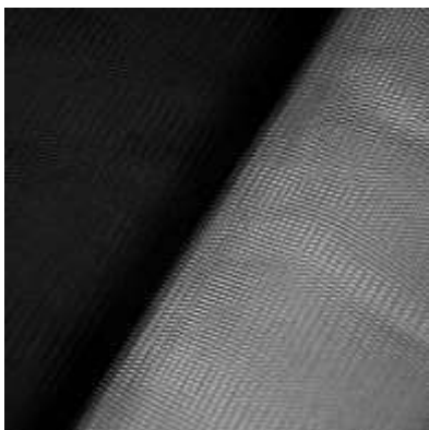
slika 16: črn til