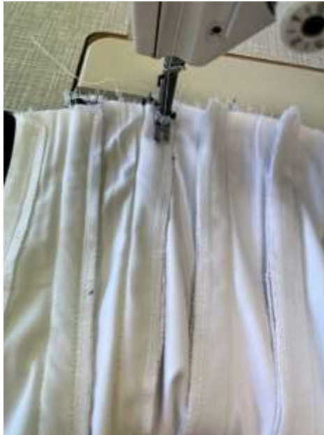
slika 34: šivanje kanalov

Robove na korzetu je potrebno zgoraj in spodaj zaključiti in čisto obdelati. Za čisti zaključek robov sva izkrojili dva daljša 4 cm široka trakova, ki bosta služila za notranjo obrobo. Trakova sva z obeh strani zalikali za 1 cm. Najprej sva našili obrobni trak na gornji rob korzeta. Nato sva poskusili, ali se vse kosti prilegajo svojim kanalom, in odrezali kosti na pravilno dolžino, da se prilegajo.