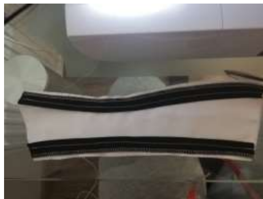
slika 28: krojni del s paspulami

Paspulne trakove sva nato našili na posamezne zadnje krojne dele natančno po šivu paspulne širine. Tako pripravljene posamezne zadnje dele sva sestavili v celotna levi in desni zadnji del.