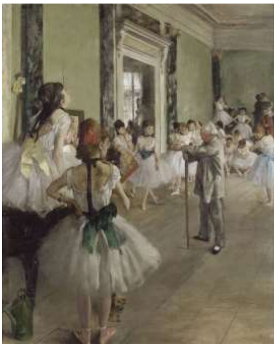
slika 3: baletni studio

Med najbolj znane balete spadajo Labodje jezero, Hrestač, La Sylphide, Romeo in Julija, Giselle, Don Kihot, Pepelka, Trnuljčica, Hamburški balet, Londonski kraljevi balet.