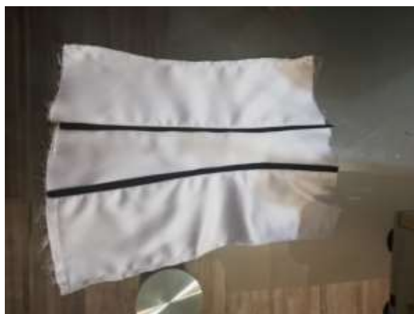
slika 29: sestavljen zadnji del

Sestavne šive sva razlikali oz. zalikali. Enake postopke šivanja sva ponovili na sprednjem delu korzeta.