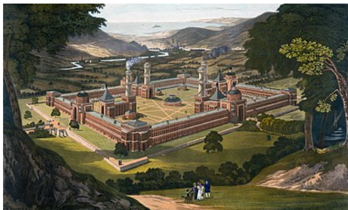
Slika 1: poskus vzopstavitve utopične družbe po predlogih Roberta Owena

Zgodnji socialisti, kot so Henri de Saint-Simon, Charles Fourier in Robert Owen so ponujali svoje modele družbene organizacije, ki naj bi temeljili na sodelovanju in ne konkurenci. Saint-Simon se je zavzemal za sistem, v katerem država nadzoruje proizvodnjo in distribucijo v korist vseh članov, Fourier in Owen pa sta predstavljala sisteme, ki temeljijo na majhnih kolektivnih skupnostih in ne na centraliziranih državah. Owen je leta 1825 celo ustanovil eksperimentalno komuno v Indiani, ki je temeljila na načelih samooskrbe, sodelovanja in javne lastnine, ki je sicer kmalu propadla. Fourierjeve teorije so se manifestirale sredi 19. stoletja, ko je bilo po njegovih načelih ustanovljenih na stotine komun v ZDA, Franciji, Jugoslaviji in drugje. 5