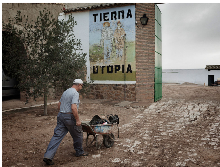
Slika 2: Marinaleda

“Mesto Marinaleda v Andaluziji na jugu Španije je primer, ki kaže, da je mogoče družbo urediti tudi na način, ki je večini Evropejcev že tuj ali pa ima celo negativen prizvok. V Marinaledi so namreč uvedli družbeno lastnino, prebivalci so zaposleni večinoma v zadrugah, delajo na polju in v tovarni, enakost je potrjena tudi pri plačah, politično odločanje pa je