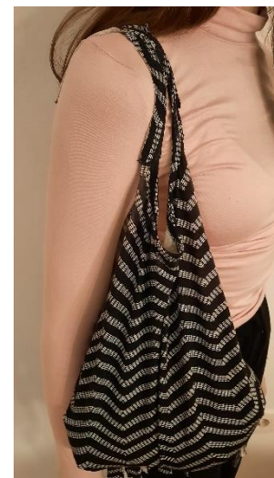
Slika 8: Končni izdelek 2 (Vir: Osebni arhiv)