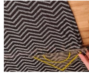
Slika 5: 2. korak

S kredo načrtaj potek rezanja. Na dnu (približno 5 cm od spodnjega roba majice) s kredo zariši ravno črto, ki bo označevala dno torbe.