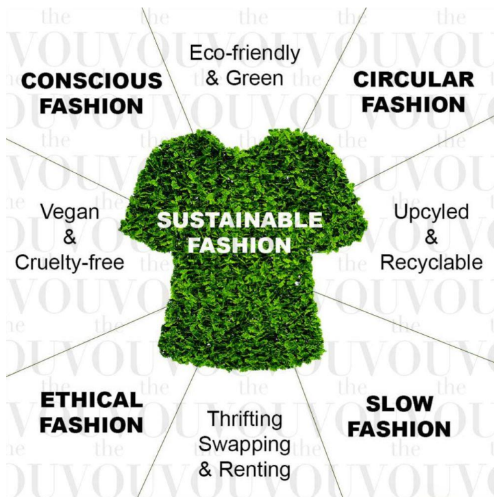
Slika 2: Trajnostna moda