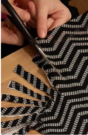
Slika 6: 3. korak