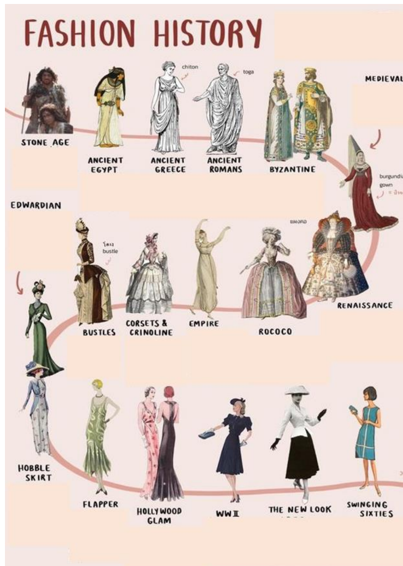
Slika 1: Zgodovinski pregled oblačil