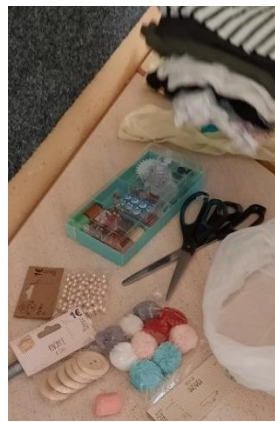
Slika 3: Pripomočki