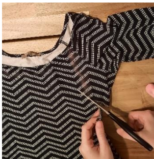
Slika 4: 1. korak

Da bo leva stran popolnoma enaka desni, svetujemo, da majico preložite na pol in izrežete oba rokava naenkrat.