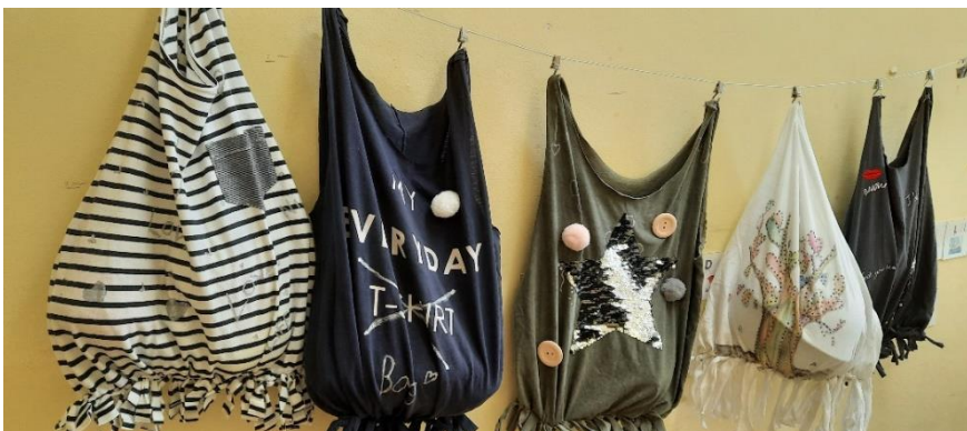
Slika 9: Končni izdelki