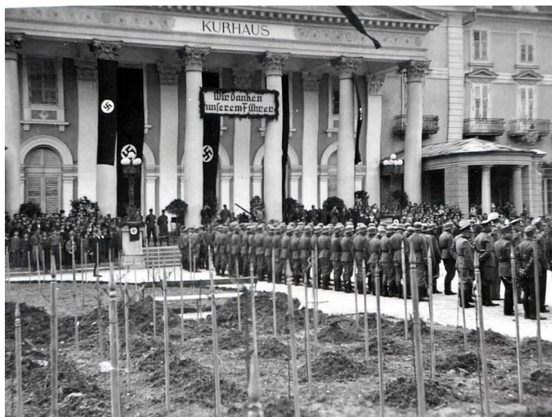
Slika 2: Zdraviliški dom oz. Rathaus, 11. 4. 1942

Prva obletnica okupirane Rogaške Slatine ni ostala neopažena; slovesne proslave, ki je potekala 11. aprila, se je namreč udeležilo okrog 70 uniformiranih nemških vojakov. 3