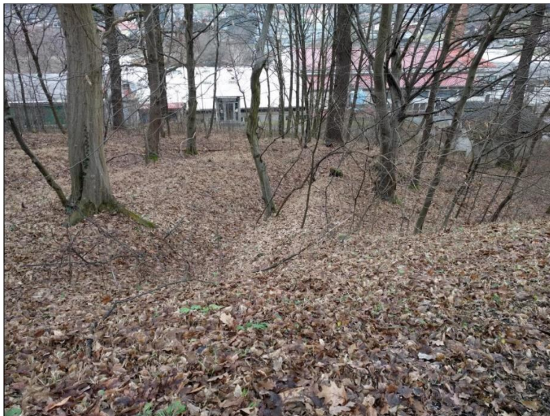
Slika 6: Ostanke strelskih jarkov v Rjavici

Nemcem je največ preglavic povzročala meja na Sotli. Kljub temu, da je bila zastražena, so preko nje redno uhajali begunci, uporniki in črnoborzijanci. Nemci so zato ob meji postavili štiri vrste dva metra visokih ograj iz žic, mednje pa so nastavili mine. Hkrati jih je moril še strah zaradi neizbežnega konca vojne in s tem njihov poraz. V gozdovih v bližini Rogaške Slatine so zgradili sistem strelskih jarkov in podzemnih bunkerjev, kar jim je dalo prazne upe o navideznem uspehu. Že 7. maja 1945 je namreč Rogaško zapustila žandarmerija in policija, skupaj z Nemci pa tudi Čerkezi in ustaši. Kljub zmagi NOV pa je v bližnjih krajih veljalo morbidno vzdušje, saj so ustaši v paniki še vedno ustrahovali in ubijali ljudi. Po nemški kapitulaciji so odbori OF začeli prevzemati oblast in organizirati splošne volitve.