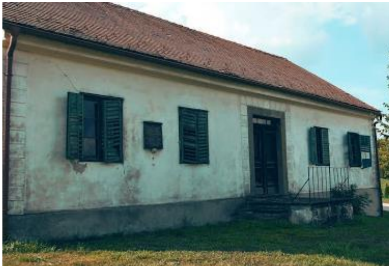
Slika 8: Otroški dom Borisa Kidriča