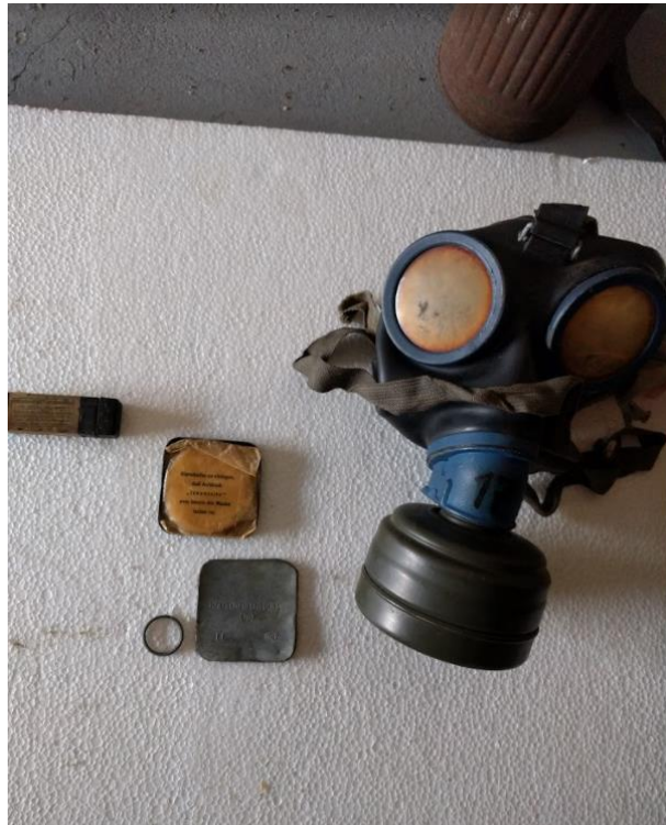
Slika 12: Nemška plinska maska