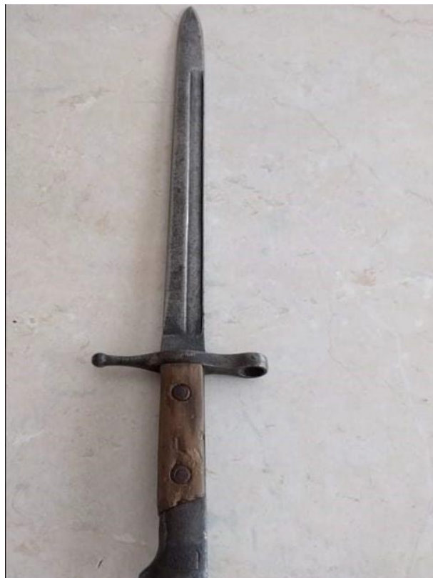
Slika 13: Nož iz leta 1941