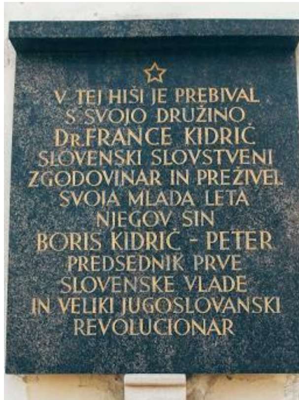
Slika 9: Tabla, ki zaznamuje hišo Kidričevih