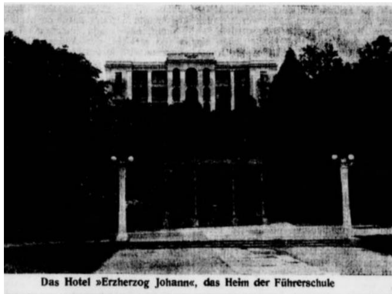
Slika 3: Fotografija iz časopisa Marburger Zeitung , ki prikazuje sedež poveljniške šole

V zadnjih dneh junija 1941 je v Rogaški Slatini po navodilih o osnovnih direktivah in organizaciji Wehrmannschafta bila ustanovljena častniška šola za potrebe vojaško-političnega izobraževanja ter usposabljanja. Obratovala je v poslopih današnjega Hotela Aleksander, kjer so na voljo imeli prostorne sobe in električno razsvetljavo. Tečaje, ki jih je ponujala šola, so v velikem številu obiskovali vermanski kandidati, ki so prihajali od daleč naokrog, od Spodnje in Zgornje Štajerske vse do Gorenjske in Južne Koroške. Okupatorjev uradni list je šolo označeval kot eno najlepših izobraževalnih ustanov nemškega rajha.