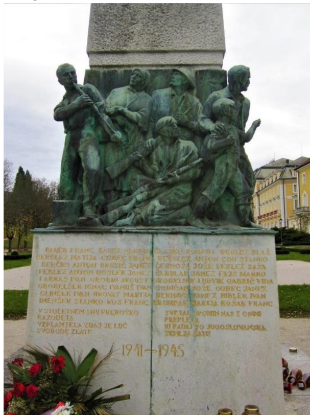
Slika 10: Spomenik NOB