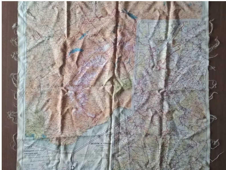
Slika 11: Zemljevid, ki ga je za seboj pustil ameriški pilot

»Proti koncu leta 1943 ali pa začetku 1944 je na bližnjem hribu s padalom pristal ameriški pilot. Nekaj časa se je skrival, preden ga je opazil stric. Pomahal mu je, naj pride bliže. Pilot je s seboj imel slovar, v katerem je poiskal besede: "Dajte mi jesti, piti, skrite me." Na domačiji so poskrbeli zanj in se pretvarjali, da je njihov gluhonem hlapec, ki je pomagal pri hišnih opravilih. Kadarkoli je prišla nemška patrolja se je dobro pretvarjal, da jih ne sliši in da ni sposoben govoriti. Po koncu vojne se je po sreči vrnil domov. Družini je v zahvalo pogosto pisal, dopisovali so si še dolga leta in vojak je dočakal visoko starost.«