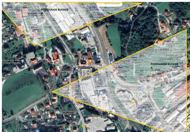
Slika 14: Skica pokrivanja prostora iz bunkerjev A in B. (Standardni efektivni domet nemškega mitraljeza MG 42 iz podstavka je do 3500 m)

Izvedeli sva še o lokaciji dveh utrjenih podzemnih položajih - bunkerjih. Oba sta se nahajala v ožji okolici cerkve Sv. Križa v Rogaški Slatini. Bunker A je iz rahle vzpetine blizu župnišča gledal oz. pokrival ravnino, kjer se nahaja Steklarna Rogaška, Bunker B pa je pokrival ravnino proti centru Rogaške Slatine (gledano iz strani cerkve) in je bil vkopan neposredno pod staro šolo, ki je takrat stala tam (kasneje je bila porušena). Lokacija bunkerja A je sedaj pozidana z novogradnjami, na lokaciji bunkerja B pa sledovi ravno tako niso več vidni, ker se je bunker porušil. Kot otroci so se starši (50 let nazaj) igrali v in okrog teh bunkerjev. Bunker A je bil takoj za vstopom zazidan, bunker B pa naseljen z različnimi živalmi in plazilci, zato vanj niso radi vstopali. Strelne line obeh bunkerjev je že takrat zasula zemlja, vhodi so pa bili popolnoma ohranjeni. Desno od lokacije bunkerja B in približno sto metrov stran naj bi se nahajal še eden, vendar se tega ne da z gotovostjo trditi, ker so to izvedeli iz druge roke, medtem ko so v oba druga (A, B) s prijatelji večkrat vstopali.