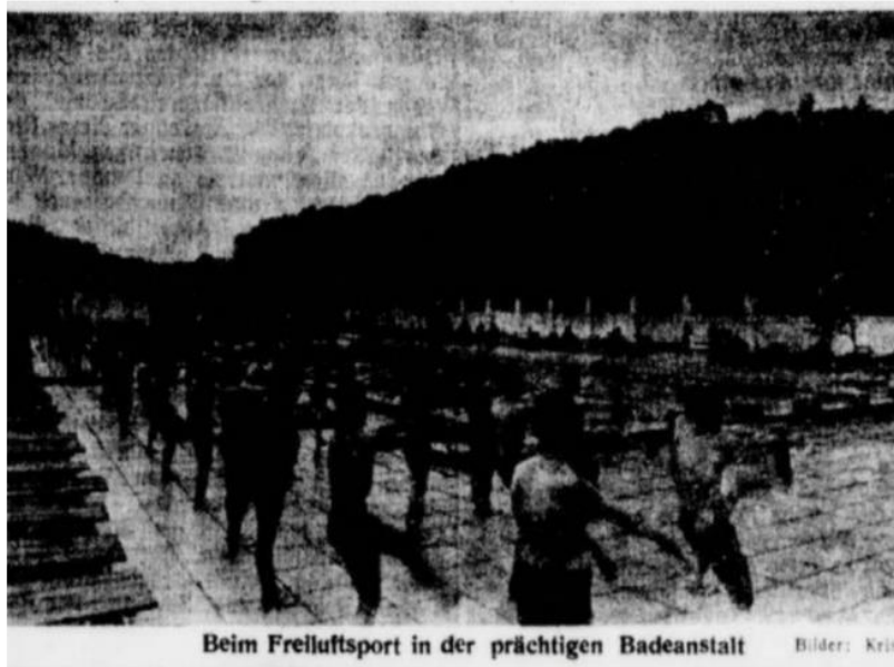
Slika 4: Fotografija iz časopisa Marburger Zeitung , ki prikazuje udeležence pri telovadbi

Pisca članka je prvi častnik poveljniške šole Ernst Dräger popeljal na ogled šole, mu opisal strogo disciplino, ki je "tako stroga, da si iz šole še nihče ni upal pobegniti" 7 . Dräger je pojasnil, da pri izobraževanju poudarek dajejo na zgodovino, zemljepis in nemški jezik; pri zemljepisu so se učili branja vojaških zemljevidov, uporabe kompasa in urjenje orientacijskih sposobnosti. Poleg teh predmetov so jih na urniku čakala še predavanja o aktualnih političnih vprašanjih, ponavljanje splošnih predpisov v SA, učenje tehničnega ravnanja z orožjem, učenje uradnega pozdravljanja in pravnega korakanja ter predavanja o nemških poveljih v posameznih vermanskih formacijah. Osredotočali so se na to, da oblikujejo vojake, ki sledijo idealom nacionalsocialistične ideologije. Prirejali so tudi vojaška urjenja in borbene vaje ter vse podobno, kar je bilo potrebno za usposabljanje vermanskih častnikov ter podčastnikov.