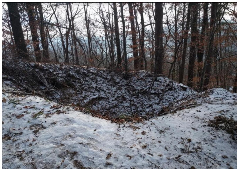
Slika 15: Ostanek bunkerja na Janini