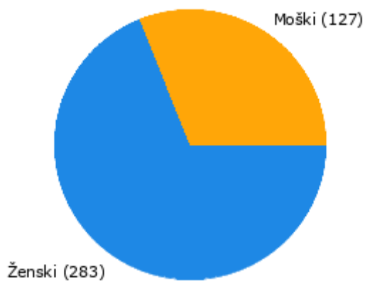
Graf 2: Spol anketirancev