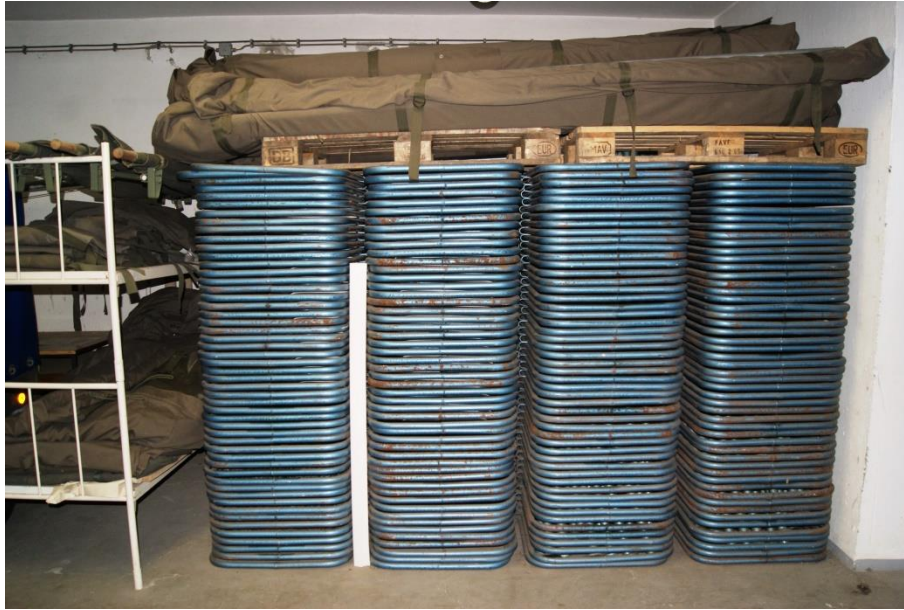
Slika 10: Zložena oprema v zaklonišču na Mojstrski ulici 28

Zaklonišča so se delala le v mestu, v okolici mesta pa so za te namene uporabljali kleti. Na kletih je bilo potrebno zadelati okna s peskom, ampak to je bila le fizična zaščita v primeru, če bi prišlo do rušenja ali bombnega napada.