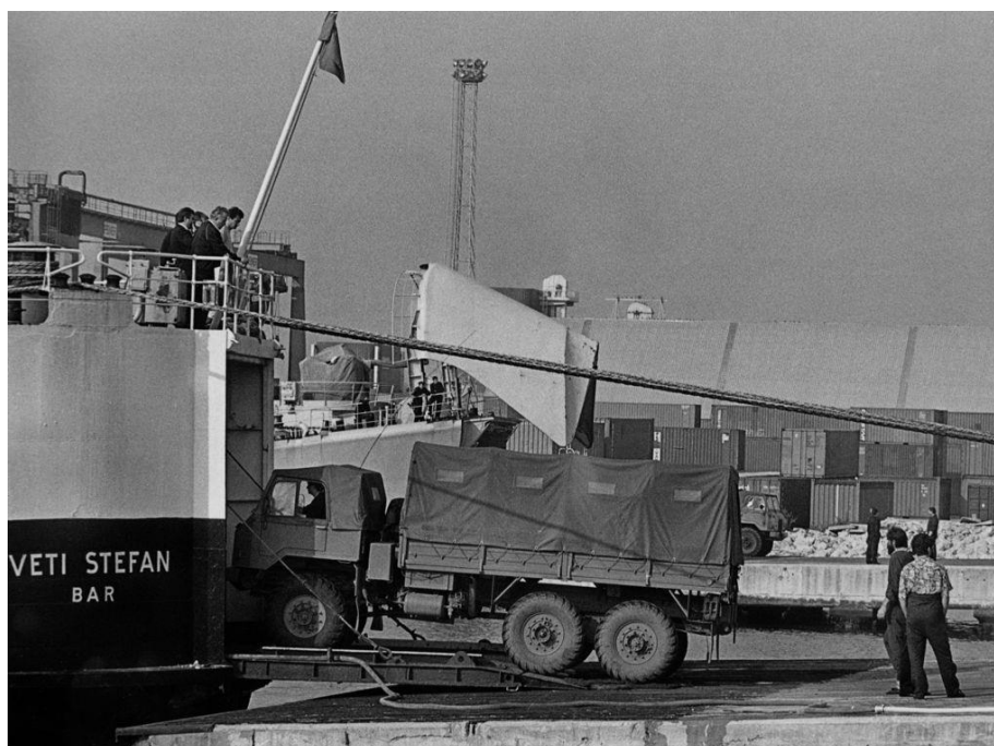
Slika 3: Umik Jugoslovanske vojske iz Slovenije 16

Slovenija se je poleg oboroženega odpora odzvala tudi z odmevnim obveščanjem domače in svetovne javnosti. V vmesnem času so potekala pogajanja pa tudi nove ofenzive in blokade. Slovensko vodstvo je vztrajalo na plebiscitarni odločitvi in 2. junija zvečer enostransko razglasilo ustavitev ognja. 3. junija je še prihajalo do posamičnih spopadov, že naslednji dan pa so se enote JLA po treh mesecih v celoti umaknile iz Slovenije. 15