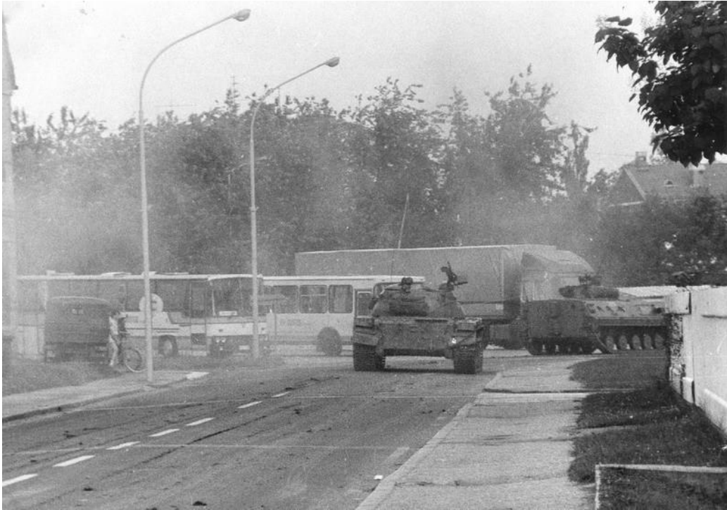
Slika 4: Tank na cesti v Gornji Radgoni 21

2. julija je potekal spopad v Presiki in po preboju enote JLA naslednji dan v Pristavi ter pred Ljutomerom. 3. julija je poskušala s prebojem oklepna kolona pri Krogu. V istem obdobju je bila blokirana vojašnica v Murski Soboti, pogajanja pa so potekala pod pritiskom grožnje raketiranja skladišča orožja v neposredni bližini mesta. Postopoma so se predajale tudi stražnice JLA na celotnem ozemlju, pri čemer je bilo najbolj dramatično zavzetje stražnice na Kuzmi 2. julija, ko je v bojih padel njen poveljnik. Vojna dveh, po oborožitvi neenakovrednih nasprotnikov, se je končala z zmago tistega, ki je bil bolj motiviran, katerega cilj je bil obramba domovine. 22