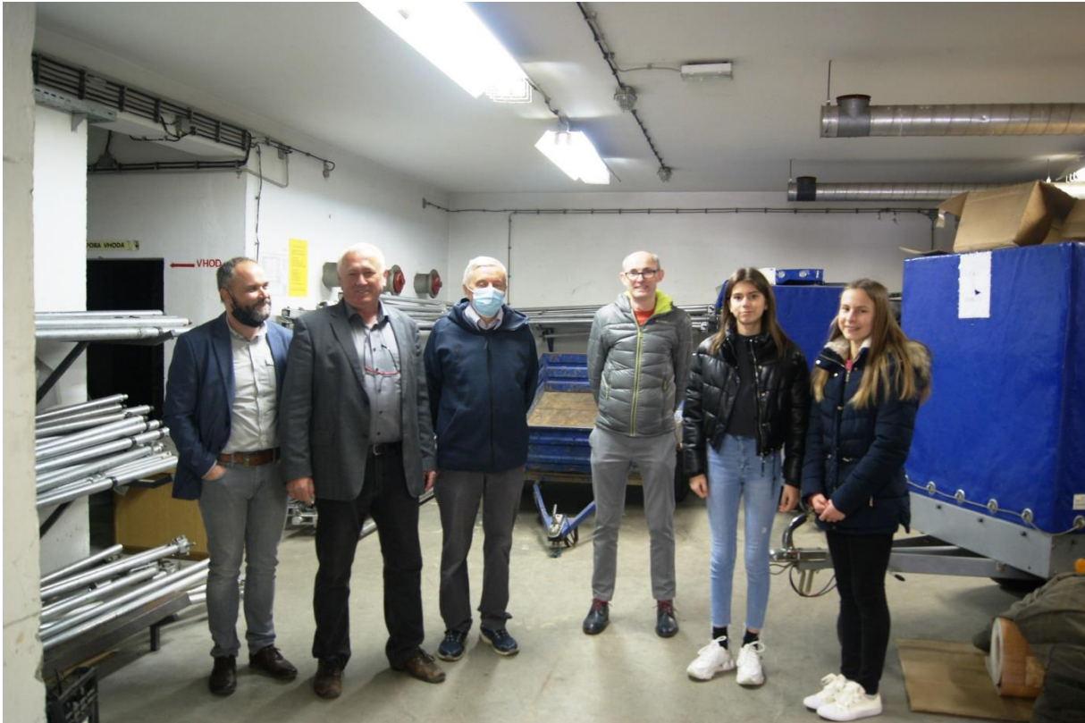
Slika 16: Notranjost zaklonišča na Mojstrski ulici v Murski Soboti 43