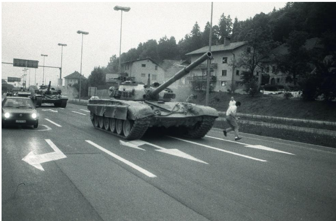
Slika 2: Začetek osamosvojitvene vojne v Sloveniji 12

Slovenska skupščina je samostojnost razglasila 25. junija 1991. Na mejnih prehodih in na kontrolnih točkah s Hrvaško so bile jugoslovanske zastave in table zamenjane s slovenskimi. Ponoči naslednjega dne je zvezna vlada sprejela sklep, da bo v sodelovanju s sekretariatoma za notranje zadeve in obrambo prevzela vse posle v zvezi s prehodi državne meje. Na osnovi teh sklepov pa je JLA 27. junija pričela napad na Slovenijo. 11