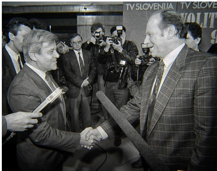
Slika 1: Milan Kučan in Jože Pučnik ob razglasitvi rezultatov volitev 8

Septembra 1989 sprejeti ustavni amandmaji so omogočili ustavni prehod iz socialističnega v tržno gospodarstvo in iz enopartijskega v večstrankarski sistem. Leta 1990 so se na teh osnovah dokončno oblikovale klasične politične stranke. Na pomladanskih volitvah je kot združena opozicija največ glasov prejel Demos 5 . Neposredno je bilo izvoljeno tudi predsedstvo republike s predsednikom Milanom Kučanom 6, 7