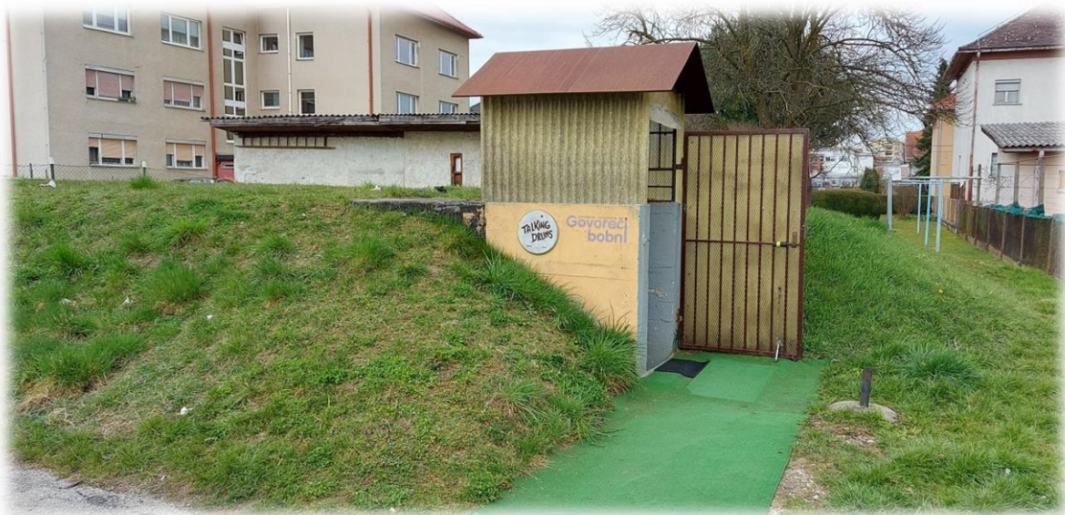
Slika 5: Zaklonišča v mirnem obdobju služijo drugim namenom 24

Blizu naše šole (čez cesto) se nahaja zaklonišče, kjer trenutno gostujejo glasbena delavnica Govoreči bobni pod mentorstvom Mirana Celca. Za potrebe vaj bobnanja so si preuredili zaklonišče v prijetno glasbeno delavnico, ki deluje že 20 let. S tem, da imajo prostore v zaklonišču, s svojimi vajami ne motijo okoliških prebivalcev.