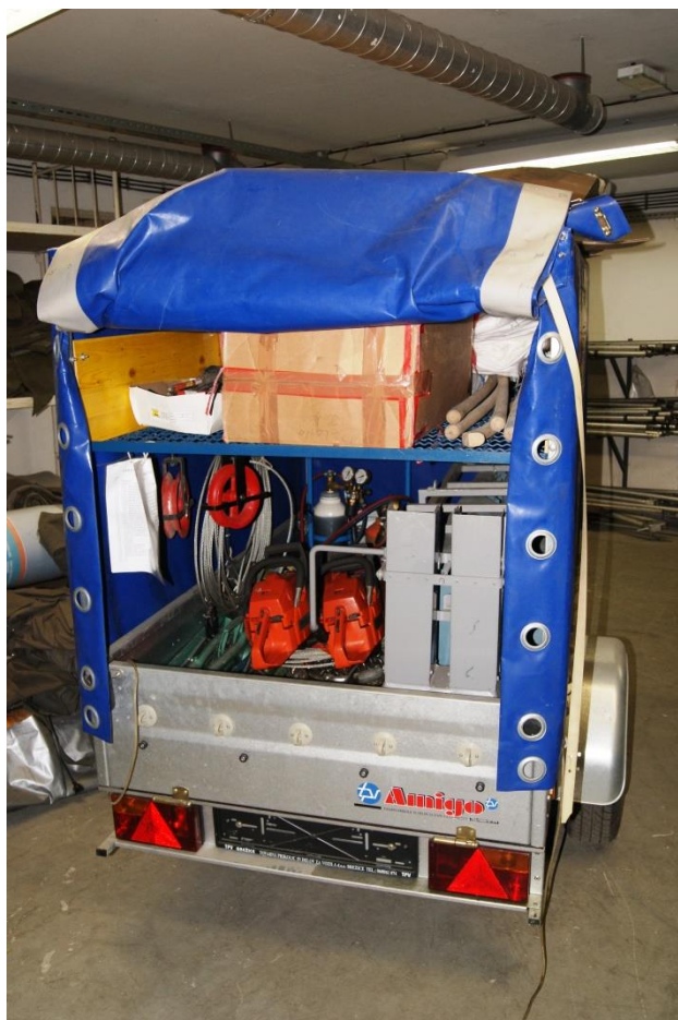
Slika 15: Danes imajo v zakloniščih pripravljeno opremo za zaščito in reševanje 42

V Murski Soboti je trenutno osem zaklonišč, ki se redno vzdržujejo in imajo glede na zakonsko podlago tehnični pregled vsakih 10 let. Lokacije zaklonišč v Murski Soboti so sledeče: