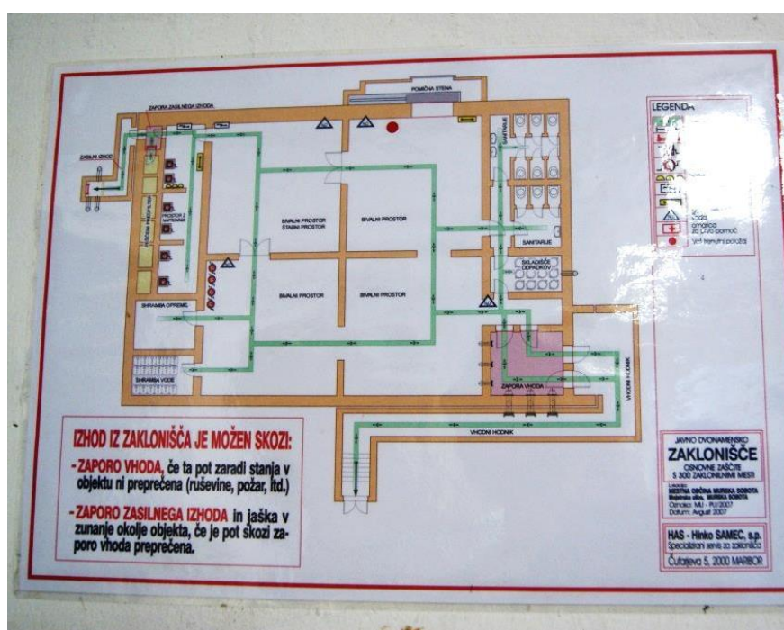
Slika 9: Načrt zaklonišča na Mojstrski ulici 27

Po letu 1987 je gradnja zaklonišč zastala zaradi ekonomsko-političnih razmer v tem času in odklonilnega stališča tako političnih struktur kot tudi občanov do gradnje zaklonišč, ki jih po teoriji politike in občanov »nikoli ne bomo potrebovali«. Po prekinitvi gradnje zaklonišč je bilo vprašljivo tudi financiranje vzdrževanja zaklonišč in zakloniščne opreme, za kar so delavci na področju Civilne zaščite kot tudi Občinski štab civilne zaščite morali vlagati veliko truda, da so ohranjali zaklonišča v primerni funkciji.