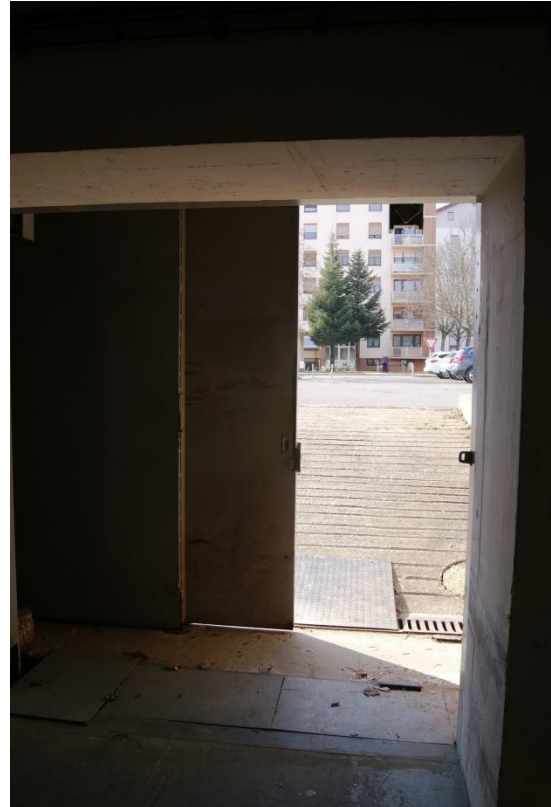
Slika 17 in 18: Zaščitna vrata pri vhodu in pogled na ulico 44

Zaklonišče danes ni prazno. Znotraj zaklonišča je oprema, ki bi se v primeru aktivacije zaklonišča lahko hitro pripravila za funkcionalno rabo. Ogledali sva si prezračevalne jaške, prostore za sanitarije, stranski vhod, filtrirne jaške in poskušali zakleniti vrata. Kljub temu da je zaklonišče odlično pripravljeno, zagotovo ob veliki količini ljudi ni prijetno, še posebej za ljudi, ki imajo strah pred zaprtimi prostori. Zaklonišča v Murski Soboti so varovana in kakovostno vzdrževana in po besedah najinih sogovornikov je skrb za njih precejšnje breme občine, ki pa se ob izjemnih dogodkih neprecenljivo izplača.