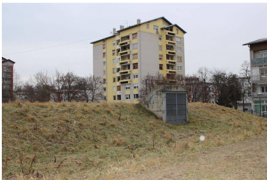
Slika 14: Zaklonišče na Mojstrski ulici, obdano z bloki. 41