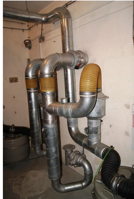
Slika 7 in 8: Leva slika prikazuje filtrirni sistem zračenja, desna pa zračni sistem v zaklonišču na Mojstrski ulici. 26