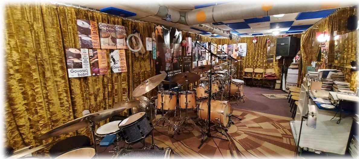
Slika 6: Notranjost zaklonišča Park, kjer gostuje glasbena delavnica Govoreči bobni 25

Blizu naše šole (čez cesto) se nahaja zaklonišče, kjer trenutno gostujejo glasbena delavnica Govoreči bobni pod mentorstvom Mirana Celca. Za potrebe vaj bobnanja so si preuredili zaklonišče v prijetno glasbeno delavnico, ki deluje že 20 let. S tem, da imajo prostore v zaklonišču, s svojimi vajami ne motijo okoliških prebivalcev.