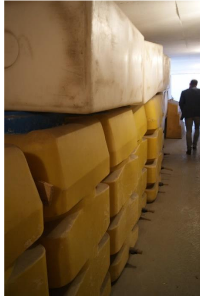
Slika 19 in 20: Slika levo prikazuje stranišča znotraj, v katerih so vedra s kemičnimi sredstvi (brez tekoče vode), slika desno prikazuje zalogovnike za vodo. 45