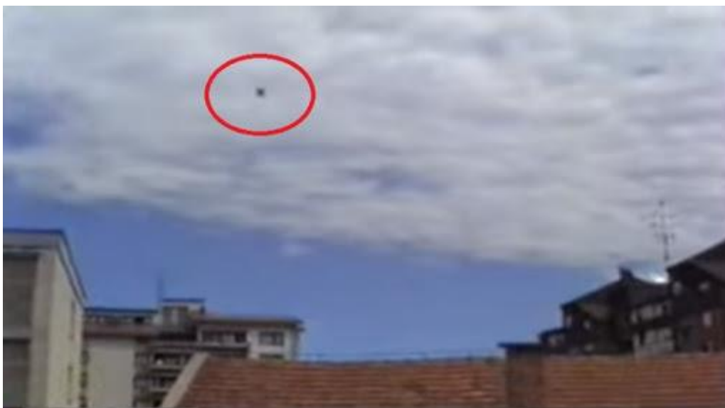
Slika 13: Zračni napad na Mursko Soboto 28. junij 1991 39

V izvajanje ukrepa je Štab civilne zaščite mesta Murska Sobota vključil službo za zaklanjanje pri OŠCZ. Ti so odprli in vzpostavili funkcijo zaklonišč, ki so bila prazna in naložili izpraznitev zaklonišč, v katerih je bila kakršna koli mirnodobna dejavnost. Zaradi odsotnosti učencev je OŠCZ v zaklonišču na Osnovni šoli III vzpostavil center za OŠCZ, službo za podporo pri OŠCZ in prvo pomoč v mestu Murska Sobota.