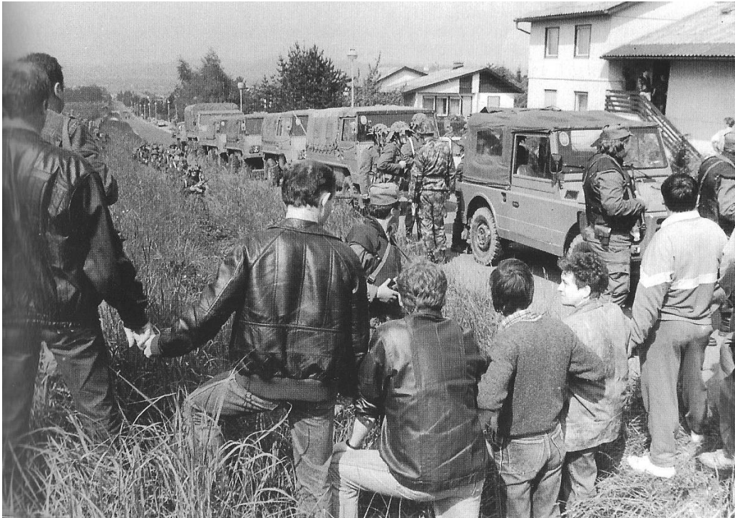
Slika 4: Živa veriga Mariborčanov 60

je, da je 710. UC branila le peščica pripadnikov TO, armada pa je navkljub izraziti premoči hotela še dodatne okrepitve. Morda je odgovor v tem, da je vodstvo mariborske JLA spoznalo, da so se zmotili; ne le da jim Mariborčani niso stopili ob bok, marveč so množično, združeno in zelo odločno nastopili zoper enote JLA.» 59