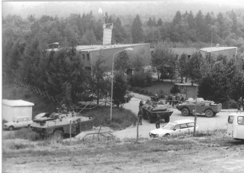
Slika 1: Obkolitev 710. učnega centra v Pekrah 42

izpustili. Kljub temu pa je Delić okoli 11. ure dopoldne Miloševića obvestil, da so tanki že krenili proti učnemu centru. 41