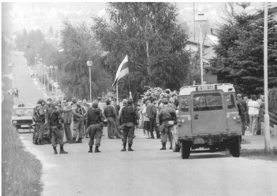
Slika 6: Pripadniki PEM, kot "živi ščit" 67

Zaradi neuspešnih pogajanj pred učnim centrom se je situacija vedno bolj zaostrovala. Poveljniki armade so postajali vedno bolj besni, posebej pa jih je motila odločnost branilcev. Okoli 15.40 je Katalina sporočil, da ima vsega dovolj in bo ukazal napad. Posebej srce parajoč prizor je bil, ko se je mati z otroki, ki je živela v centru, v joku umaknila iz svojega doma. Medtem pa je strelec na oklepniku z nožem kazal na pripadnike TO in nakazoval, da bi jim rad prerezal vratove. Pred učnim centrom se je razvnel žvenket zaklopk in psovke na račun branilcev. Vojaki na obeh straneh so bili napeti, in če bi takrat padel en sam strel, bi prišlo do pokola. Naš sogovornik je mnenja, da je to bil tudi namen JLA, saj je želela uničiti učni center in branilce ter krivdo naprtiti TO. 68