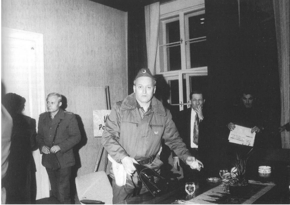
Slika 7: Poveljnik mariborskega korpusa, generalmajor Mićo Delić, takoj po Miloševičevi ugrabitvi. Na mizi je še vedno zloglasni kozarec vode. 76

Omenjeno je opisal tudi takratni podpredsednik skupščine Boris Sovič, ki je za častnik Delo dejal: »Povsem sem prepričan, da je bilo to dogovorjeno znamenje za začetek operacije, čeprav je Delić takoj po ugrabitvi sodelovanje zanikal.« 77