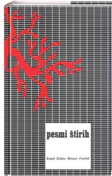
Slika 5: Zbirka Pesmi štirih