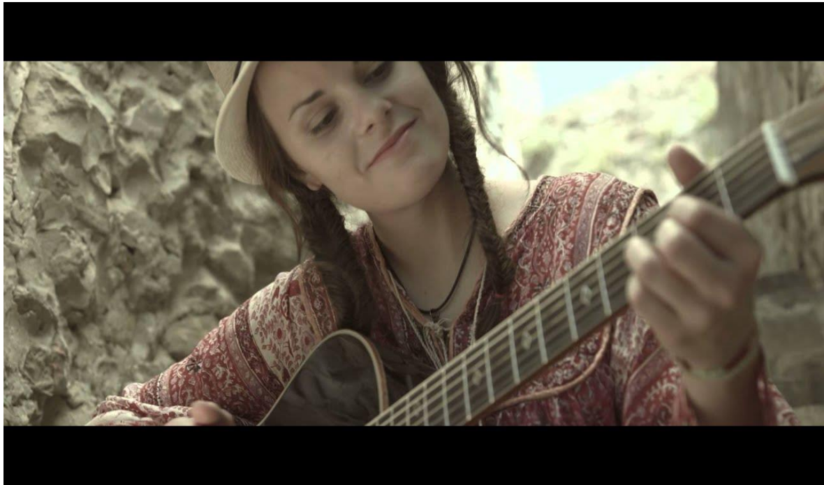
Slika 17: Ditka