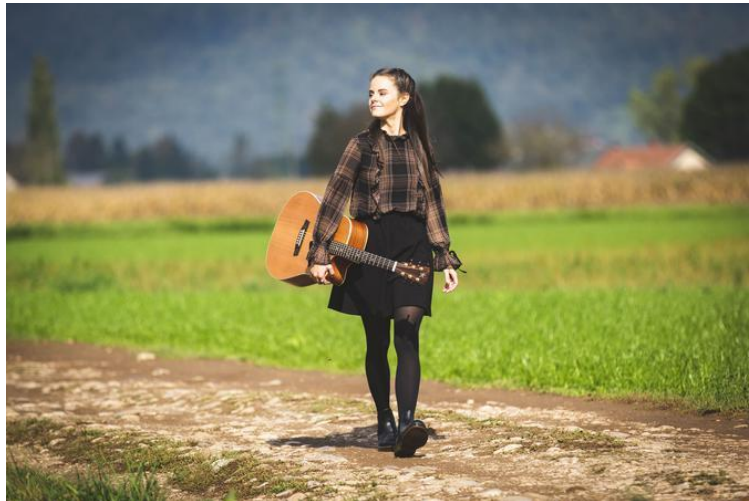
Slika 19: Ditka