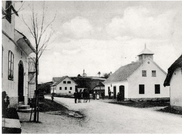
Slika 2: Pouk v gasilskem domu