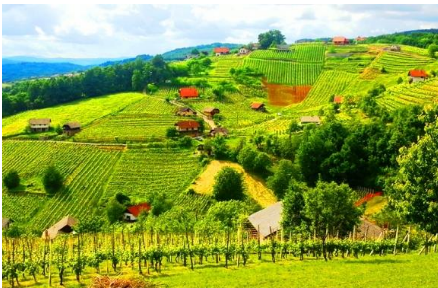
Slika 13: Gričevnata Dolenjska