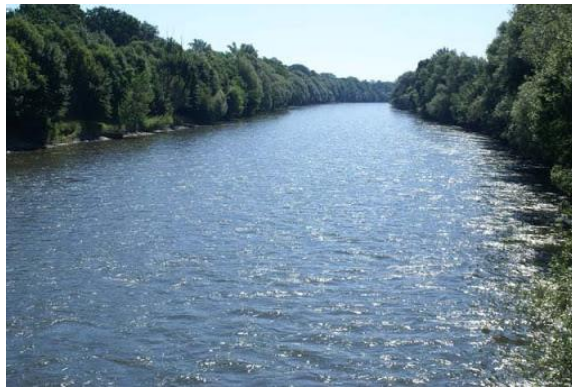
Slika 8: Mura