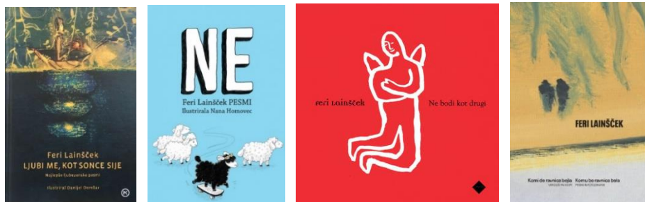
Slika 10: Nekatere Lainščkove pesniške zbirke

Vir: ( https://www.mladinska.com/avtorji/feri-lainscek )