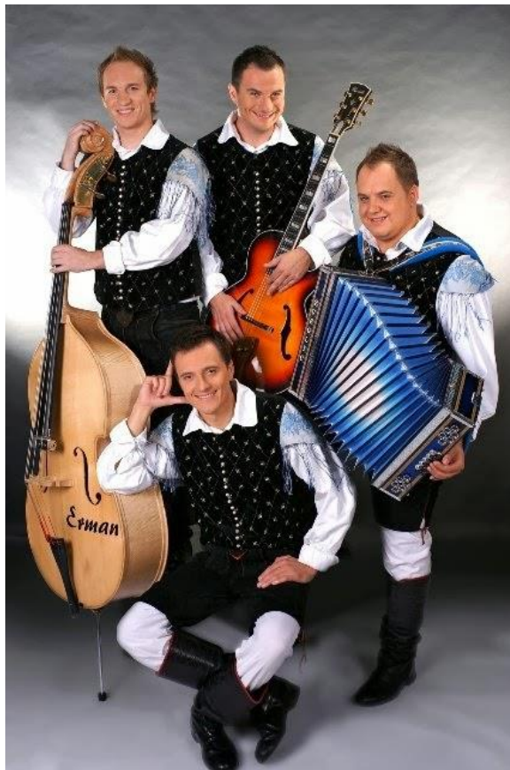
Slika 20: Ansambel Modrijani