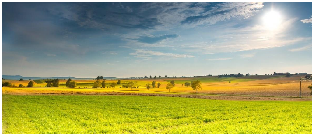
Slika 12: Prekmurske ravnice