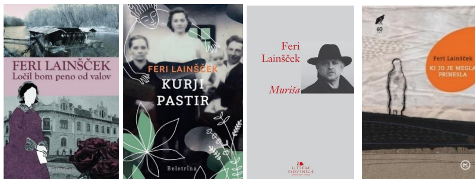
Slika 9: Lainščkova pripovedna dela

Vir: ( https://www.dobreknjige.si/Avtorji.aspx?avtor=Feri+Lain%C5%A1%C4%8Dek )