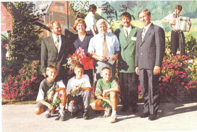
Slika 6- organizatorji prireditve z gostom Milanom Kučanom ter ženo Štefko Kučan (vir: zbornik prireditve Družina poje, 2003,)