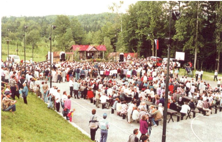
Slika 3

Od samega začetka je torej prireditev spremljal moto »Peli so jih mati moja«. Zakaj takšen moto? Mati je tista, ki podari prve besede, ki poje detetu in mu pesem ter verze tako rekoč položi v zibelko. Materina pesem je vrednota, ki se je ne smemo sramovati.