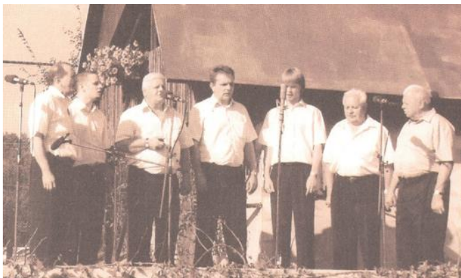
Slika 1 (vir: zbornik prireditve Družina poje 2008, foto: neznano)

(vir: zbornik prireditve Družina poje, Peli so jih mati moja, 1998, str. 13)