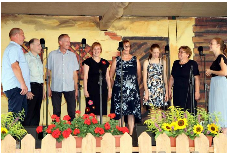
Slika 5-

Kljub manjši naklonjenosti časa in okolja se je domača ljudska pesem ohranjala in okrepila povezanost ter prijateljstvo v družini. Tudi to je bil eden izmed glavnih namenov prireditve. S prireditvijo se je vse, kar se je v tistem času začelo izgubljati, postavilo na noge. Vedno več je družin, v katerih se prepeva. Danes sicer nastajajo bolj družinski ansambli, vokalne skupine, ki gojijo tudi inštrumentalno glasbo, zato ne moremo govoriti ravno o tistem znanem ljudskem petju nekoč, ko je družina zbrana za skupno mizo in zapoje brez glasbil. S samo prireditvijo se je kraj povezal, vsi smo ponosni nanjo. Pri nas je vsaka zadnja avgustovska nedelja zadnjih 35 let praznik za ljudsko pesem. Upamo, da bo živela tudi v prihodnje.