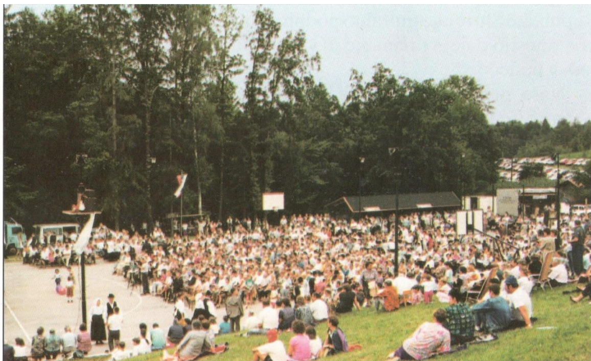
Slika 4 (vir: zbornik prireditve Družina poje, 1998, foto: neznan)

(vir: zbornik prireditve Družina poje, Peli so jih mati moja, 2003)